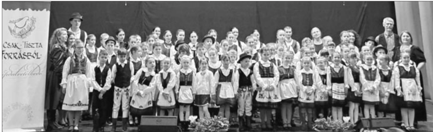
Népes dalossereg méretkezett meg a megyei válogatón