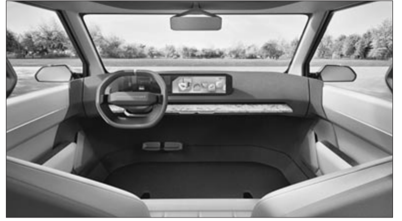
Kia EV2-konceptió, beltér