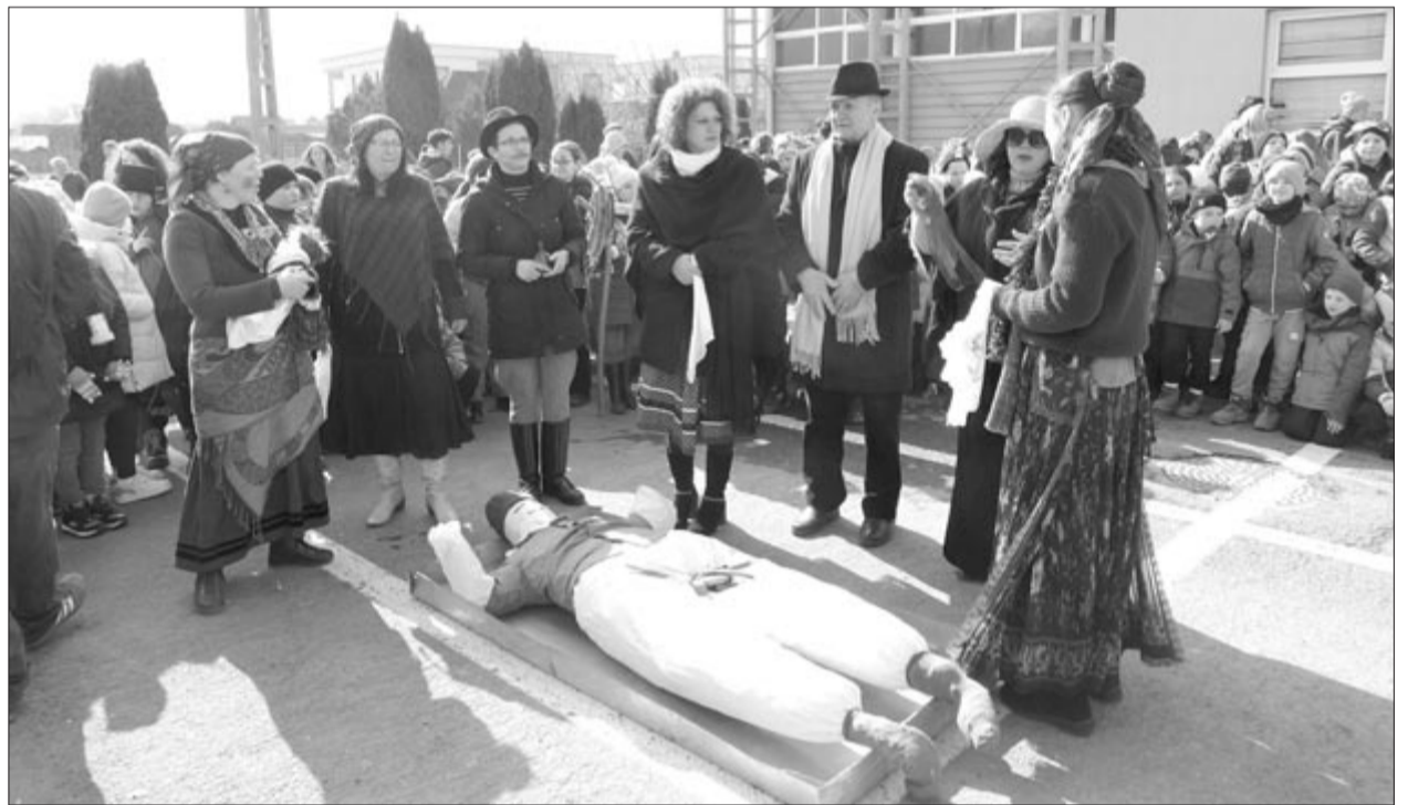
Többször is megállt a menet, elsiratták Illyést