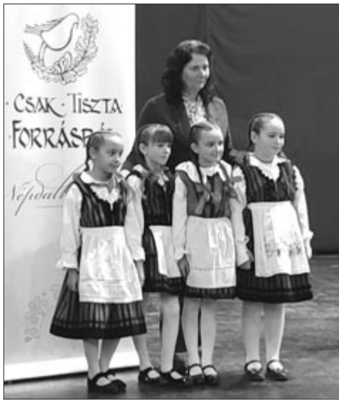
Számos tehetség lépett a szakemberek elé értékes népdalokkal