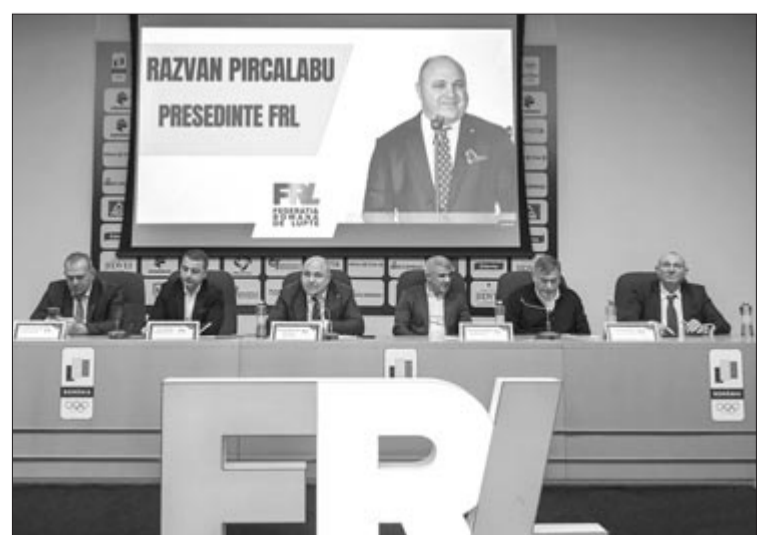
A Román Birkózó Szövetség közösségi oldala

Székfoglaló beszédében az újválasztott elnök megköszönte a bizalmat. Azt mondta: csapatával tizenkét éve képviseli és vezeti a román birkózósportot, és reméli, hogy nem okoztak csalódást, illetve megfeleltek az elvárásoknak. „Azonban hiányérzetem van, mert a legutóbbi két olimpián nem sikerült érmet szereznünk. De nem adom fel, mindent megteszek azért, hogy ez az álom valóra váljon” – mondta Răzvan Pîrcălabu.