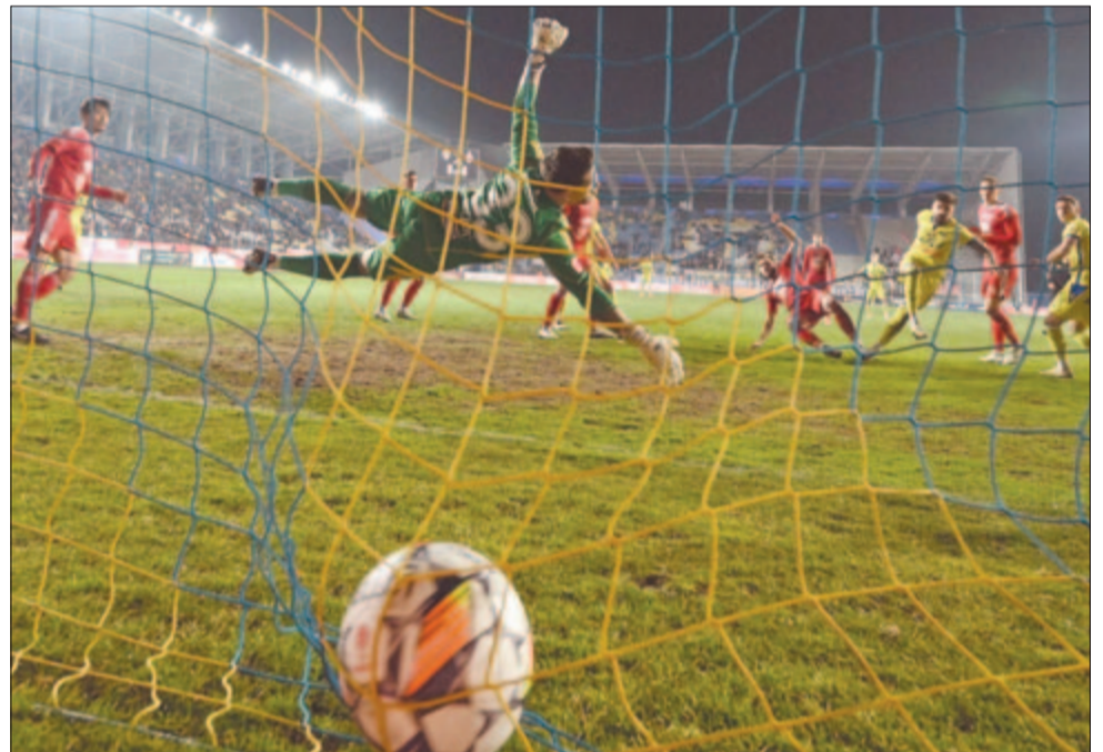
A 72. percben bekövetkezett az elkerülhetetlen, gólt kapott a Seps OSK

Szuperliga 30. forduló: Galaci Suporter Club Oțelul – Jászvásári CSM Politehnica 2-3, Konstancai FCV Farul – Kolozsvári FCU 1-1, Petrolul 52 Ploiești – Sepsiszentgyörgyi Seps OSK 1-0, Nagyszebeni Hermannstadt – Bukaresti Rapid 1923 1-0.