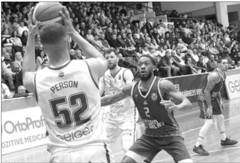
Nagy lehet a baj Personnal