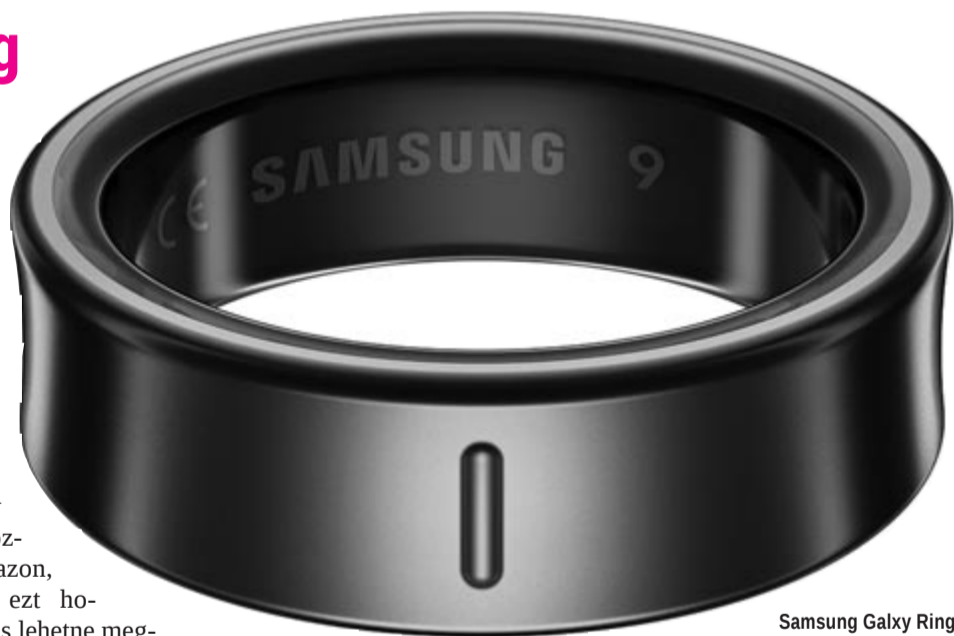
Samsung Galaxy Ring

A szabadalom koreai nyelven íródott, és a Gizmodo is csak gépi fordítással tudott kihámozni belőle néhány érdekességet, de már ezek is elég sokat sejtetnek. A Gizmodo angol összegezése szerint valamilyen vezeték nélküli kapcsolaton keresztül kommunikálna egymással a gyűrű és a számítógép, azonban az egyelőre nem ismert, hogy milyen gesztusokra lehet számítani