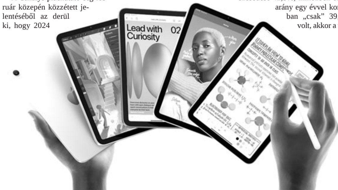
Apple iPad, illusztráció

Éves összevetésben is nagy meglepetés a Lenovo, amely a piaci átlagot meghaladó 12%-os növekedést produkált tavaly. A 9,3 milliós eladási mennyiséget 10,4 millióra növelte, ennek következtében a kínai vállalat piaci részesedése 6,9%-ról 7,1%-ra nőtt. Végül, de egyáltalán nem utolsósorban a Xiaomi 73,1%-os valóságos kilövéséről is említést kell tenni. A kínai vállalat 5,3 millióról 9,2 millióra növelte az eladásait, ennek eredményeképpen pedig már nem 3,9%, hanem 6,2%-os piaci részesedést birtokol.