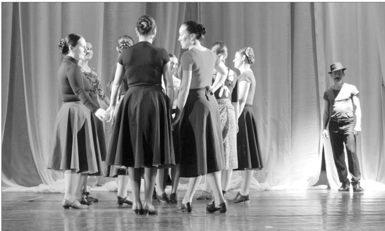
Próba közben az együttes

A Láthatatlan ünnepek bemuta- tójára március 7-én, pénteken 19 óra várják a Maros Művészegyüt- tes közönségét a kövesdombi szék- helyre. A nőnap előadásaként született táncjátékot március 8-án, szombaton szintén 19 órakor lehet újra megtekinteni a székházban. Jegyek elővételben a 0757-059- 594-es telefonszámon vagy a bi- lete.visitmures.com honlapon foglalhatók.