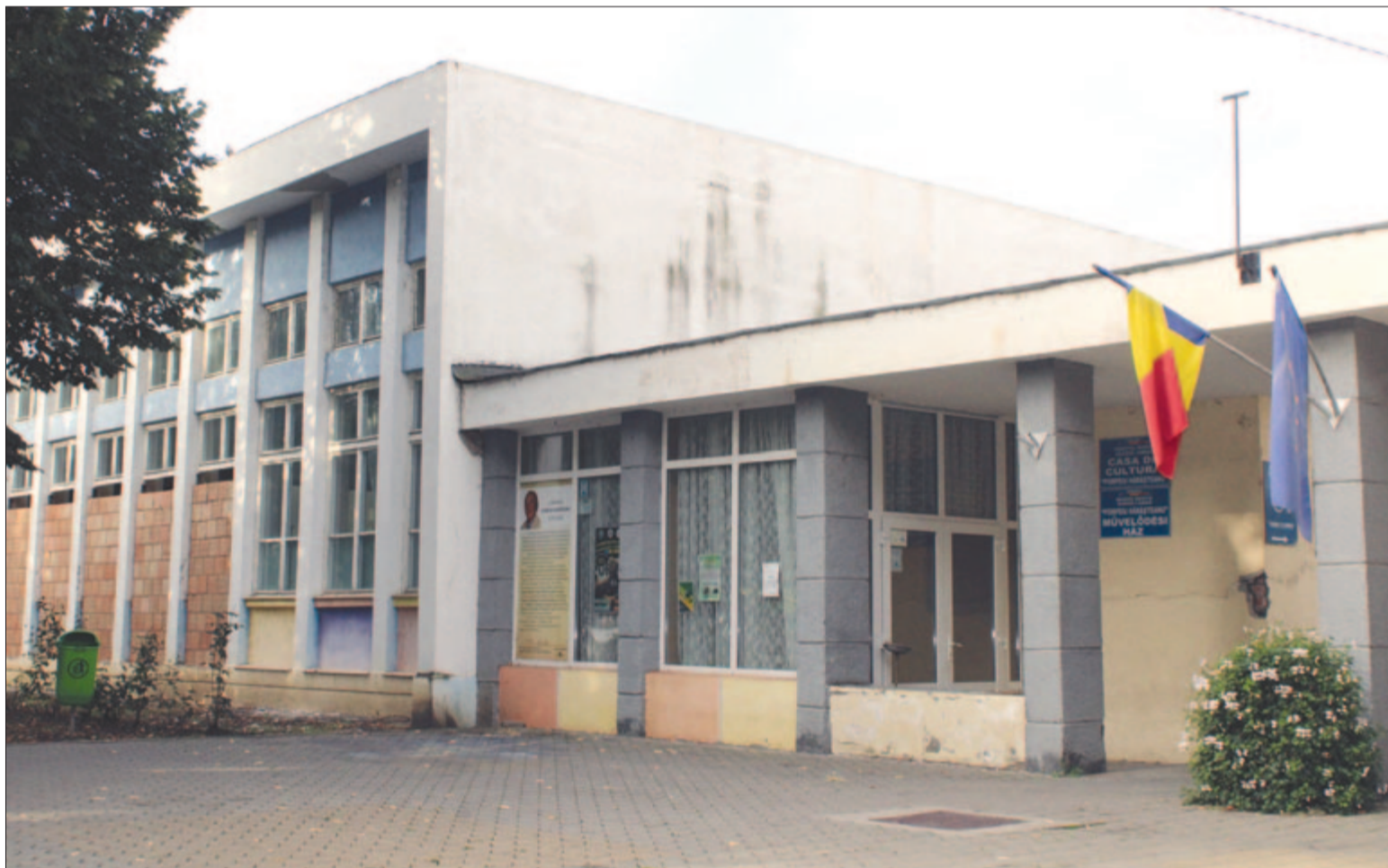
Felvételünk 2023-ban készült, a helyzet azóta is változatlan