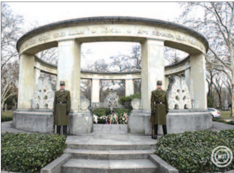
Koszorúk Jókai Mór síremlékénél a Fiumei úti sírkertben 2025. február 18-án, az író születésének 200. évfordulója alkalmából rendezett megemlékezésen.

A hirado.hu-n található kvíz kitöltésével bárki tesztelheti, mennyire ismeri Jókai Mór életét, munkásságát, emellett a Duna és az M5 közösségi oldalán heti nyeregményjátékban is részt vehetnek – áll a közleményben.