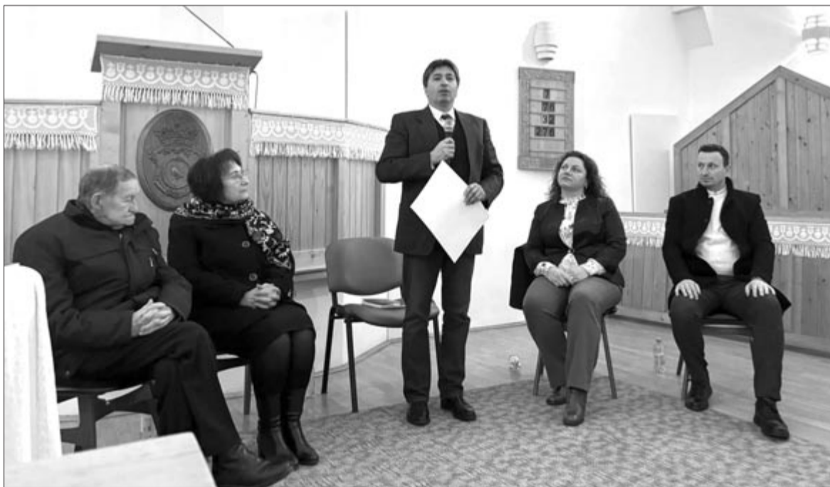
Nyárádszeredában öt este beszélgettek a házasság kihívásairól, a kommunikáció szükségességéről

A marosvásárhelyi-cserealji református gyülekezetben is voltak házasság hetéhez kapcsolódó események: a házasság keretében nemcsak házasságok beszéltek az internet szülőkre és gyermekekre gyakorolt hatásáról, a cybervilágról (online és okoseszközök világa), annak működési sajátosságairól és veszélyeiről, és hallhattak a helyes használathoz fűződő javaslatokat is. Azt megelőzően házasságok szerveztek a gyülekezetben, amikor házaspárokat vártak kapcsolatuk megerősítésére, felüdítésére.