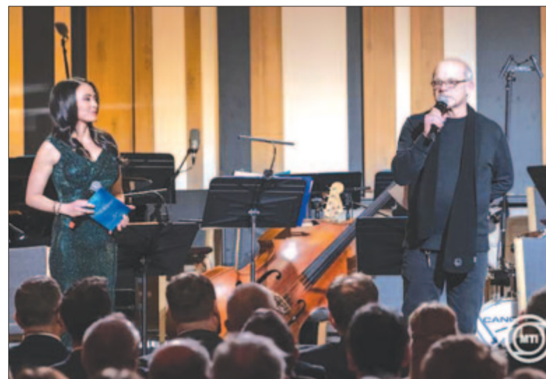
Gőz László dzsesszzenész, harsonaművész, a Budapest Music Center alapító igazgatója (jobb) beszél, balról Morvai Noémi, az M5 kulturális csatorna műsorvezetője a Közmédia Év Embere 2024 Díj átadónapságán és a Kurtág 99 koncerten a Budapest Music Centerben.