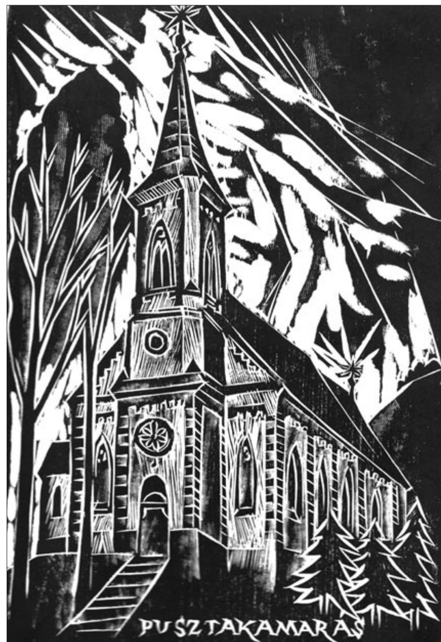
A pusztakamarási templom

25 éve hunyt el a fehéren világló templomtornyok szerelmese