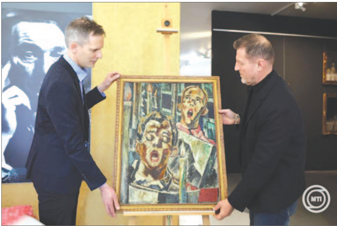
Kohán György festőművész egy korai, expresszív műve, az Éneklő fiúk című festményt a gyulai Kohán Képtárban a visszaadás napján, 2025. február 10-én.

Kohán György Gyulán született 1910. február 22-én, és ott is halt meg 1966. december 16-án. Kosuth-díjas festőművész és grafikus volt, alapító tagja a hódmezővásárhelyi Tornyai Társaságnak. Művészi hagyatéka – mintegy 600 festmény és 2500 grafikai mű – a gyulai Erkel Ferenc Múzeumhoz került, de őriz tőle műveket a budapesti Magyar Nemzeti Galéria, a békéscsabai Munkácsy Mihály Múzeum és a hódmezővásárhelyi Tornyai János Múzeum is, továbbá vannak alkotásai magántulajdonban is.