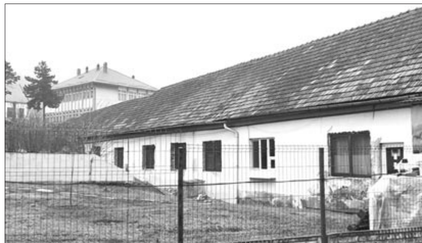
Hosszú idő után elkezdheték az alsó belgyógyászati épület korszerűsítését

Ezen a héten beköltözhetnek a Dózsa György úti iskolába a Szent György Technológiai Líceum 0-4. osztályos kisdíákjai. Többéves felújítás és bővítés után nemcsak az épület újult meg, hanem annak teljes bútortáza is. Minden osztályterembe okostáblákat, korszerű taneszközöket szereltek. Emellett a folyosókat tematikus dekorációk díszítik, amelyek többek között a tudomány, a művészet és a magyar népmese világát elevenítik meg néhány lelkes pedagógus munkájának köszönhetően.