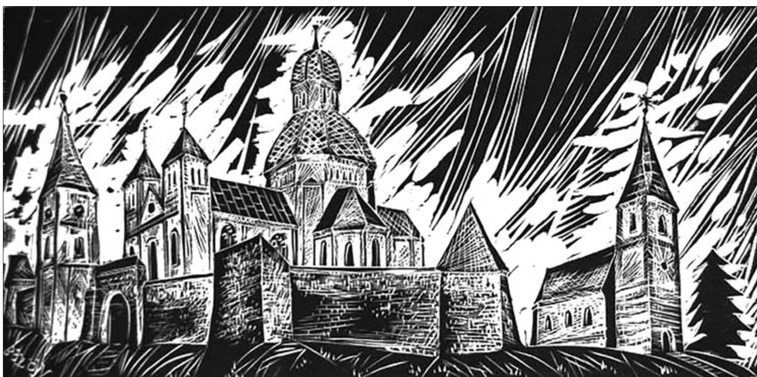
Molnár Dénes: Bölon – Mellékletünket Molnár Dénes alkotásaival illusztráltuk