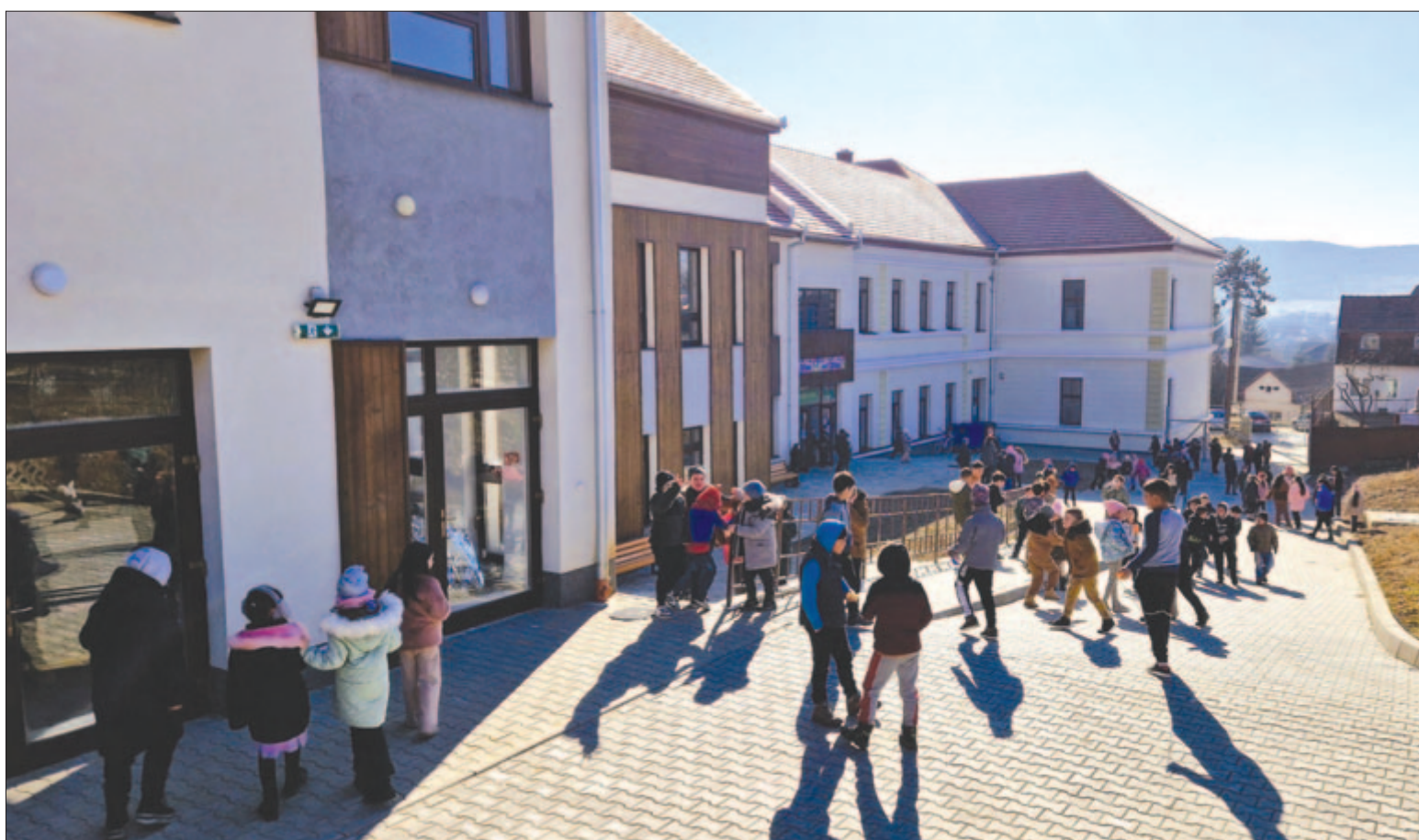
A „régii líceum” minden szárnya megújul, energiatakarékos és tűzbiztos lesz