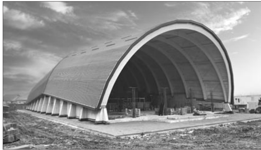
Haladnak a tanuszoda építésével, idén szeretnék befejezni

Tavaly átadták a korszerűen felújított, felszerelt járóbeteg-rendelőt, korábban kibővítették a részleget, beépítették a tetőteret is, különböző orvosi eszközöket vásároltak, többek között egy olyan nagy teljesítményű röntgengépet, amelyből kevés van az országban. Mindezek részei a városi kórház korszerűsítési folyamatának. Tavaly elkezdődtek a munkálatok az úgynevezett alsó belgyógyászati részlegen is. Egy energiahatékonyság-növelő projekt keretében kicsérlik a