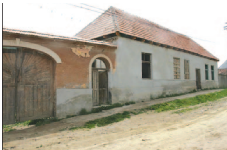
Ennek a háznak a helyén állhatott Bolyai Farkas szülőháza Bolyában (mára ez is átépült)

Csak vázlatosan tudom összefoglalni Bolyai Farkas irodalmi tevékenységét: az első drámapályázaton (amelyen Katona