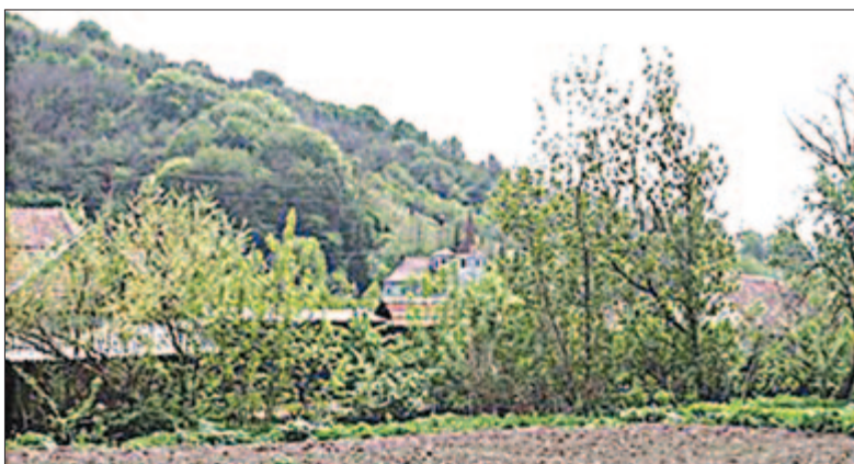
Ez lehetett az a kert, ahol Bolyai Farkas felcseperedett Bolyában

Bolyai Farkas tevékenységét és Marosvásárhelyre gyakorolt hatását nem lehet túlszárnyalni, emlékezzünk rá kegyelettel születésének negyed évezredes ünnepségén, 2025. február 9-én.