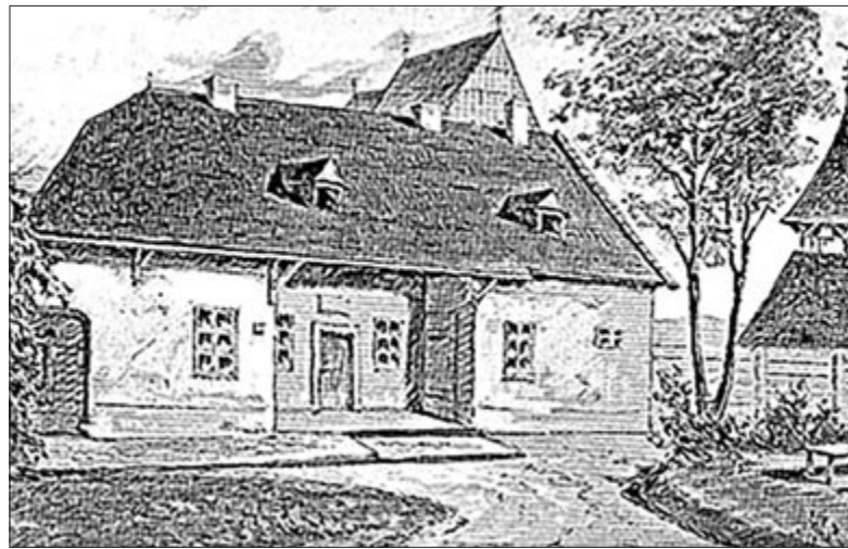
Bolyai Farkas marosvásárhelyi szolgálati lakása