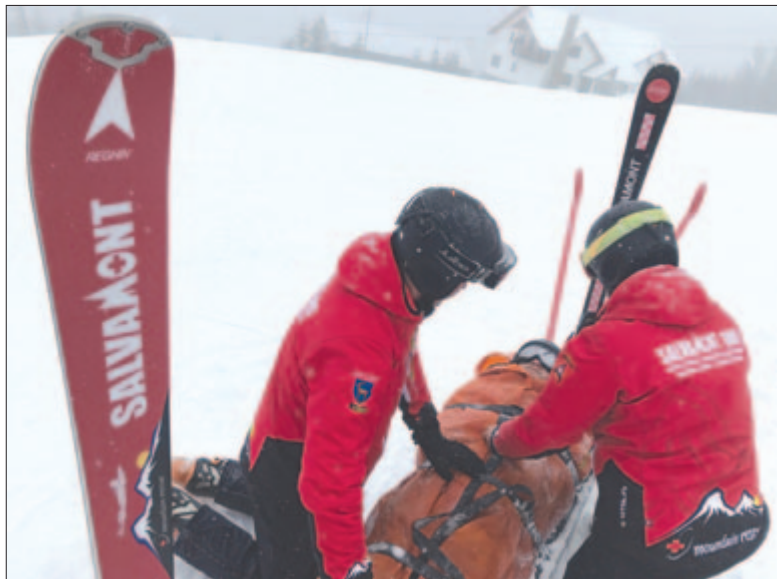
Bevetésen a hegyimentők

De megemlítem például az Isten-székét, ami népszerű kirándulóhely, nem nehéz túraútvonal, bárki meg tudja közelíteni, ellenben a meredek szakaszokon sokan balesetet szenvednek, ereszkedéskor leesnek, eséskor pedig a sziklásabb terepen