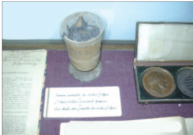
Bolyai Farkas verseinek hamvvedre

Buzdítanám fiatal kollégáimat, a fiatal kutatókat, hogy a Bolyai-kutatás nem lezárt terület, sőt ennek művelése igazi hungarikum. Ezt rajtuk, erdélyi kutatókon kívül senki sem fogja hatékonyan elvégezni, mert a kéziratok feldolgozásán kívül helyes dolog bejárni a román levéltárakba is, tisztában kell lenni a korabeli erdélyi állapotokkal, és persze azért „hű fiait kell maradni a jelennek” is.