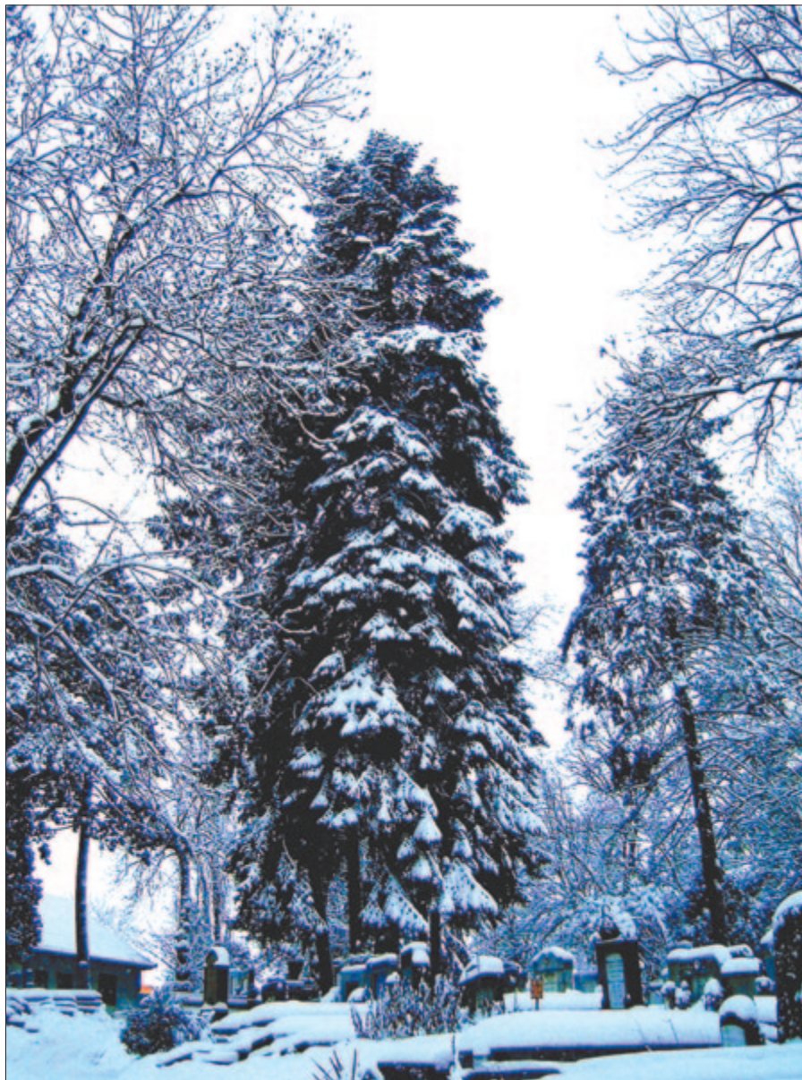
Apáink hűlő, drága arcán járunk

Maradok kiváló tisztelettel. Kelt 2025-ben, február első hetének végén