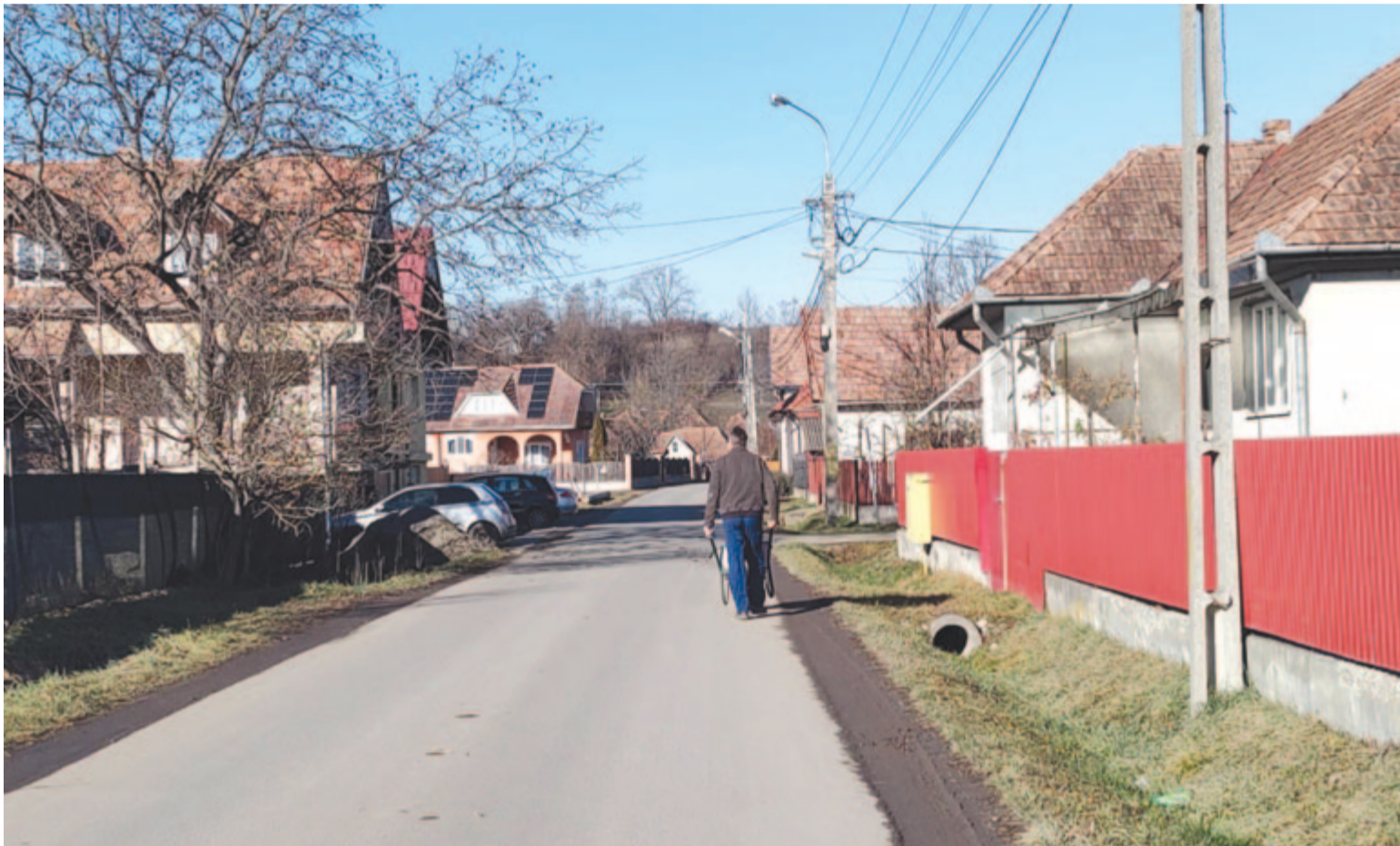
Huszonkét utca korszerűsítése következik