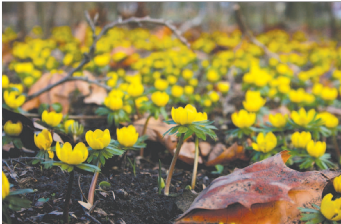
A Bodor kút környén a Margitszigeten téltemetőrért csilingel arany tavasz