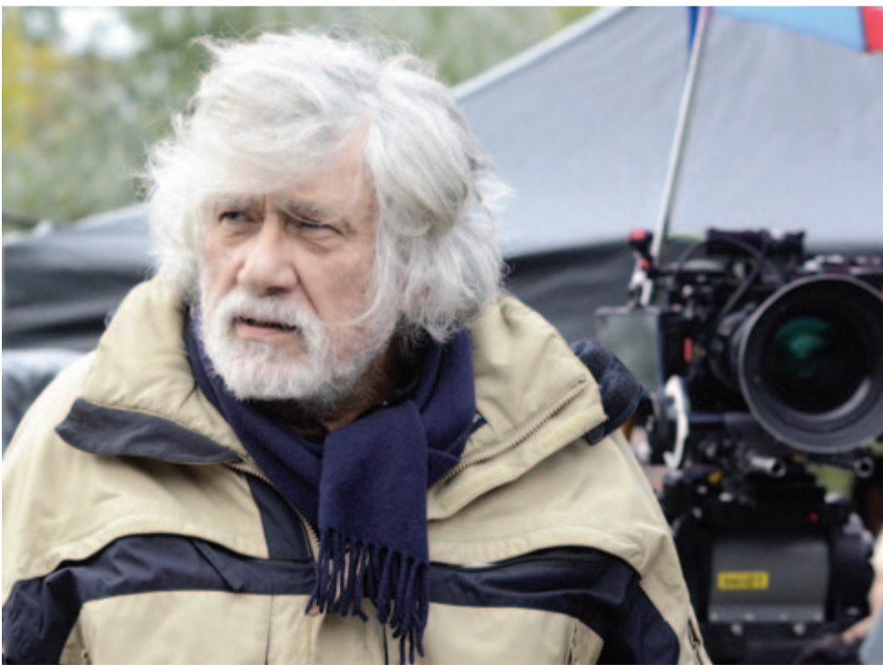
Vitézy László Kossuth- és Balázs Béla-díjas filmrendező, producer, érdemes és kiváló művész. A felvétel 2015. október 16-án készült Vitézy Lászlóról Vesznyben, A teremtet háta mögött című filmje forgatásán egy kompon.