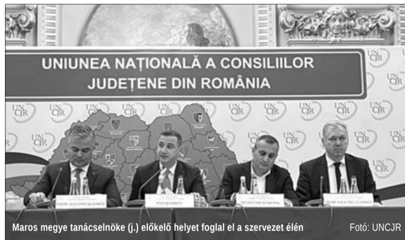
Maros megye tanácselnöke (j.) előkelő helyet foglal el a szervezet élén

Székfoglalójában a szervezet új elnöke a megyei tanácsok közötti együttműködés és közös képviselet