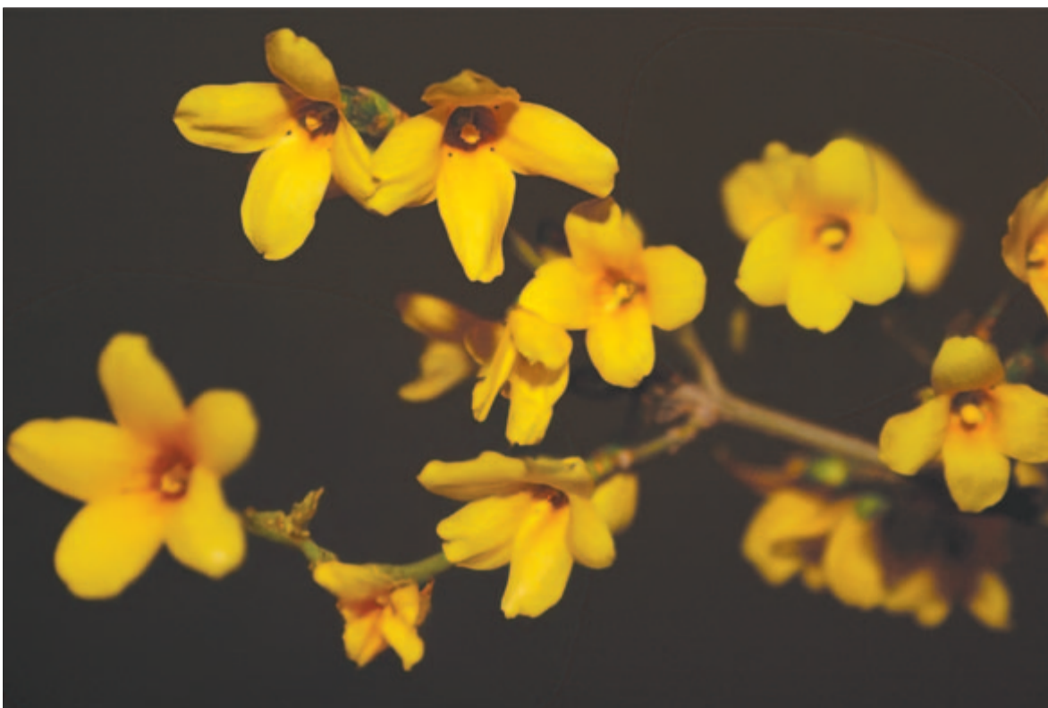
Aranyvessző aranyárga dala

Gyertyaszentelő hidege Kora tavasznak hírnöke.