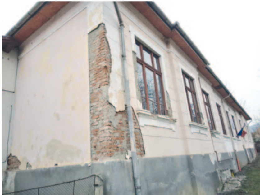
Nyáron elkezdik a bergenyei iskola felújítását

Szeretnénk lépni az ingatlanügyek rendezésében, a birtoklevelek, telekkönyvek kiállításában, idén is részt veszünk az országos katasztrerezési programban, azokra a falvakra fókuszálunk, ahol kevesebb ilyen jellegű ügy oldódott meg az elmúlt években. A területrendezési tervünk olyan fázisba került, hogy tavasszal meglesz az a változat, amellyel hosszú időszakra a fejlesztési irányt fogjuk megszabni. Az új területrendezési terv meg fogja határozni az új beépíthető területek helyét, azt, hogy hol koncentrálódnak a gazdasági jellegű beruházások, hol a lakossági beruházások.