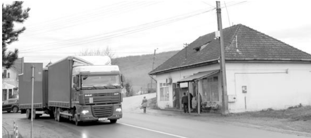
Az Alsó-Nyárad mentén is hatalmas az áthaladó teherforgalom

– Jelenleg a romániai országos közutakon az utadommatrica értékesítésére és ellenőrzésére vonatkozó hatályos jogszabályokat a 2002. évi 15-ös számú, a romániai országos közúthálózatot a használati díj alkalmazásáról szóló rendelet képviseli, amely 2002. február 1-jétől 2025. december 31-ig hatályos. A fent említett rendelet alkalmazásában a romániai országos közúthálózatot az Országos Közúti Infrastruktúra-kezelő Társaság kezeli. Azzal kapcsolatban, amely a Brassó Megyei Tanács által javasolt úthasználati díj jogszerezésére vonatkozik – amely csak a Brassó megyén belüli megyei utakon alkalmazható –, a CNAIR nem tud nyilatkozni, mivel a megyei utak nem tartoznak a CNAIR igazgatása alá – válaszolta az Országos Közúti Infrastruktúra-kezelő Társaság.