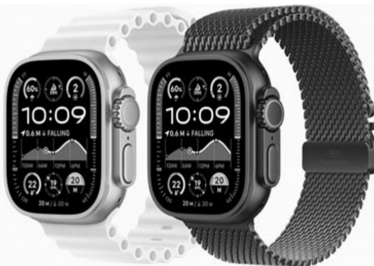
Forrás: Huawei Apple Watch Ultra