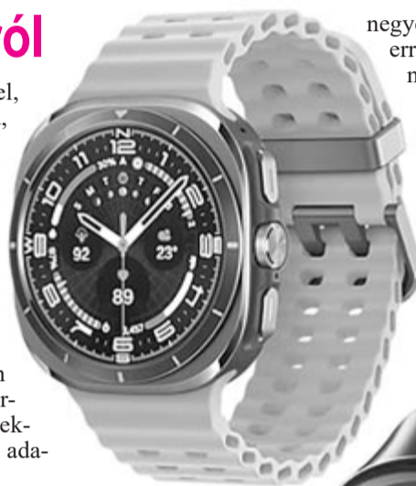
Samsung Galaxy Watch Ultra

Összességében tehát kevéssel, de csökkent a csuklón viselhető eszközök eladása 2024 első három negyedében, és megváltoztak az erőviszonyok. Ugyanakkor a jövőre nézve ez egyfajta tanulság is a gyártóknak, hogy nem feltétlenül az olcsó termékekkel lehet piacot hódítani, hanem nagyobb hangsúlyt kell fektetni az egészségmegőrző, életjeleket monitorozó funkciókra. Továbbá az is nagy kérdés, hogy egypár éven belül miként fogják megváltoztatni a piaci viszonyokat az okosgyűrűk.