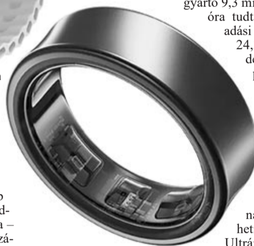
Okosgyűrű, illusztráció