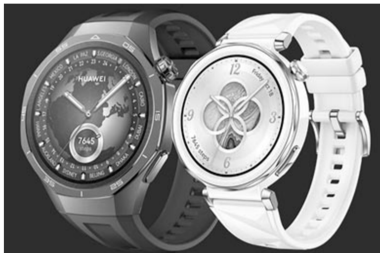
Huawei GT5 és GT5 Pro