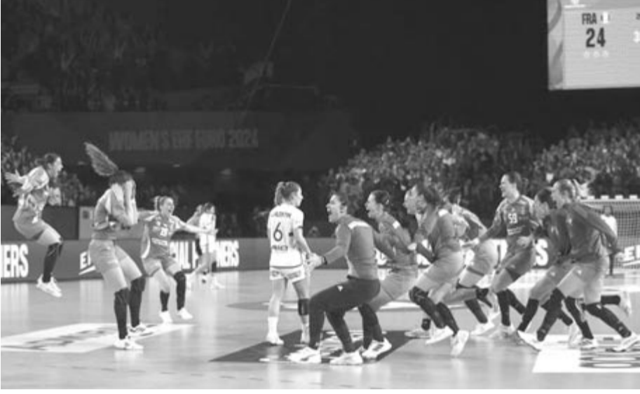
A magyar válogatott öröme a világbajnok és olimpiai ezüstérmes francia csapat ellen 25-24-re megnyert bronzmérkőzés végén

Golovin Vlagyimir szövetségi kapitány szerint a magyar női kézilabda-válogatott Európa-bajnoki bronzérme igazi csodának számít Magyarországon.