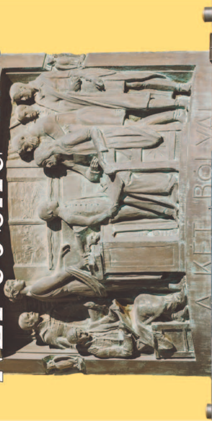
250 éve született Bolyai Farkas