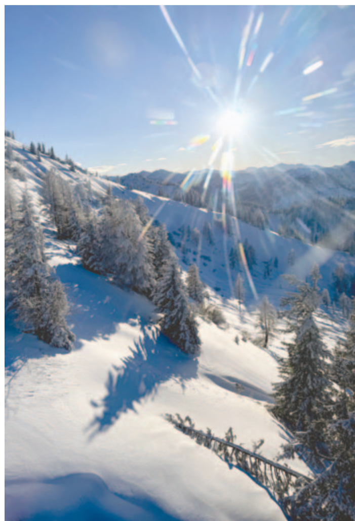
A Nap-csillag izzó merengése az égen

Csúcsaimon ragadozók települnek le: karmos ölyvek.