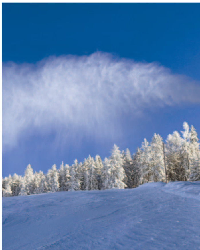
Fenyves ködfolt-sóhaja lélegzetet fest a kék békességbe

Maradok kiváló tisztelettel. Kelt 2024-ben, Szilveszter napján