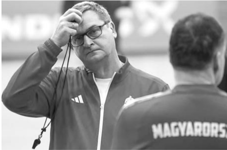
Golovin Vlagyimir szövetségi kapitány a magyar női kézilabda-válogatott edzésén a debreceni Főnix Arénában 2024. november 27-én, egy nappal a kontinentszorna kezdete előtt

Golovin Vlagyimir elárulta, a mérkőzések között általában egy edzést és két videóelemzést tartanak, de a franciák elleni győztes bronzmeccset videózás nélkül megúszták a játékosok. „A 26 nap alatt még jobban megszerettük egymást, így a szavak is elegendők voltak. Tudták, mit kell tenniük. Nevettünk, és mosolyogva mentünk a meccsre. Fejben amúgy is szállóágban voltak, így aligha ragadtak volna meg az új információk” – mesélte.