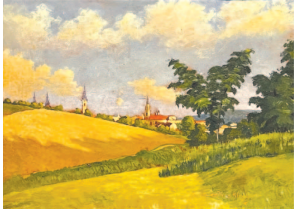
Kós Károly: Kalotaszegi táj

Székely János 1954-ben írta volt A sír című költeményt a Bolyai hagyatéka szonettkoszorú negyedik darabjaként. Bár a vers keletkezésekor már rég apja mellett nyugodott az éppen 222 évvel ezelőtt, 1802. december 15-én született legnagyobb matematikusunk, Bolyai János , mégis hadd említsük meg itt, hogy Bandi Árpád nyugalmazott matematikatanárnak köszönhetően 2010 januárja, Bolyai János halálának 150. évfordulója óta kopjafa jelöli sírhelyét, ahol 1860 és 1911 között nyugodt,