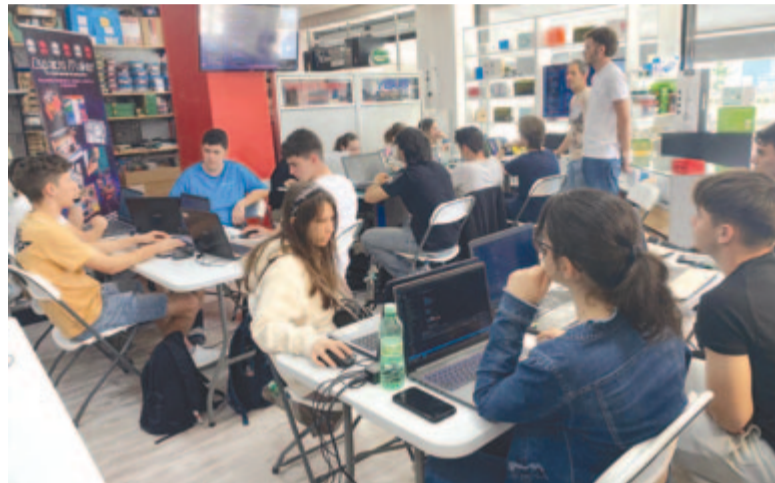
Felszerelt környezetben tanultak a bolyais diákok a webfejlesztésről Spanyolországban

tudja eleveníteni az ismereteket. Továbbá kiemelte, hogy a webfejlesztésnek van jövője, és nagyobb hangsúlyt, akár külön tantárgyat is kellene szentelni neki, hiszen mind a szakmai hátteret, mind a türelmet meg kell tanítani. A webfejlesztés