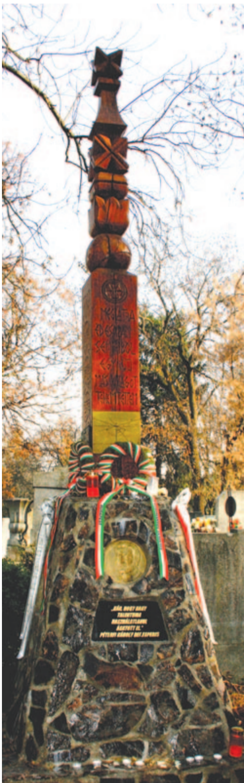
Bolyai János kopjafája 2010 novemberében