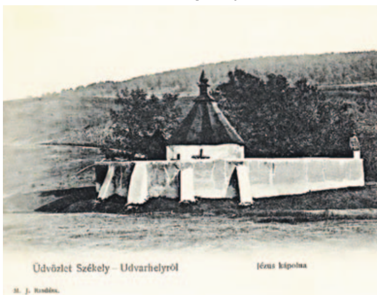
Üdvözlét Székely – Udvarhelyről

* A rendelkezésünkre bocsátott dokumentációkért külön köszönet Keresztes Géza műépítész, műemlékvédő szakmérnöknek; az illusztrációkat, a régi és a mai képeket Demján László műemlékvédő építész a saját munkájából és gyűjteményéből küldte el a szerzőnek.