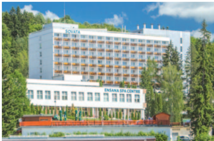
A szovátai Ensana szállodalánc volt az idei konferencia házigazdája

de volt külföldi vendég is közöttük. A rendezvény a gyógyturizmus fellendítését, a helyi turizmus fejlesztését is segíti, és a szervezők úgy vélik, hogy egy ilyen konferencia nem csupán új együttműködések hozhat számukra, hanem a gyógykezelésre érkezők számának növekedését is eredményezheti. (GRL)