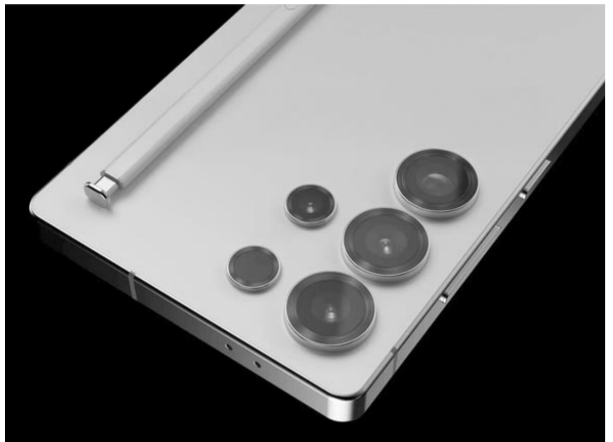
Samsung Galaxy S25 Ultra, koncepció

Beszélni kell az árról, merthogy a legfrissebb híradások szerint az S25 Ultra anyagköltsége legalább 110 dollárral emelkedett az elődmodellhez képest. A Samsung pedig egy profitorientált vállalat, ami azt jelenti, hogy a többletköltséget egyértelműen a vásárlókra fogja behajtatni, vagyis már most lehet készülni egy magasabb árra. Az egyedüli kivételt Kína jelentheti, ott ugyanis – a jelenlegi információk fényében – nem fogja átterhelni a vásárlókra a többletkiadást a vállalat, mivel egy nagyon kompetitív piacról beszélünk, ahol nemes egyszerűséggel nem merik bevállalni ezt a lépést, a Föld többi részén viszont igen. Öröm az örömben, hogy a „kistestvérek”, vagyis az S25 és az S25+ ára még némileg csökkenhet is, mivel a gyártó egy kisebb méretű, illetve alacsonyabb tudású