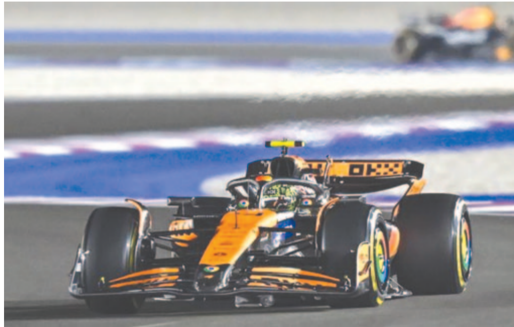
Lando Norris, a McLaren brit versenyzője a Forma-1-es autós gyorsasági világbajnokság Katari Nagydíjának sprintkvalifikációjában a loszaili pályán 2024. november 29-én.

A futamot a világelső teniszező, az olasz Janik Sinner intette le.