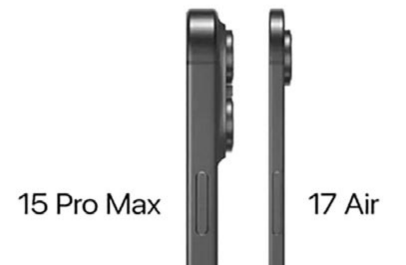
Az iPhone 17 Air vastagsága összehasonlítva a 15 Pro Maxéval

értelmében az Airnek mindössze egy kamerája lesz. Ilyen értelemben az vitán felül kijelenthető, hogy az Apple nem a fotózás szerelmesei- nek szánja ezt a készüléket, hanem azon felhasználóknak, akik egy vé-kony telefont szeretnének maguk- nak, amely nem vesztődik el a kezükben. Azonban ezzel együtt is 2025 második felében – amikor vár- hatóan megjelenik az Air – egy ka- mera nemhogy kevés, hanem nagyon kevés!