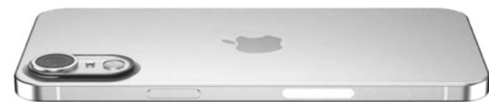
iPhone 17 Air, koncepció

egóriás iPhone 16 Pro Maxot. Senki számára nem meglepetés, hogy jövőben megérkezik az iPhone 17 modelleszad, azonban itt már kevés annak az esélye, hogy ebből készül Plus kivitel. Minden jel arra mutat, hogy ahogy az iPhone Mini széria, úgy a Plus változatok sem arattak sikert a márka vásárlói között, így az Apple most elkaszálja ezt a vonalat is. A Plus pedig a jelek szerint a teljesen új Air fogja váltani, ami – ahogy a neve is mutatja – vékony lesz, méghozzá nagyon vékony.