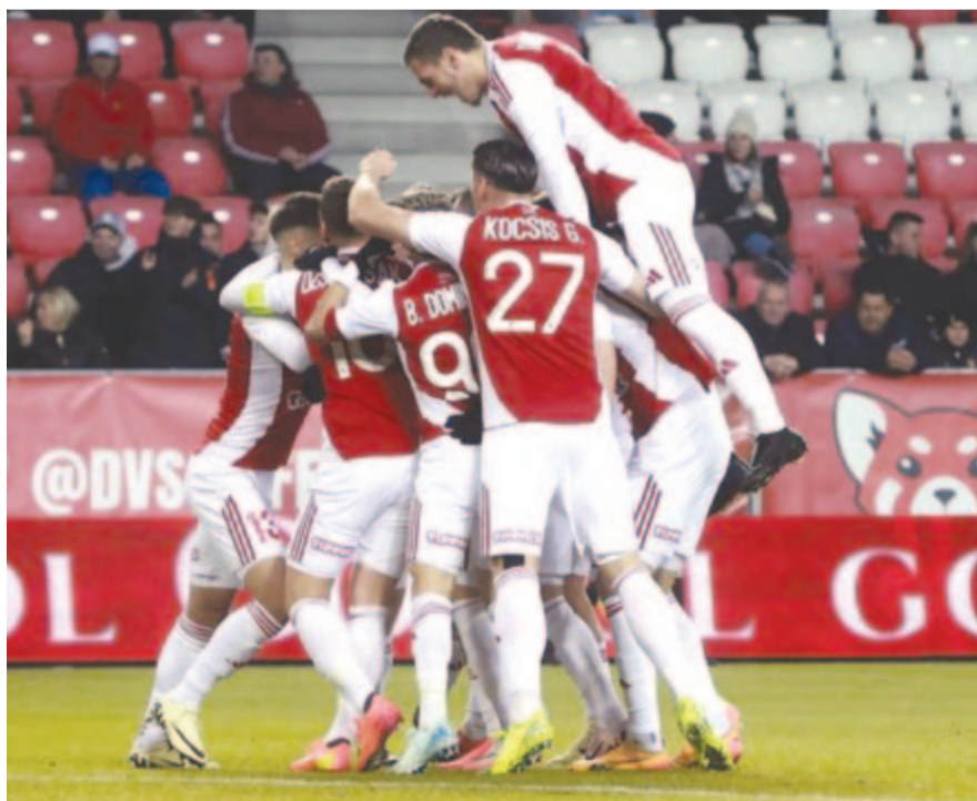
Debreceni játékosok gólrőre a Debreceni VSC – Ferencvárosi TC mérkőzésen a debreceni Nagyerdei Stadionban 2024. december 5-én

A folytatásban valamivel kevesebb volt a helyzet, majd a 82. percben Cissé a lecsorgó labdát a kapuba passzolta, amivel az FTC a hajrára újra visszajött a meccsbe. A bajnokcsapat az utolsó pillanatig küzdött az egyenlítésért, a Debrecen azonban végül megőrizte előnyét és otthon tartotta a három pontot.