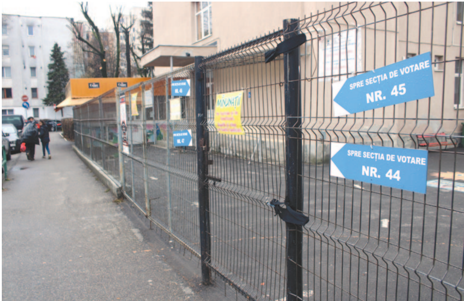
December 8-án zárva maradtak a szavazóhelyiségek