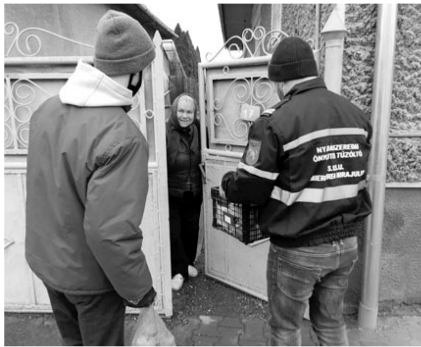
Számos közösség, csoportosulás szeretne segíteni ünnep előtt a rászorulókon