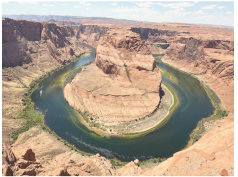
A Patkó-kanyar a Colorado folyón, Page határában

Az egyik ilyen csoda a Colorado folyón található Patkó-kanyar (Horseshoe Bend). Nem