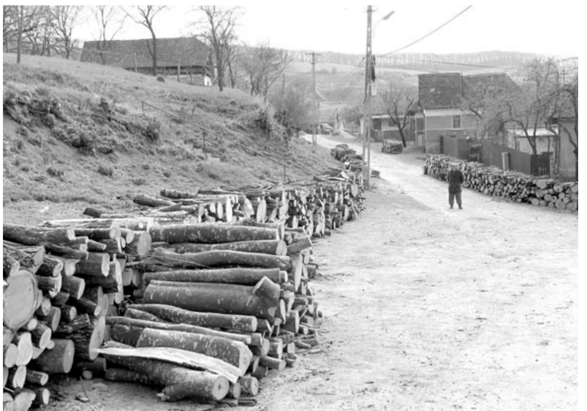
Nem beszélhetünk esélyegyenlőségről az energiaszektorban

A jogszabály a megfelelő európai uniós minimálbérekről szóló 2022/2041-es irányelvet ülteti át a román jogrendbe. A törvény szerint a bruttó minimálbért évente kor-