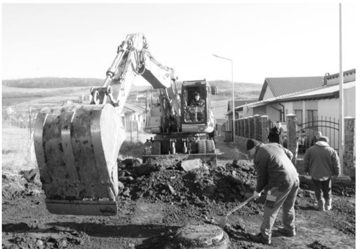
Évente egyszer aktualizálják majd a bruttó minimálbért

Tény ami tény, az alacsony jövedelemmel rendelkező családok, az egyedülálló személyek és a kisnyugdíjasok novembertől jövő márciusig kapnak segítséget a földgáz, a villamos energia vagy a szilárd és olaj tüzelőanyagok költségeinek fedezésére. A jogosultsághoz az egy főre eső havi nettó jövedelem nem haladhatja meg az 1386 lejt. Az igényléseket a támogatási időszak-