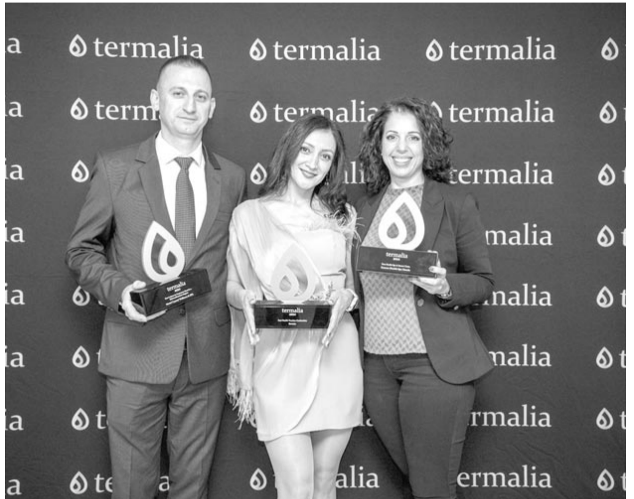
Szováta három díjat vehetett át az idei versenyen