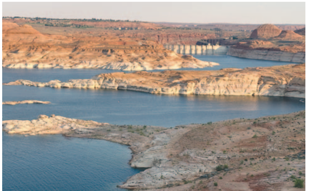
A Glen Canyon gát és a Powell-tó

Alkonyodott már, amikor a tópart mentén autózva beléptünk a rekreációs területre. Végiggyönyörökdöttük a kontrasztos tájat, figyeltük a békésen sikló jachtokat, majd felkerestük a térképen bejelölt szabadstrandot. Látva, hogy mások is fürdőznek, kedvet kaptunk a lubickoláshoz. A lemenő nap bíbor sugarai bearanyozták a tavat, önfeledten pancsoltunk a vérnarancsban. Hagytuk, hogy a selymes víz lemossa rólunk az út porát, felüldítse túlhevült testünket. Esti szellő cirógatótt, napszentület borzongatótt, csak a hegyek sötétedő kontúrja parancsolt haza. Ideje volt a pihenésnek, hiszen tudtuk: holnap is nagy nap vár ránk, mert következik a Föld öreg barázdája, a kanyonok kanyona.