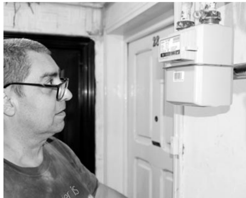
Január elsejétől jelentősen nő a kisfogyasztók gázszámlája

Úgy gondolom, Románia gazdasági kihívásai 2025-ben tovább mélyítik az állampolgárok mindennapi terheit. Miközben a minimálbér és a nyugdíjak „emelése” fontos lépés, a növekvő energiaárak és az infláció gyorsan felemészthetik az ezekből származó többletjövedelmet. Az energiaszegénység széles rétegeket érint, különösen a kisnyugdíjasok és hátrányos helyzetű családok körében. Az intézkedések és támogatások ellenére a rendszer nem képes átfogó megoldást nyújtani a méltányos életkörülmények biztosítására. A gazdaságpolitikai döntések jövőbeli fenntarthatósága elengedhetetlen ahhoz, hogy az emelések ne csak számokban, hanem a lakosság életminőségében is érezhetőek legyenek.