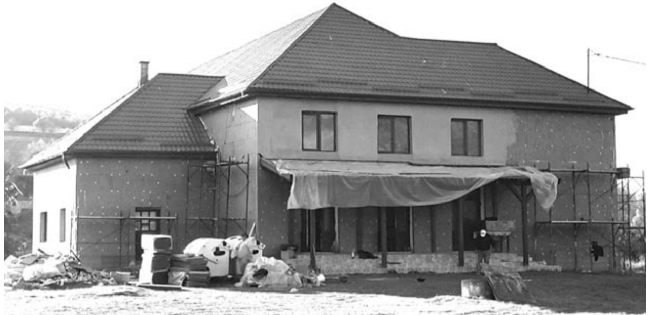
A tetőzetet kivéve teljesen felújítják a szentháromsági kultúrotthon is

A szentháromsági kultúrotthon tetőzetét két éve felújították, az épületen viszont teljes belső-külső munka folyik, hőszigetelik, kicserélik a nyílászárókat és a fűtésrendszert. Itt is lesz egy töltőállomás, ami ugyancsak a környezetvédelmi alap támogatásával valósul meg. A szentháromsági épületkorszerűsítés 2,5 millió lejbe kerül. (GRL)