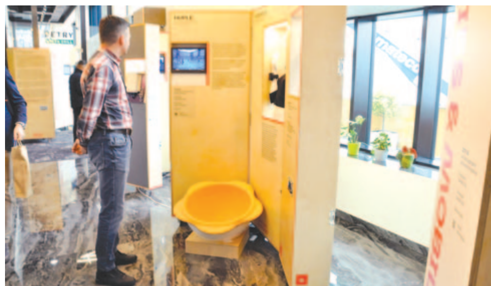
A Smart Hungary 2.0 kiállítás

A rendezvényt az IncubCenter előcsarnokában a Smart Hungary 2.0 – Magyarországon bejegyzett legújabb technológiai innovációkat bemutató – kiállítás megnyitója zárta, amely a Külgazdasági és Külügyminisztérium utazó tárlataként Európát és Európán kívüli országokat bejárva mutatja be a legújabb csúcstechnológias magyarországi innovációkat, amelyek az intelligens otthonokban, épületekben és városokban alkalmazhatók, valamint a mobilitás, az egészségügy, az orvostudomány és sport, illetve a mezőgazdaság és ipar területén használhatók.