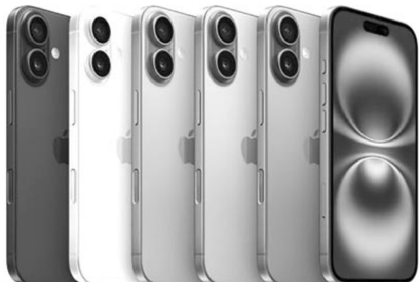
iPhone 16, illusztráció

A furcsa szabályozás ellenére is tudnak az Indonéziában élők új iPhone-t vásárolni, és nem a feketén behozott termékekre kell gondolni! Ugyanis bárki rendelhet magának külföldről iPhone 16-ot, amit kiszállítanak neki, mindössze vámot kell utána fizessen.