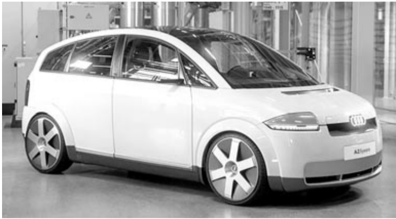
Audi A2 e-tron

Negyed évszázaddal ezelőtt az Audi A2 egyfajta erődemónstráció volt, a gyártó ezzel akarta megmutatni, hogy hogyan képzei el a szuperhatékony kisautók korszakát. El kell ismerni, hogy ez sikerült is neki. A hatékonyságban hatalmas szerep jutott a súlynak is, ezért is épült az A2-es az Audi Space Frame-re, vagyis alumínium térvázra, amire egyebek mellett a korabeli A8 is. Ennek tudatában kijelenthető, hogy a 2000-es évek elején a legnagyobb és a legkisebb Audi is ugyanazon a