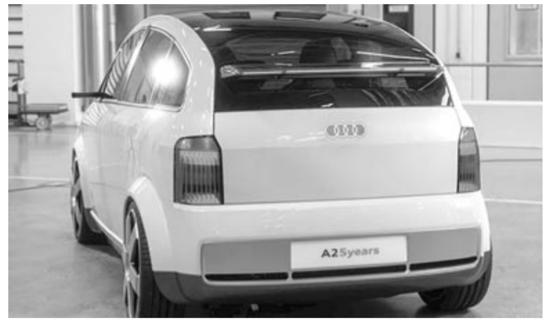
Audi A2 e-tron hátulról

Sokan kritizálták 25 évvel ezelőtt az A2-es formáját is, viszont tudni kell, hogy nem véletlenül lett ilyen, a típus formáját egy szélsőatorna alakította ki. A modell stílusa lehetővé tett egy – akkoriban – kimondottan alacsonynak számító légellenállási tényezőt, változattól füg-