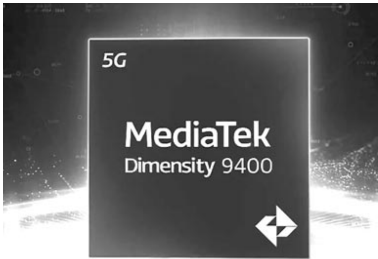
MediaTek Dimensity 9400

A fülhallgatók egyenként 6,6 grammot nyomnak, és egy pár ára 170 dollár. A gyártó ByteDance kapcsán azt érdemes tudni, hogy az elmúlt években egyre nagyobb figyelmet fordított a hardverek készítésére. A 2019-ben megvásárolt Smartisan nevű okostelefon-márkát például beolvasztották a vállalat oktatástechnológiával foglalkozó részlegébe, ennek eredményeképpen 2020-ban piacra dobtak egy okoslámpát, amely segítségével a gyermekek felhívhatják a szüleiket. Továbbá a ByteDance 2021-ben felvásárolt egy virtuális valósággal (VR) foglalkozó céget, a kínai Picót, amelynek a legújabb VR-szemüvege, a Pico 4 Ultra nem is olyan régen Európában is bemutatkozott. Ennek fényében pedig egyáltalán nem lehet kizárni, hogy egy pár éven belül számos ByteDance-eszköz elérhető lesz Európában is.