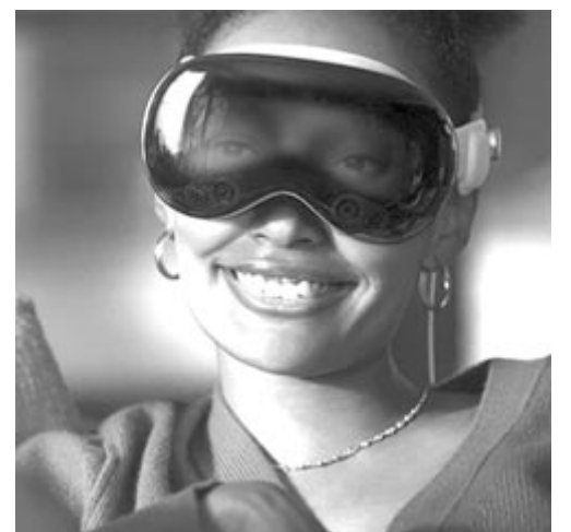
Apple Vision Pro EyeSight funkció, ez a tervek szerint nem lesz benne a jövőben érkező olcsó kivitelben

második generációra – Mark Gurman szerint – 2026-ig kell várni. 2027-ben érkezik egy olyan okos szemüveg, mint amit a Meta és a Ray-Ban közösen adott ki a közelmúltban, ami egy hagyományos szemüveg látszatát kelti, de két kamera is bele van építve, illetve audiorendszer is helyet kapott benne, továbbá élő Facebook- vagy Instagram-bejelentkezést is el lehet róla indítani. Ez várható tehát az Apple-től is 2027-ben, illetve egy kamerával is ellátott AirPods. Mondjuk azt is hozzá kell tenni, hogy 2027-ig még sok van, addig változhatnak a trendek, illetve rájöhet arra az ipar, hogy egy fülhallgatóra kamerát tenni finoman szólva is érdekes, vagy éppen ellenkezőleg: a felhasználók is rájöhetnek, hogy ez milyen egy hasznos dolog!