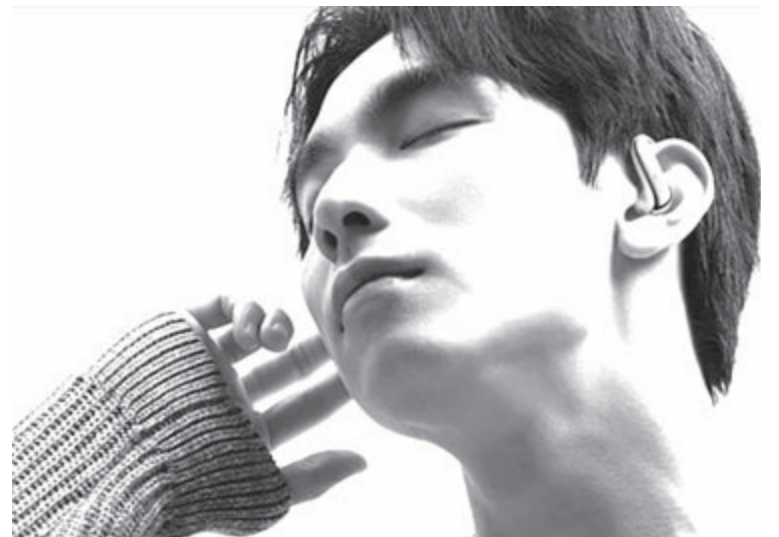
ByteDance Ola Friend fülhallgató