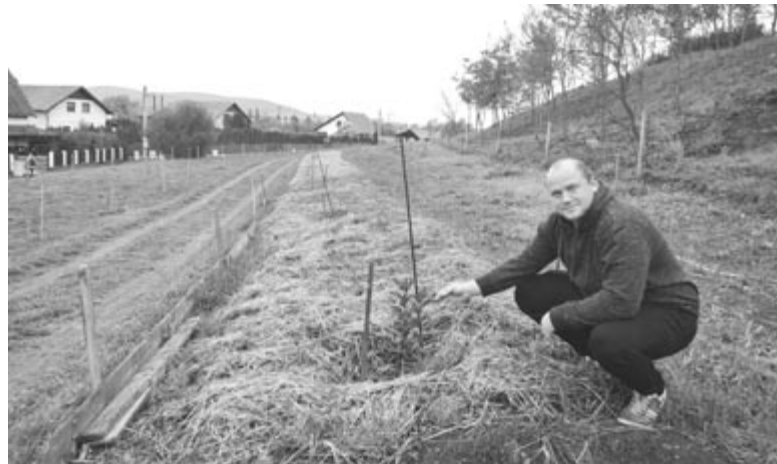
Vannak elképzelések a jövőre, de egyelőre az a cél, hogy termőre forduljon majd a kert – mondja a kezdeményező

Nem tud arról, hogy megyékben volna más hasonló kezdeményezés, az utólag létesített erdőszentgyörgyi kertet leszámítva. Ha lett volna már hasonló, szeretett volna kapcsolatot létesíteni itteni Tündérekertekkel, de úgy gondolja, hogy végül is nem a Tündérekertek, hanem a Tündérekert és a közösség között kell kapcsolat kialakuljon. Vannak helyek, ahol egy-egy csoport, iskolai osztály vagy egy család fogad örökbe fákat, és azokat gondozza időnként, s vannak Tündérekertek, ahol az örökbe fogadók számára szerveznek találkozásokat. Ő is szeretne hasonlókat, hiszen a Tündérekertnek a „hasznát” igazából a közösségépítésben látja – taglalta a fiatalember.