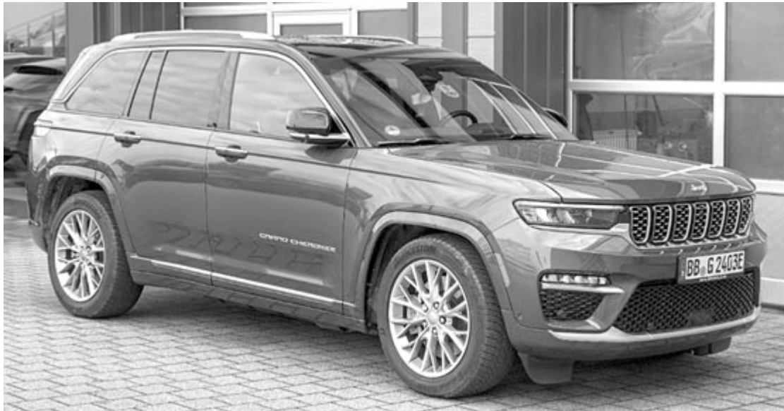
Jeep Grand Cherokee

A Stellantis arra kéri a tulajdonosokat, hogy az ellenőrzésig, valamint a hiba kijavításáig ne töltsék autójuk hibrid akkumulátorát, illetve ne parkoljanak más autók vagy épületek közelében. Míg az előbbi kérés relatív könnyen teljesíthető, hiszen az emberek többsége nem azért vesz óriási plug-in hibrid te-repjárót, hogy környezetbarát legyen, hanem mert így esetleg részesülhet valamilyen támogatásban, utóbbi már sokkal nehezebben, hiszen ha a tulajdonosok úgy is döntenek, hogy az utcán parkolnak, nem tudják kizárni annak a lehetőségét, hogy más autó melléjük álljon, illetve a legtöbben a bevásárlást is az autójukkal végzik, azaz az üzlet parkolójában kénytelenek más autók mellett megállni. A probléma minden bizonnyal kihatással lesz a típusok megítélésére, vagyis azon autókban is kevesebbet fog eladni a Stellantis, amelyeknek eddig komoly célközönsége volt.