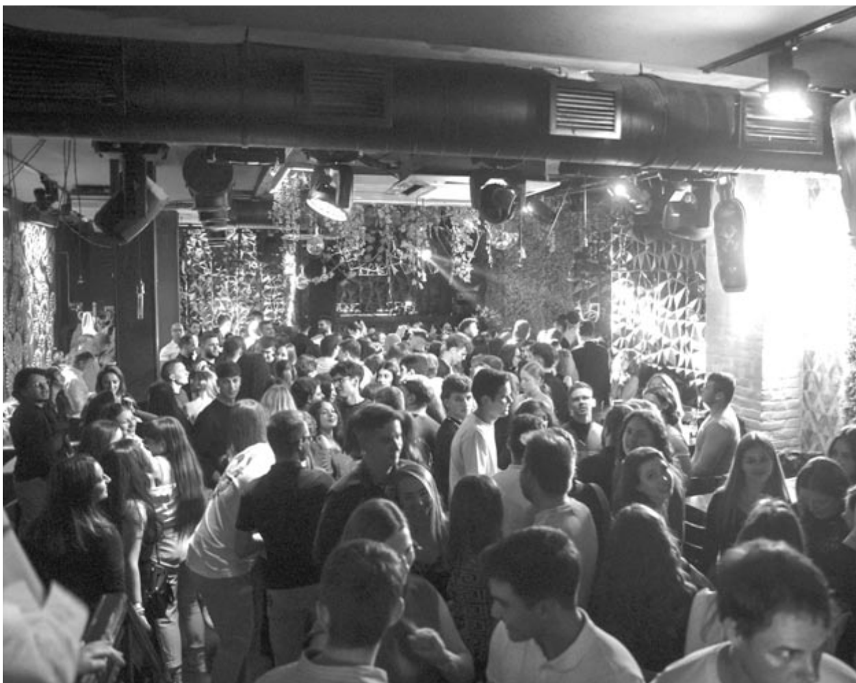
Telt ház az idei Friss Hús Néző egyik helyszínén

A jó hangulat, a több száz résztvevő is az érdeklődést mutatja: sikeres volt az idei rendezvény is. Azonban talán nem túlzás azt állítani, hogy még nagyobbra szólt volna, ha lenne Marosvásárhelyen egy olyan hely, ami egyrészt megfizethető a diákok számára is, másrészt be tud fogadni több mint 1000 embert. Érdeklődés lenne iránta, és egészen biztosan ahhoz is hozzájárulna egy ilyen létesítmény, hogy több fiatal gondolkodjon el azon, hogy Marosvásárhelyt válassza. Hiszen a diákléthez, az egyetemi évekhez hozzátartoznak a bulizások is.