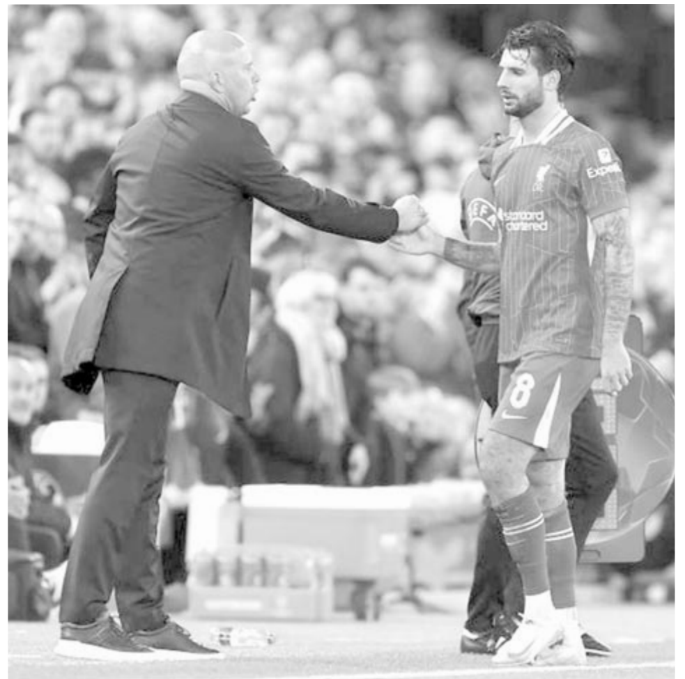
Szoboszlai Dominiknak, a Liverpool lecserélt játékosának megköszöni a játékát Arne Slot vezetőedző a labdarúgó Bajnokok Ligája alapszakaszának második fordulójában játszott Liverpool – Bologna mérkőzésen a liverpooli Anfield Road-i stadionban 2024. október 2-án

Teremlabdarúgó 1. liga, 6. forduló, eredmények: Temesvári CFR 1933 – Sepsiszentgyörgyi Seps SIC 3-3; 7. forduló: Bodzavásári Lucaefarul – FK Székelyudvarhely 1-11, Sepsiszentgyörgyi Seps SIC – Dévai West 1-1, Mausoleul Mărășești – Temesvári CFR 1933 1-8.