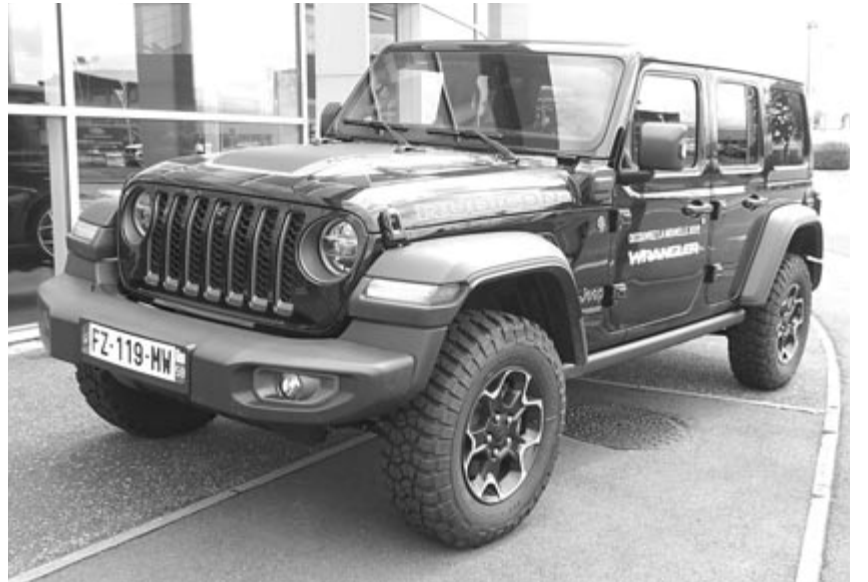
Jeep Wrangler 4xe