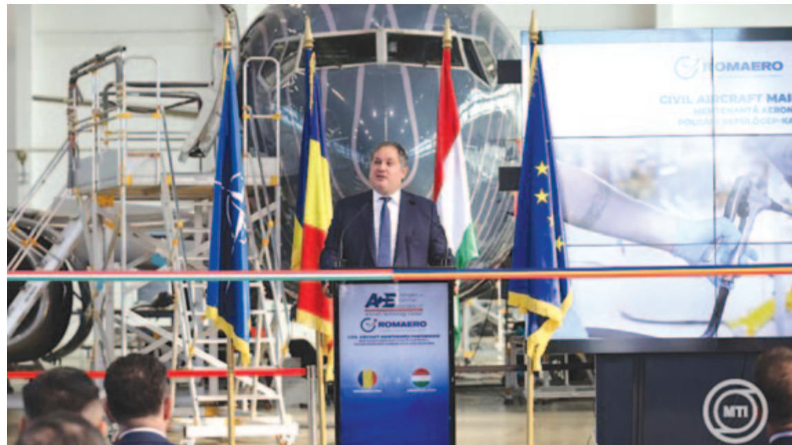
Nagy Márton nemzetgazdasági miniszter beszédet mond az Aeroplex Közép-európai Kft. bukaresti repülőgép-karbantartó bázisának avatásán.

Az Aeroplex első bukaresti kliense a litván KlasJet chartertársaság, amely négy repülőgép karbantartására kötött szerződést, az elsőnek, amelyen október elsején kezdtek dolgozni, már be is fejeződött az átvizsgálása. (MTI)