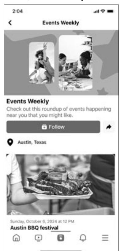
Facebook-események frissítve

De nem ez az egyetlen újdonság, a TechCrunch szúrta ki, hogy a közösségi médiás oldal egy „Felfedezés” (Explore) fület is be fog vezetni, ahol a személyre szabott