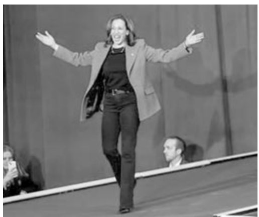
Kamala Harris amerikai alelnök, a Demokrata Párt elnökjelöltje kampánygyűlést tart a Georgia állambeli Atlantában.

A volt elnök interjút is adott egy vasárnapi televízióműsornak, amiben vezető kaliforniai demokrata politikusokat, így Adam Schiff képviselőt és Nancy Pelosi korábbi házelnököt „belső ellenségnek” nevezett. Nancy Pelosival kapcsolatban megismételte azt az állítást, hogy a 2021. január 6-i zavargások idején nem hagyta jóvá elnöki kezdeményezését, amivel a Nemzeti Gárda 10 ezer tagját vezényelték volna a Capitolium, a törvényhozás épülete védelmére.