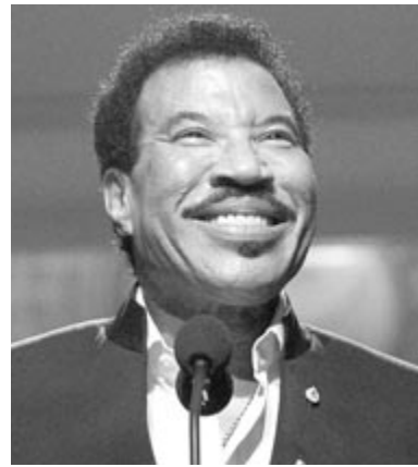
Lionel Richie 2022-ben.

Az énekes 1949. június 20-án született Lionel Brockman Richie Junior néven. Alabama államban, egy Tuskegee nevű kisvárosban nőtt fel; egyetemi tanulmányai után mérnökként, majd lelkészként tevékenykedett, utóbbinak köszönhetően ismerkedett meg a soul és a gospel izgalmas zenei világával. 1967-ben barátaival megalapította az akkor még Mystics névre hallgató, később Commodores névre átnevezett csapatot.