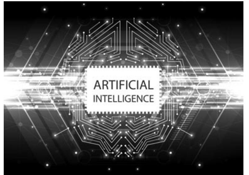
Mesterséges intelligencia, illusztráció

Egy vállalaton belül a mesterséges intelligencia sikere nagyon múlik azon is, hogy a vezetőség mennyire nyitott a technológiai korszakváltásra, illetve meg tudják-e fogalmazni, milyen stratégia mentén valósítanak meg digitális fejlesztéseket. Utóbbira támpontot adhat egy problématerkép készítése, amely világosan megmutatja, hogy milyen kihívásoknak kell megfelelnie a cégnek a jelenlegi piaci környezetben, vagy akár öt éven belül. A problématerkép függ-