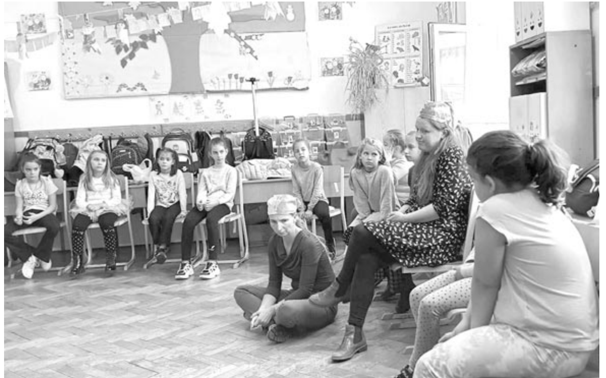
Érdekes szerepjátékok, interaktív tevékenységek révén boncolgatnak egy-egy kérdést, figyelik a gyerekek reakcióját

voltak, ezért úgy gondolták, jó lenne folytatni. Azért kapcsolódott be a projektbe, mert úgy érzi, szociális munkásként és szülőként egy másfajta tapasztalatot tud hozzátenni a fiatal szakember tudásához. Azt szeretné, hogy a gyerekek újat is tapasztaljanak. A különböző osztályokban különböző szinten jönnek ki az eredmények; megbeszélik a gyerekekkel a történeteket, a kérdéseket és az eredményeket, hogy ők fogalmazzanak meg megoldásokat – mondta el a Népszágnak a helyi foglalkozásvezető.