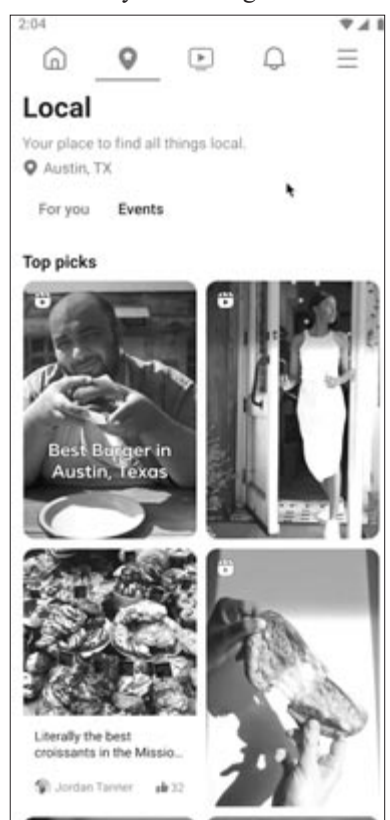
Facebook, Helyi (Local) funkció

azonban a funkció először csak néhány amerikai városban lesz elérhető, viszont ígérik, hogy a jövőben Európában is meg fog jelenni a Helyi fül, ami által a normál hírfolyamban is nagyobb figyelmet kapnak a helyi közösségek számára