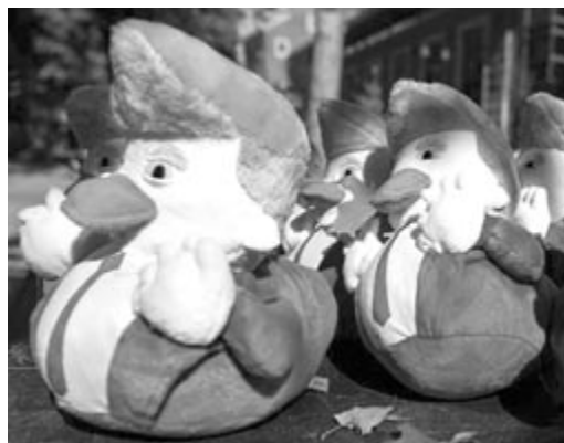
Donald Trumpot népszerűsítő plüssfigurák egy választási kampányrendezvény helyszínén.

Donald Trump szombaton a Pennsylvania állambeli Latrobe városában, Pittsburgh közelében tartott választási gyűlésén adócsökkentéseket ígért, és azt hangoztatta, hogy véleménye szerint az elnökválasztás legkomolyabb téje az illegális bevándorlás megállítása, mert az „az ország kulturális szövetét” rombolja le.