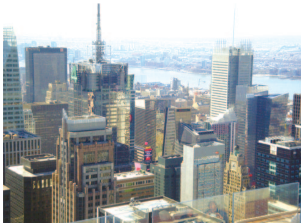
New York felhőkarcolói

Szabadságvágyó amerikaiak és magyarok egy csoportja emelte a szabadság bajnoka, Kossuth Lajos szobrát New Yorkban. Egy szoboregységről van szó Észak-Manhattan-