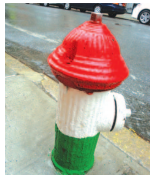
Tűzcsap a 82-es utcában

Manhattan egyszerre hagyományos és rendhagyó, számos sajátosságot és egyúttal különlegességet tartogat. Már az is különleges, hogy a soktucatnyi emelet árnyékában megpihen egy száz-kétszáz éves anglikán templom (védett építészeti érték), vagy egy négy-öt-hat emeletes elegáns vendéglátóipari egység, netán lakóház. Vagy például az, hogy a Rockefeller Center előtt kétszerez ember-nagyságú patkányszobor terpeszkedik. Vagy talán csak jópofa egerke lenne? A Rockefeller tér 30. szám külön turisztikai gyűjtőpont, előtte szórakozási alkalmatosságokkal, innen van a bejárat a The Rock épületébe. A tetőről lenyűgöző a lelátás a környező épületekre, a sárga taxikra és a kigyózó embersorokra.