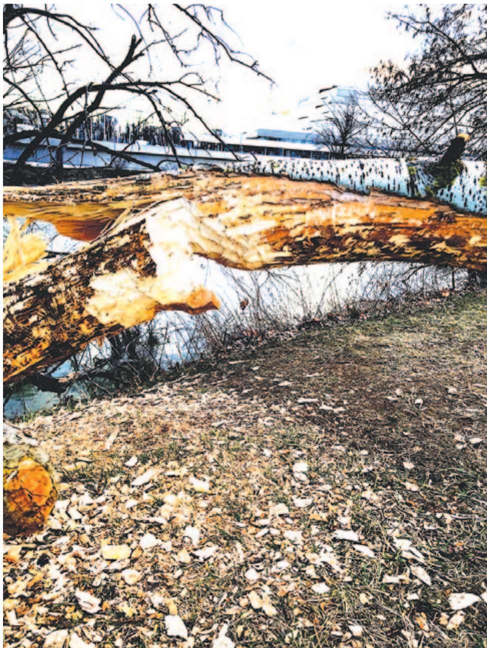
2024 márciusa – hódrágtá döntött nyárfá, a háttérben a Duna Aréna úszócsarnok

Maradok kiváló tisztelettel. Kelt 2024-ben, magvető havának 11. napján