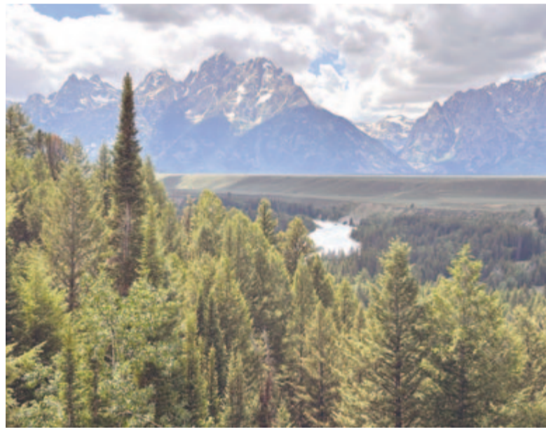
A Grand Teton hegyvonulata a Snake folyó mentén

kalderából, megváltozott a táj. Vándorló bölénycsordát a továbbiakban is láttunk, ám az addigi dombok hegyóriásokká növekedtek. A Snake folyó mentén tavak láncolatát követtük, víztükron ringó hegyormokban gyönyörködtünk.