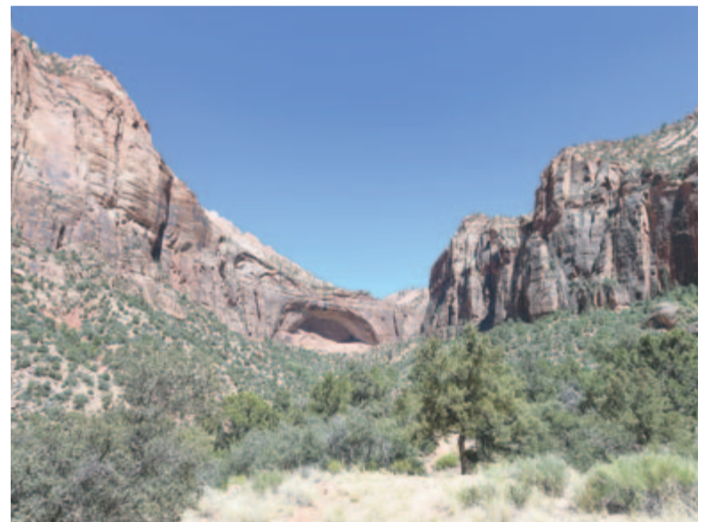
Sziklaiv a Zion kanyonban

A parkban sokféle embert láttunk kirándulni. Volt, akinek a pólójára ez volt írva: „In Dog we trust”, ami azt jelenti, hogy a kutyában bízunk. Ez egy szójáték, mert az eredeti mondat, ami egyébként a kezdetektől fogva napjainkig egy alapvető amerikai értéket emel ki, és ami az amerikai bankjegyeken is olvasható, a himnuszukban is hallható, így hangzik: „In God we trust”, vagyis Istenben bízunk. Láttam azonban olyan pólot is, amelyre ez volt felírva: Jézus a király. „Azért, ha a Fiú megszabadít titeket, valószínűleg szabadok lesztek. János 8,36.” És láttunk amishokat, mormonokat és még ki tudja hányféle felekezethez vagy világvalláshoz tartozót. Isten tagadása, mi több, csúfolása ugyanúgy belefér az amerikai olvasztótégelybe, mint a vallá-