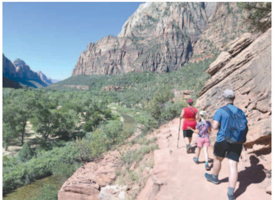
Túrázás a Zion Nemzeti Parkban

S bár a mormonok hazájában voltunk, egy másik, jellegzetesen amerikai keresztény közösségről is szólnom kell. Az amishok, radikális reformációs gyökereikből adódóan, leginkább jellegzetes kinézetükkel, egyszerű életmódjukkal és a modern technológiák kényelmeinek elutasítóiaként elevenednek meg előttünk, ám azt kevesen tudják, hogy az utazás egyre inkább terjed a progresszívebb családok körében, előszeretettel látogatnak többek között történelmi helyszíneket vagy