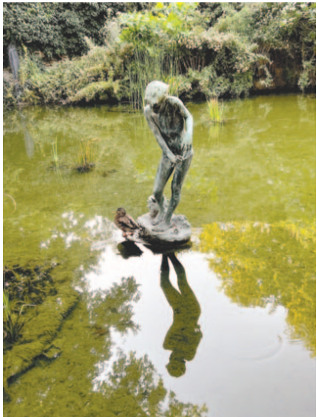
Ligeti Miklós margitszigeti Rákász fiú szobrának talapzatán tocsog egy vadliba, indulni készül

Emlékezzünk meg Haynald Lajos érsek botanikus születéséről: 1816-ban, október 3-án született. 36 évesen már Erdély püspöke volt. A kiváló tanár és szervező a természettudományoknak is nagyvonalú támogatója volt. Erdélyi püspöksége alatt létesítette a csíksomlyói székely gimnáziumot és a tanítóképzőt, a gyulafehérvári nőnevelő