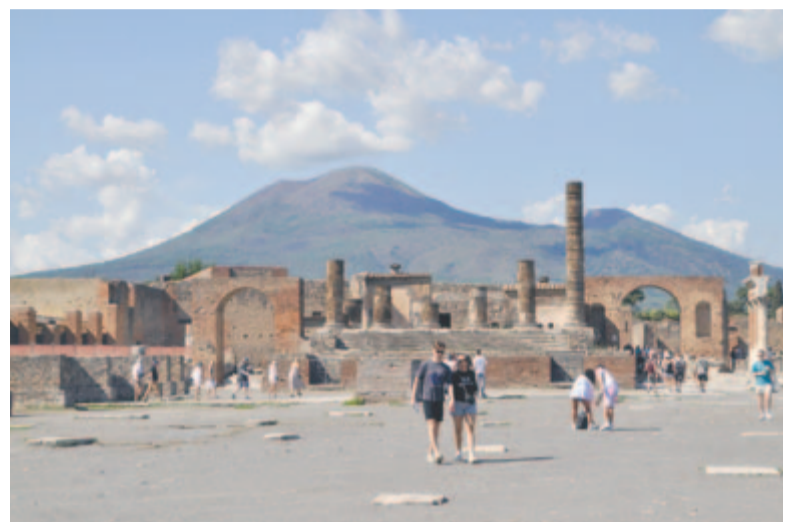
A Fórum, háttérben a Vezúv

Az ókori római kultúra zsenialitásának példái a fürdők (therme), amelyekből több is van Pompejiben, minden akkori kényelemmel, ruhatároló fülkékkel, hideg és meleg vizes medencékkel, masszírozóteremmel, padló- és falfűtéssel, gyönyörűen díszített termekkel. Itt is szép számban találhatók tavernek, konyhák olajpréssel, kemencével és minden olyan akkori eszközzel, ami a mai embert is kiszolgálja modern változatában. A közművesítés néhány eleme is figyelemre méltó, az utcák, a lefolyók, a csatornák, a vécék – minden volt, ami kiszolgál egy jól működő