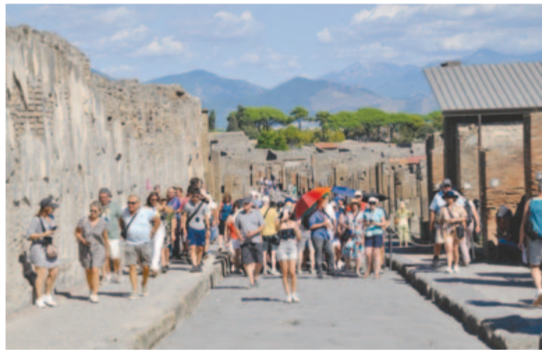
Turisták az ókori város utcáján

A főbejárat a Porta Marinán, a tengeri kapun keresztül, egy hosszú