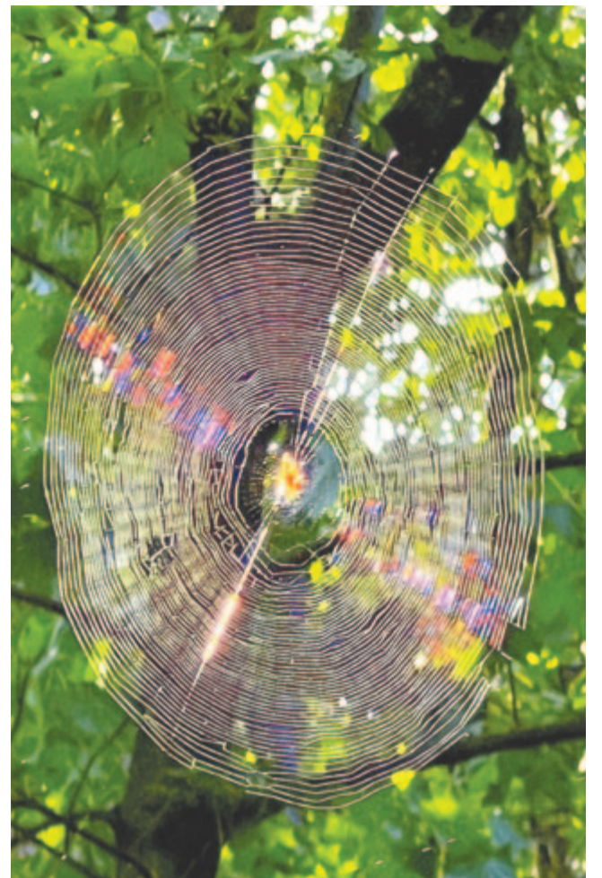
Egy pók gyémántos őszi fátolrongya

Halálának évében, 1938-ban jelent meg Dsida Jenő Angyalok citeráján című kötete. Benne az öt fejezetből álló lírai riportja, a Kóborló délután kedves kutyámmal . Dicshimnusz ez kutyájáról, a kutyáról. Első éneke, az Utak eredünk és szeretjük egymást így folytatódik: