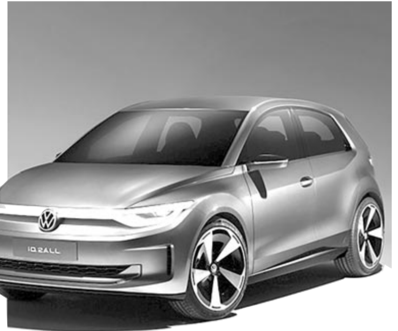
Volkswagen ID 2all, koncepció, illusztráció