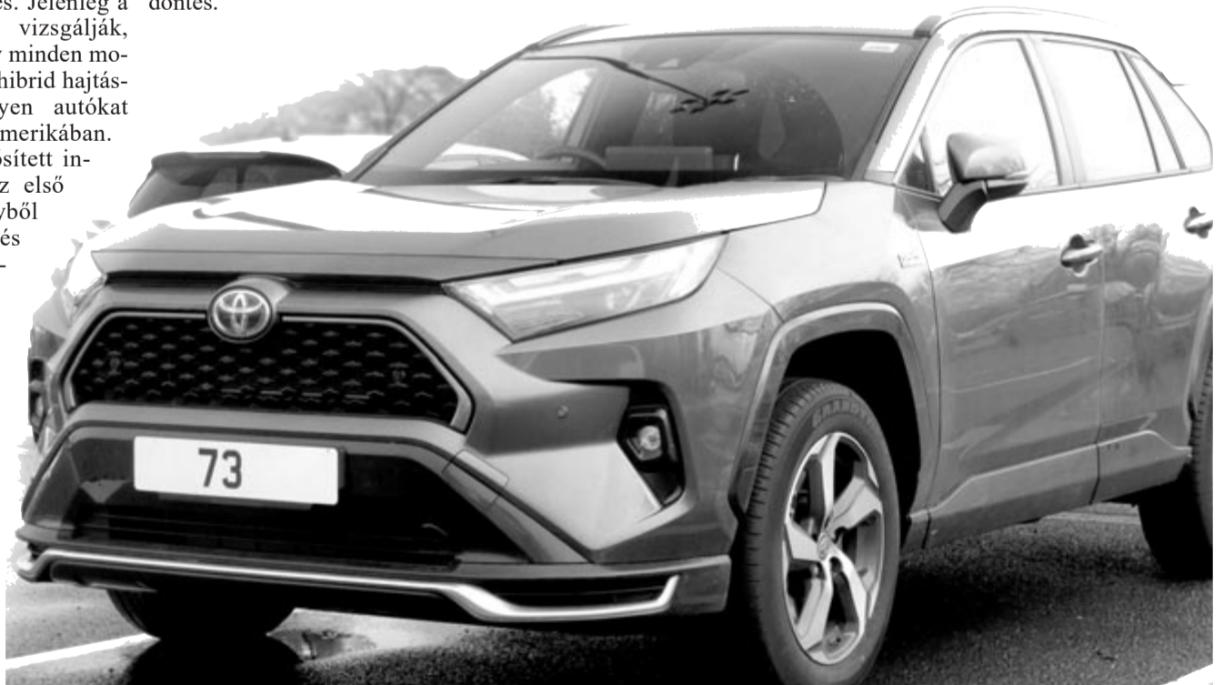
Toyota Rav4, illusztráció

kiértékelik, hogy lenne-e értelme a teljes hibridizálásnak. Azt nem tudni, hogy mikor szülehet meg a döntés.