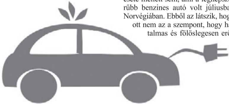
Elektromos autó, illusztráció

ányzik, ugyanis volt egy hidrogénüzemű jármű is közöttük. Nem lehet elmenni a Suzuki Swift esete mellett sem, ami a legnépszerűbb benzines autó volt júliusban Norvégiában. Ebből az látszik, hogy ott nem az a szempont, hogy hatalmas és fölöslegesen erős