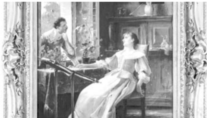
Randevú az ablaknál. Részlet.

„Munkácsy Mihály neve a földkerekség minden táján ismert, az aukción kínált olajképe pedig az életmű egyik tipikus és igen látványos, szép darabja. Ritka kincs ez a festmény,