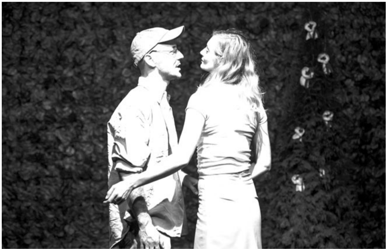
Metaxa – próbafelvétel

82 évvel ezelőtt, 1942. szeptember 19-én született a tragikus sorsú marosvásárhelyi költő (elhunyt 1973. augusztus 20-án).