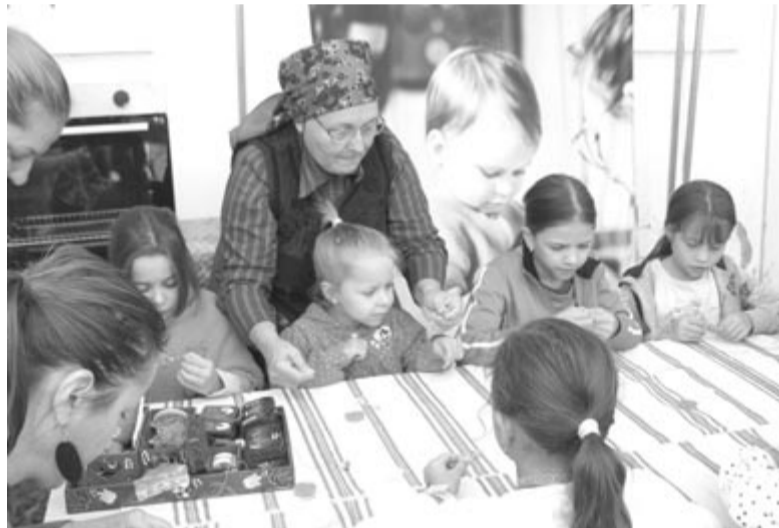
Nemzedékeken átívelő hagyományörzés

– A játék művészi alkotás. A gyermekjáték az emberi lélek mélységéből fakad. (...) A játszásban minden nép múltja benne van, ha töredékesen is. Gyermekjeink játékai még ma is tükrözik a magyar nép foglalatosságainak tárgyait, s olykor összetalálkozhatunk hiedelemvilágunk emlékeivel, sőt nyelvünk ősi maradványaival is.