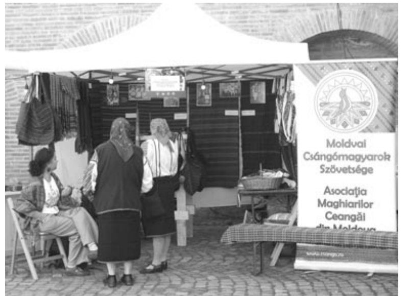
Ahol a hagyományörzés küzdelem a megmaradásért