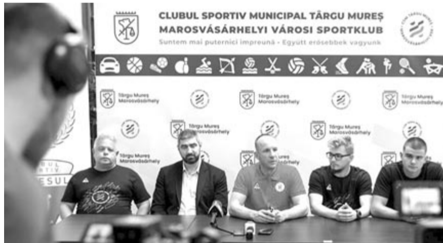
A városi sportklub múlt heti sajtótájékoztatóján tettek bejelentést

Az együttműködést bejelentő sajtótájékoztatón kész tényként közölték, hogy a következő idénytől a Szuperligában indulnának.