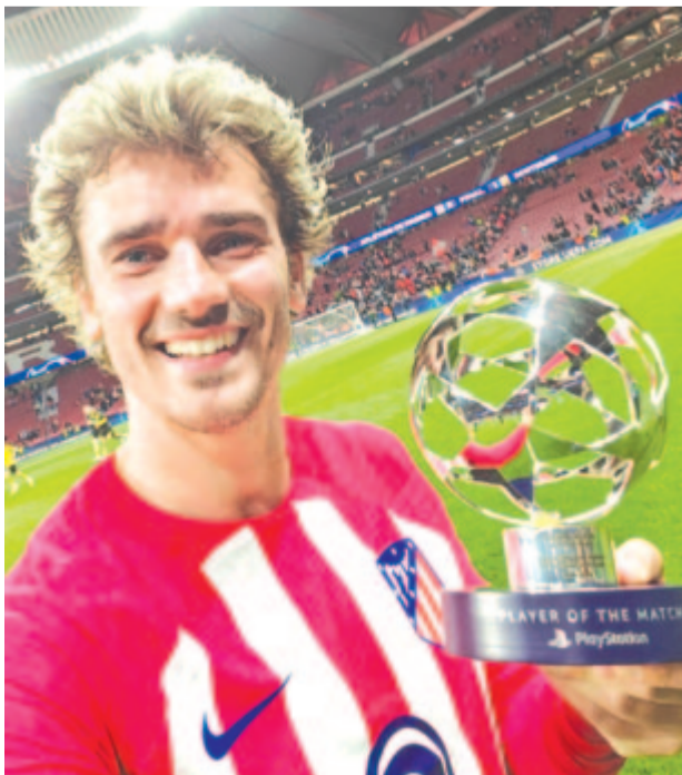
Antoine Griezmann jó szereplése nyomán megkapta az Atlético Madrid – RB Lipcse (2-1) mérkőzés legjobb játékosának járó díjat.

* 4. liga, 2. csoport, 2. forduló: Marosoroszfalvi Mureșul – Magyaróvi Viitorul 7-2, ACS Nyárádszereda – Mezőrécsai Cămpia 0-2, ASA Marosvásárhely – ACS Maroszentkirály-Náznánfalva 4-1, CSO Erdőszentgyörgy – ACS Szováta 0-1.