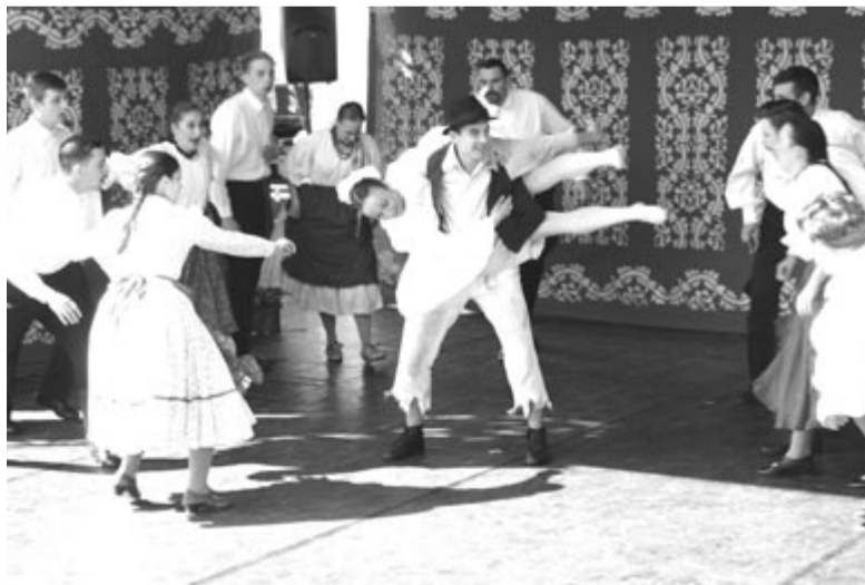
Lúdas Matyi – a sepsiszentgyörgyi Háromszék Táncegyüttes előadásában