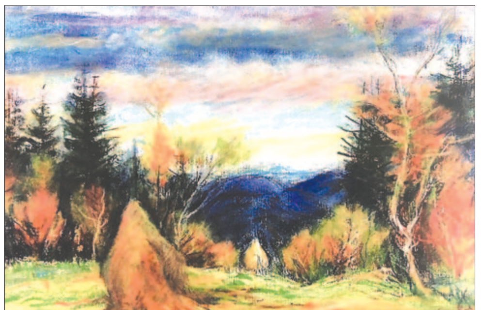
Trella Várhelyi Imola: Erdő szélén

2024. augusztus 29-én hunyt el szerettei körében. Legyen békés a pihenése.