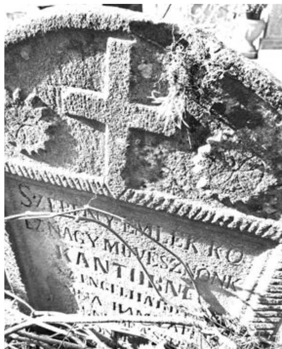
Kántorné régi síremléke a marosvásárhelyi katolikus temetőben

*Markó Béla Kovács András Ferencnek dedikált Költőhalál című verséből