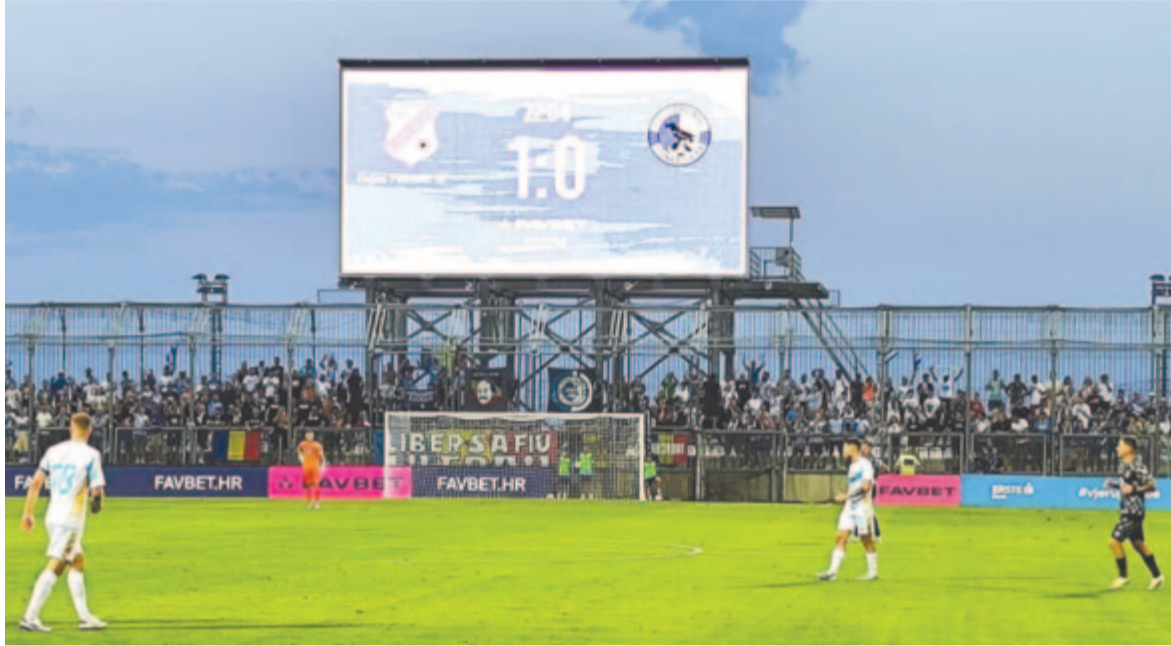
Egygólos vereséget szenvedett a Corvinul