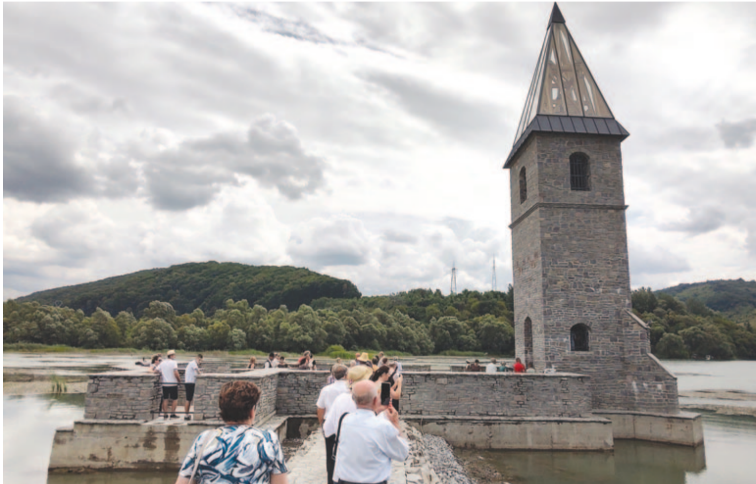
Jelképes templom – Bözödújfalú jelképes feltámadása