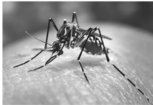
A betegség legfőbb hordozója és terjesztője az egyiptomi csípőszúnyog (Aedes aegypti)