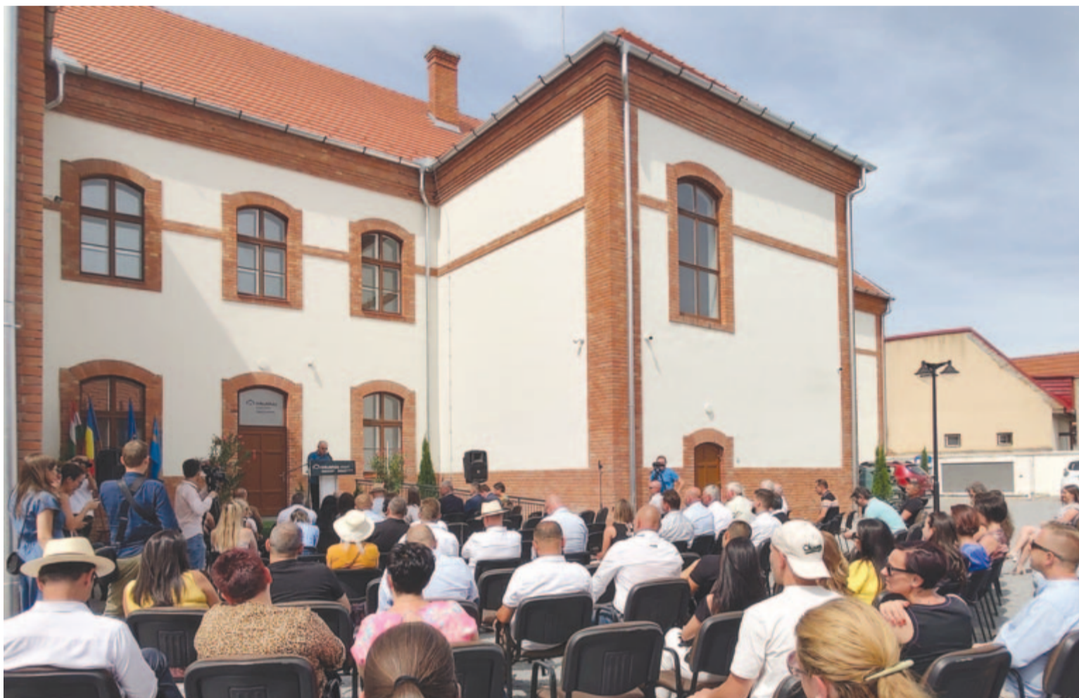
Sokan voltak kíváncsiak az új intézmény megnyitására