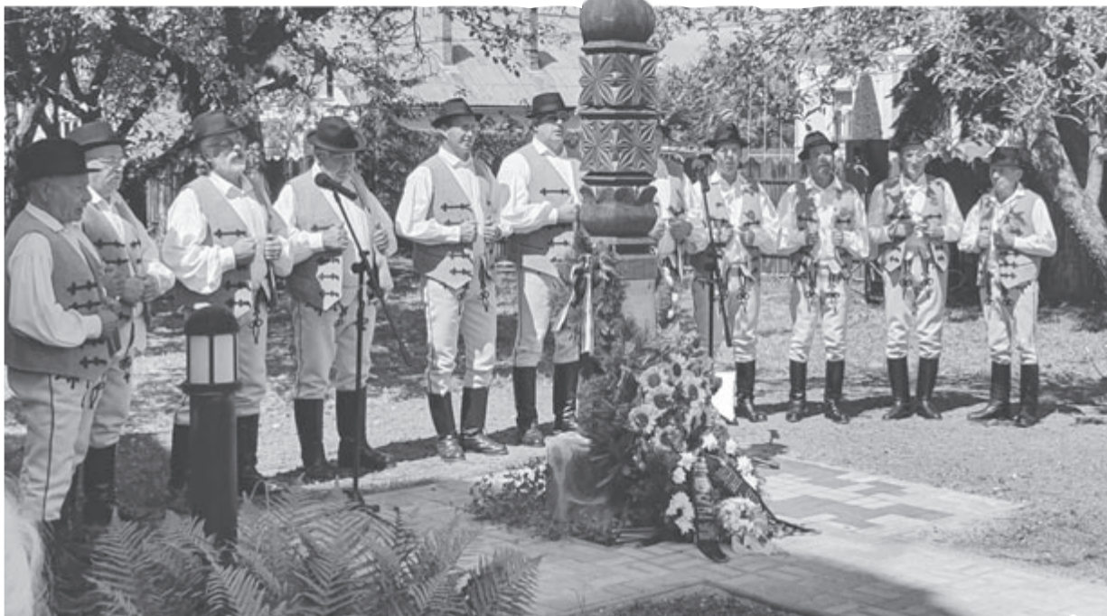
A kopjafa az avatóünnepségen, mögötte a Ditrói Férfi Dalkör