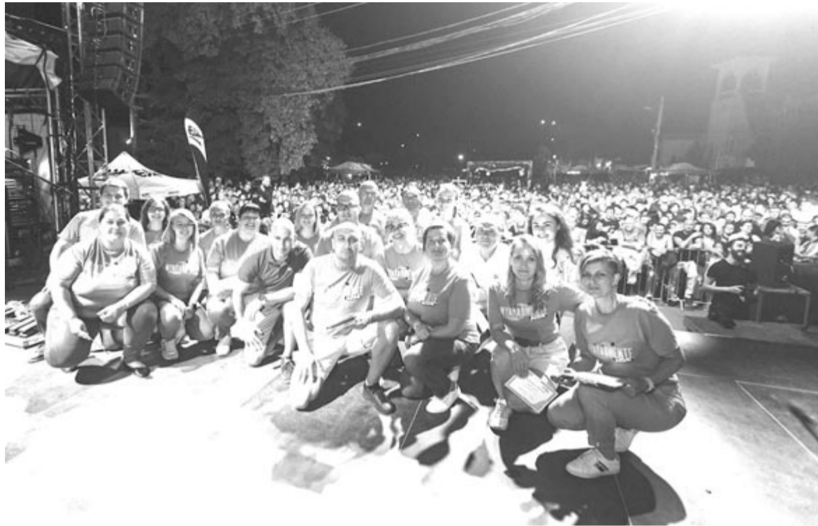
Legalább hatezren a koncerten – összességében mindennel elégedettek a szervezők