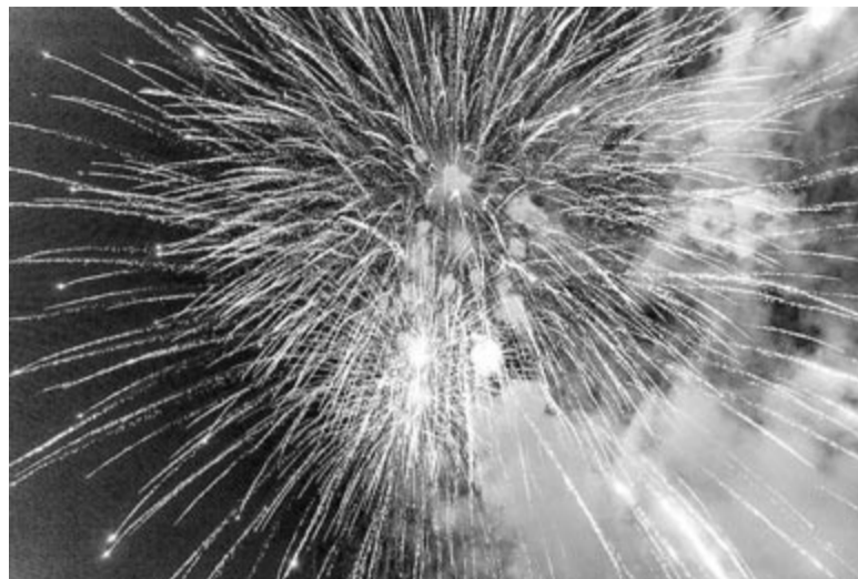
Parádés volt a záró tűzijáték, de nem csak erre büszkék a szervezők