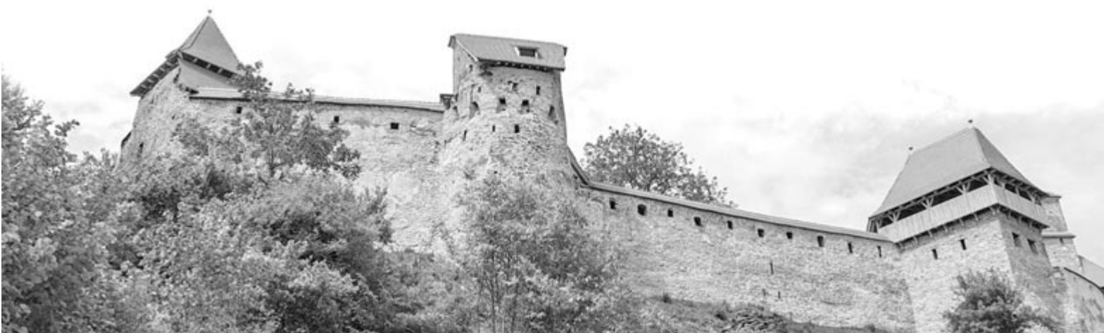
A szászkezdői parasztvár

A rendezvényt sorozat augusztus 8-án, csütörtökön 11 órakor kezdődik az erkeidi erődtemplom előtti sétányon, ahol a hivatalos megnyitót követően szász fúvószenekarok, néptáncosok lépnek fel, a segesvári Teutsch gimnázium diákjai német nyelven előadják Jean de La Fontaine A róka és a holló című meséjét, a templomban a Carmina Renascentia együttes XVI. és XVII. századi szász és sváb régizenét ad elő. A településen idegenvezető kalauzolásával látogathatók meg a szász erődtemplomok, egyéb látnivalók. A Haferland hét fővédnökei Fülöp liechtensteini herceg és a román királyi család.