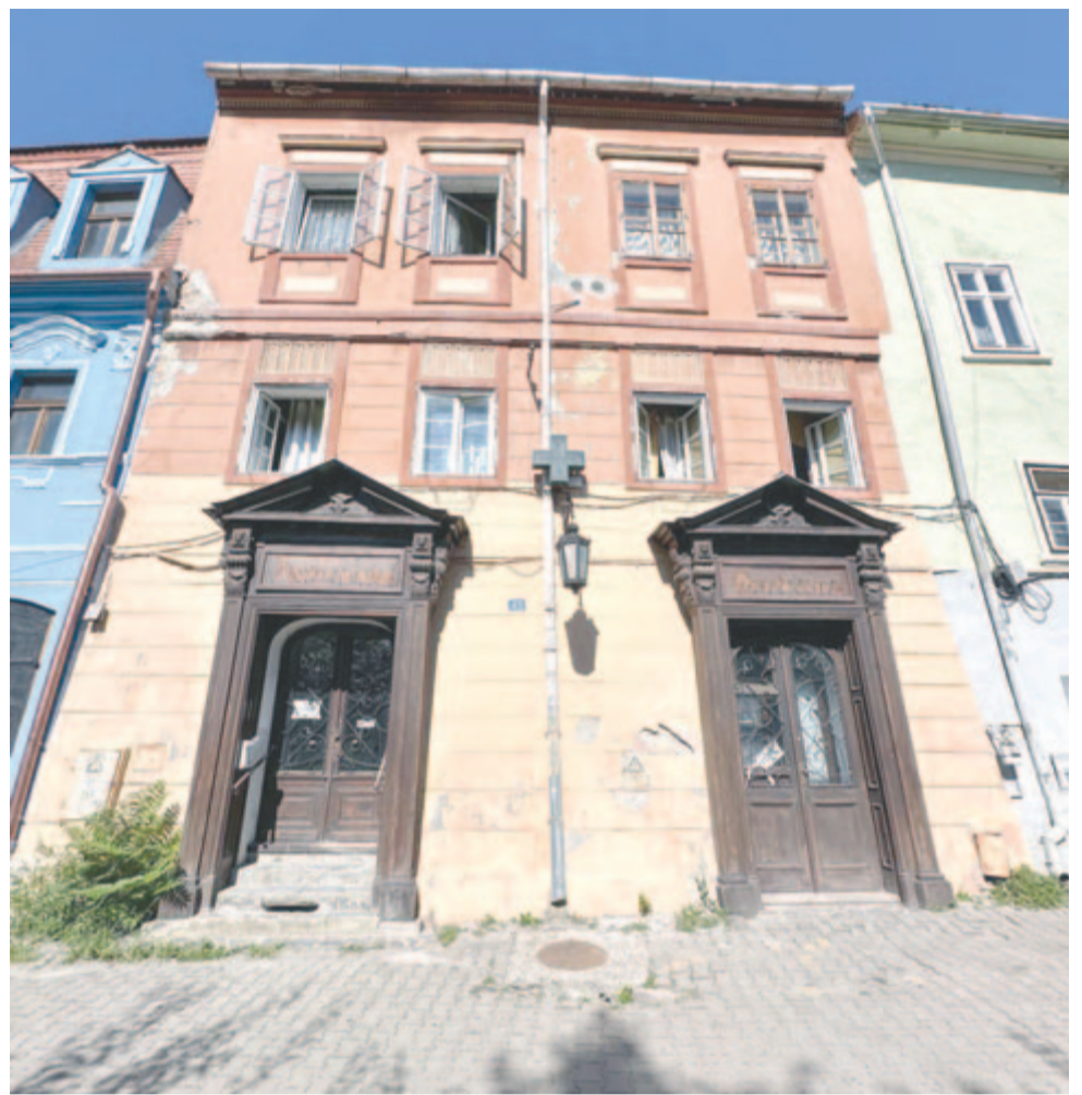
Az Oroszlán patika, 1720-tól

Az ókor lepárlással (desztillációval) kap-