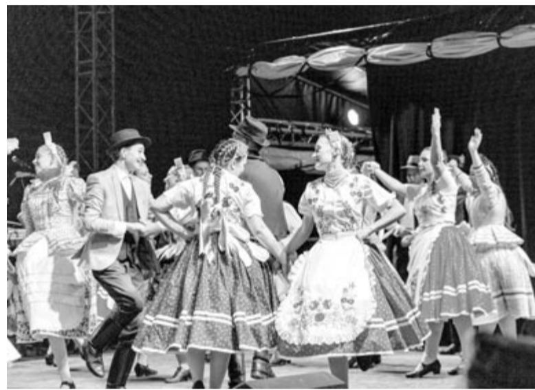
Két hét kikapcsolódás, forgatag, szórakozás – ezzel válik lassan a rendezvény