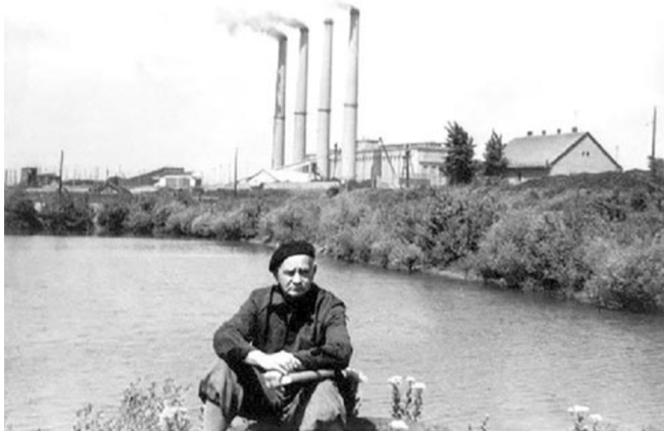
Hamvas Béla Inotán az ezredvég karikatúrája, az újkor torzképe (Szepesi Attila)

Életében szinte ismeretlen, elhallgatott, így hát hallgató író volt a posztumusz Kossuth-díjjal (1990-ben) kitüntetett Hamvas Béla (Éperjes, 1897. márc. 23. – Budapest, 1968. nov. 7.). Édesapja felvidéki evangélikus lelkész, tanár, író és hírlapszerkesztő volt. Fia-