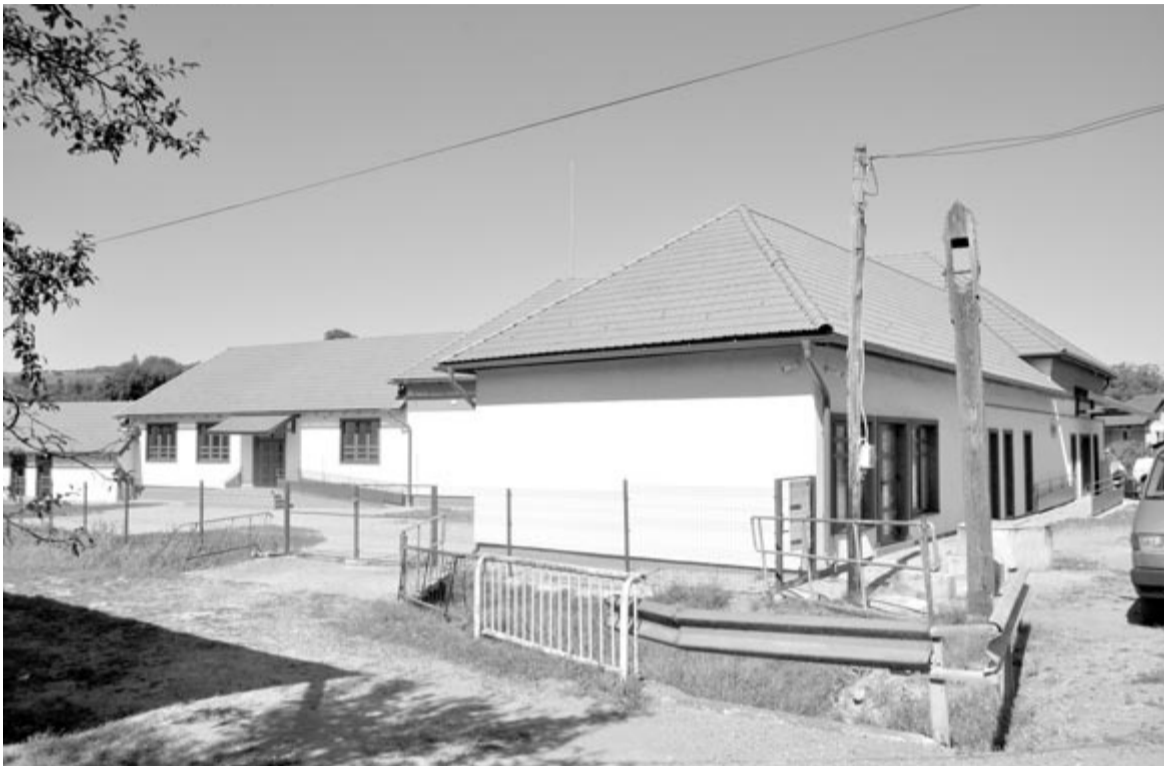
A jobbágytelki kultúrotthon

A szerződés szerint az önrész majdnem ugyanannyi, azaz mintegy 1,1 millió lej volt. A terv 2022. november elsejére elkészült. Időközben megdrágultak az építőanyagok, emiatt az önrész 2,2 millió lejre növekedett. A pályázat része volt egy elektromos töltőállomás kiépítése is a művelődési otthon előtt. November 5-én a villamossági vállalat szakértői a terepszemlén elmondták, hogy a megvalósításhoz háromfázisú vezeték szükséges. Ezzel nem lett volna gond, hiszen korábban már bevezették a háromfázisú áramot a kultúrotthonba. Igen ám, de kiderült, hogy ez mindössze csak 18 kWh-t szolgáltat, míg a tervben szereplő gépkocsigyorstöltőhöz 72 kWh kell. Ezt a műszaki követelményt csak úgy tudják megoldani, ha a polgármesteri hivatal önrészből 500.000 lejt biztosít, hogy a faluban levő transzformátorállomástól egy új vezeték húzzanak a művelődési házhoz.