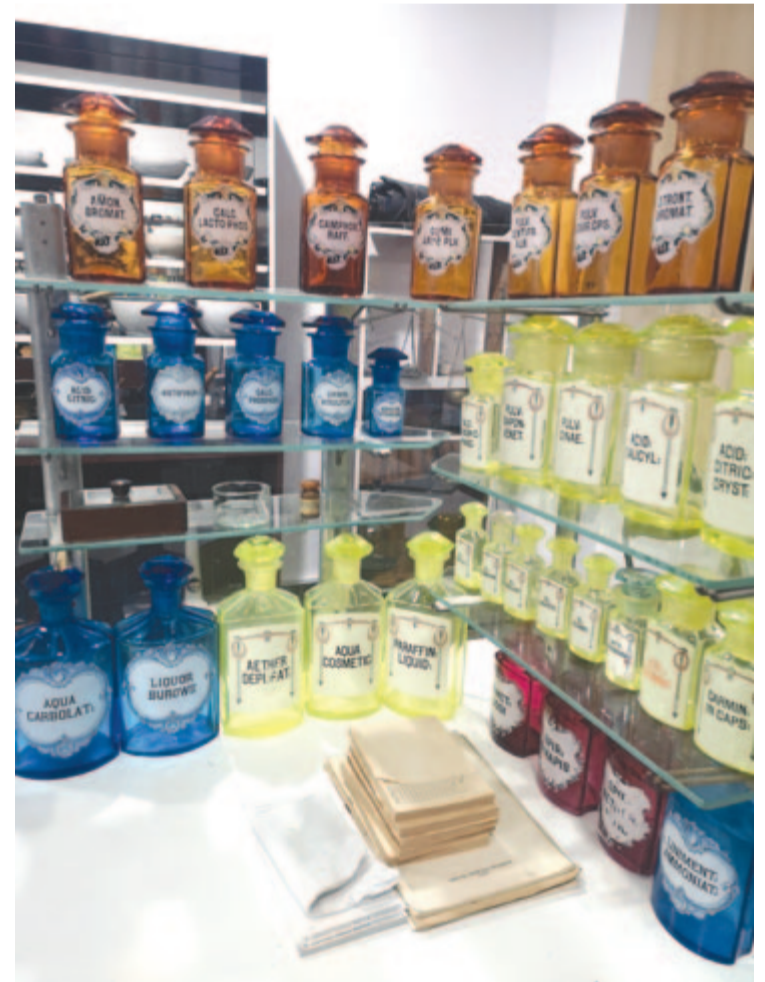
Színes állványedények a táraasztalon