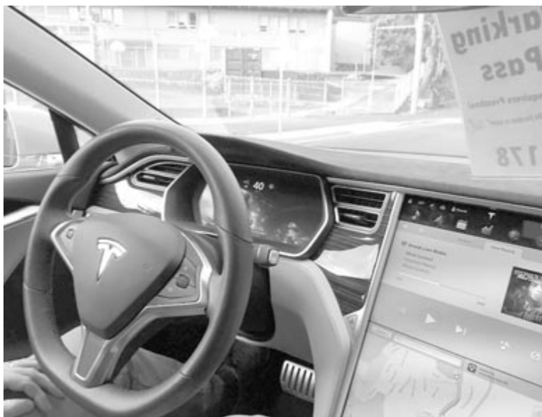
Tesla Full-Self Driving, illusztráció

Igen, az elsődleges célország Kína, azonban ezek a technológiák idővel Európában is meg fognak jelenni. Az önvezetést célzó fejlesztések el fognak jutni az itteni Toyotákba is, illetve az akkumulátorfejlesztések és az ebből fakadó árcsökkenés az elektromos autók esetében az európaiak számára is egy pozitívum lesz. Persze még így is kérdés, hogy vajon időben lépett-e a Toyota, és még képes-e megtartani a piacát, vagy már csak a vonat után szalad. Erre a kérdésre egyelőre nem lehet válaszolni, de az mindenképpen jó hír, hogy a jelenleg legnagyobb piacot vezető autógyártó is felvette a kesztyűt ebben a versenyben, végre valahára.