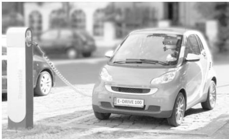
Elektromos autó, illusztráció

Ezen felmérések mellett arról is képet kaptunk a McKinsey kutatásának köszönhetően, hogy a megkérdezettek több mint 70%-a tervezi elektromos vagy hibrid autó vásárlását, miközben 21%-uk azt vallotta, hogy soha nem venne villanyautót. Az igazi meglepetés az, hogy a legszkeptikusabbak azok, akik még sohasem vezettek elektromos autót.