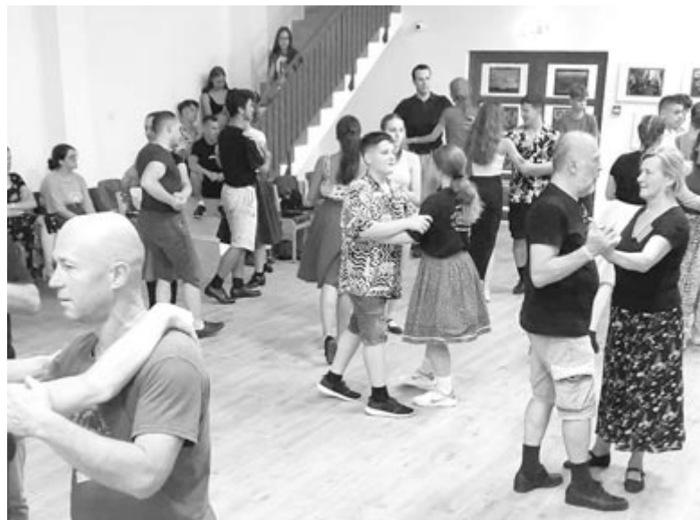
Nemcsak néptáncot, hanem népdalokat is tanulnak, és hangszeren játszanak itt a hét folyamán

telenül sokkal jobbak az adottságok, de még mindig nem tökéletesek. Amennyi pénzt befektettek, jobban ki lehetett volna használni a helyiségeket, ha átgondoltabb lett volna a tervezés. A kultúrotthon nem kimondottan tánc céljából épült, ezért nem „üzletkímélő” a padlózat, a színpad is magasabb lett. Megértik, elfogadják ezt, hiszen a tánc tábor csupán egy hétig zajlik a faluban, az év többi részében más rendeltetése is van az épületnek.