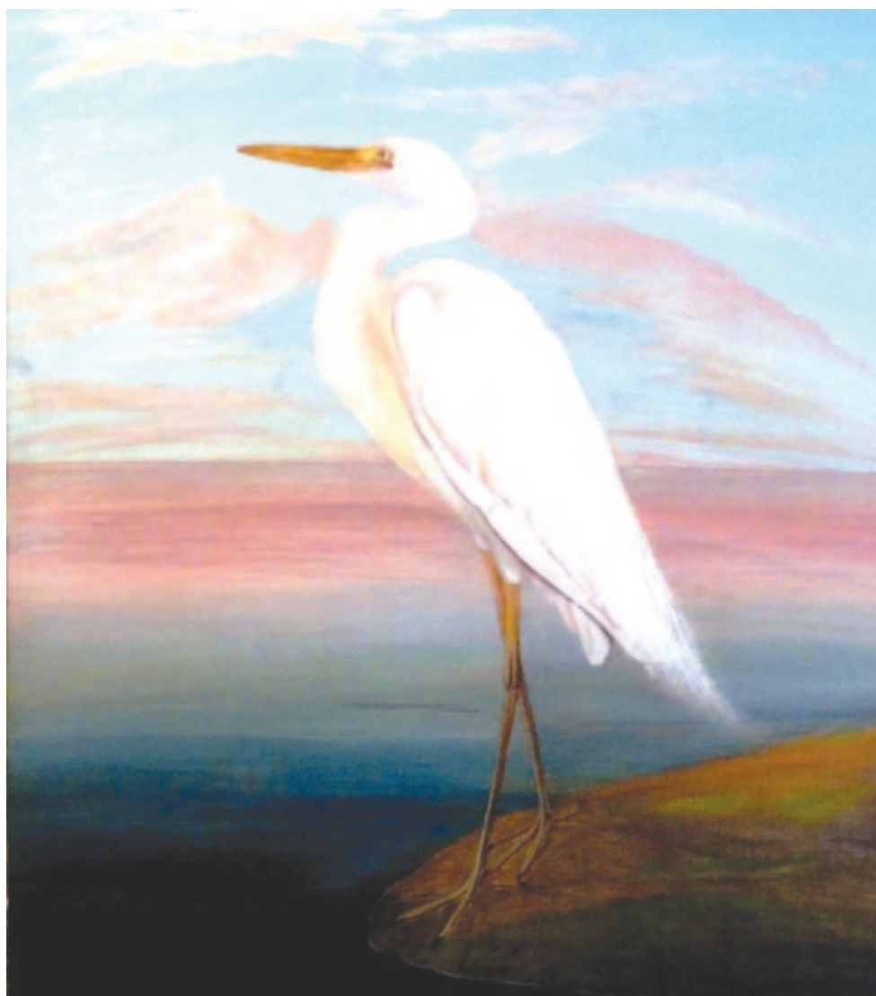
Csontváry Kosztka Tivadar – A gém, 1893

S képzetem hegyvölgyedet nem járja. Lenn az alföld tengersík vidékin Ott vagyok honn, ott az én világom Börtönéből szabadult sas lelkem, Ha a rónák végtelenjét látom.