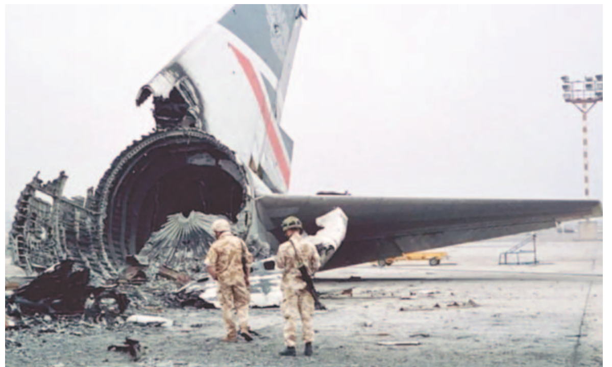
A Boeing 747-es roncsai a kuvaiti reptéren

Az incidens után napvilágra kerültek fényben az a leginkább valószínű, hogy földi felderítő egységnek a konfliktuszónába juttatására használták fel a járatot, és a britek arra számíthattak, hogy a gépnek sikerül felszállnia még a reptér iraki általi elfoglalása előtt, ám az invázióknak a becsültnél gyorsabb előrehaladása keresztülhúzhatta ezeket a számításokat.