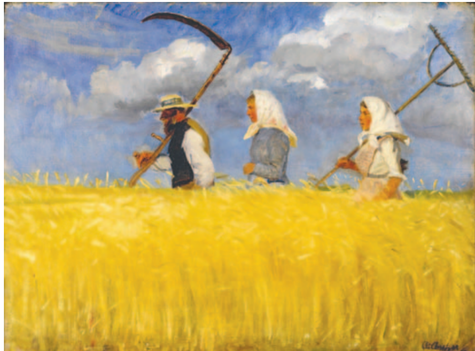
Látom fejünk fölött az ég s az elúszó felhők színét – Anna Ancher dán festőnő – Aratók, 1905

Mit nekem te zordon Kárpátoknak Fenyvesekkel vadregényes tája! Tán csodállak, ámde nem szeretlek,