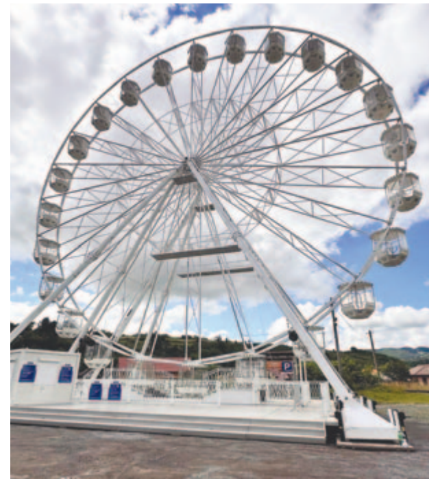
Egyeseknek még tájidegen, de érdekes, új színfoltja Parajdnak az óriáskerék

A Parajdra látogatóknak van amit megnézniük, hiszen van itt trópusi lepkeház, fordított ház, de természetesen a települést a legtöbben a sóbányájáért (amely június 15-étől 8-18 óra között ismét fogadja a látogatókat és kezelésre érkezőket) vagy a sós strandjáért, a Sósoros természetvédelmi területért keresik fel.