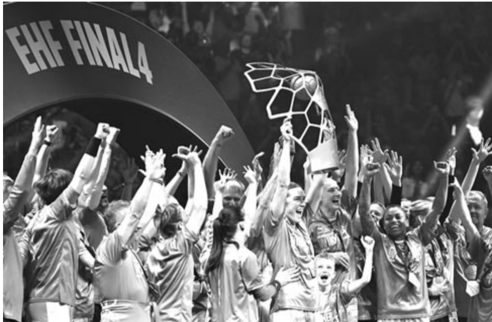
A győztes győri csapat játékosai a tróféával ünnepelnek az eredményhirdetésen, miután 30-24-re nyertek a női kézilabda Bajnokok Ligája négyes döntőjének fináléjában játszott Győri Audi ETO KC – SG BBM Bietigheim mérkőzésen a budapesti MVM Dome-ban 2024. június 2-án.

* döntő: Győri Audi ETO KC – SG BBM Bietigheim (német) 30-24 (17-12).