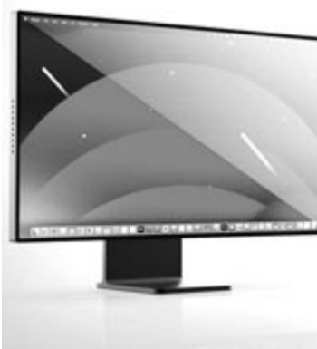
Az új iMac, koncepció

Persze mindez még csak pletyka és híresztelés. Hiszen semmilyen konkrétum nincs azzal kapcsolatban, hogy az Apple valóban elkészíti az új iMac Prót vagy egy új nagyobb iMacet. Pontosabban szinte semmilyen bizonyíték nincs erre. Van viszont egy apró részlet, amelyet Mark Gurman szúrt ki. Az Apple egyik közleményében arról beszélnek, hogy az M4-es processzor – amely az iPad Próban debütált – az „iMacs”-t is érinti. A szó végi „s” betű pedig az angolban a többes szám jele, ebből kiindulva pedig tényleg azt lehet feltételezni, hogy az Apple készül valamivel, és talán valóban visszatér a nagy iMac. Amely a korábbi tapasztalatok fényében minden lesz, csak nem olcsó. Ameddig létezett a 27 hüvelykes iMac, az alapváltozatért 1799 dollárt kértek az Egyesült Államokban. Ha lesz új kivétel, annak az árcédulája már minden bizonnyal kettessel fog kezdődni. Ez Amerikában, Európában – ahogy minden Apple-termék esetében megszokhatták a vásárlók – még borsosabb lesz az ár. Persze azt is hozzá kell tenni, hogy egy professzionális felhasználásra szánt gépről van szó, amire nem mindenkinek van szüksége, a hétköznapi felhasználásra bőven elég egy 24 hüvelykes iMac belépő változata is.