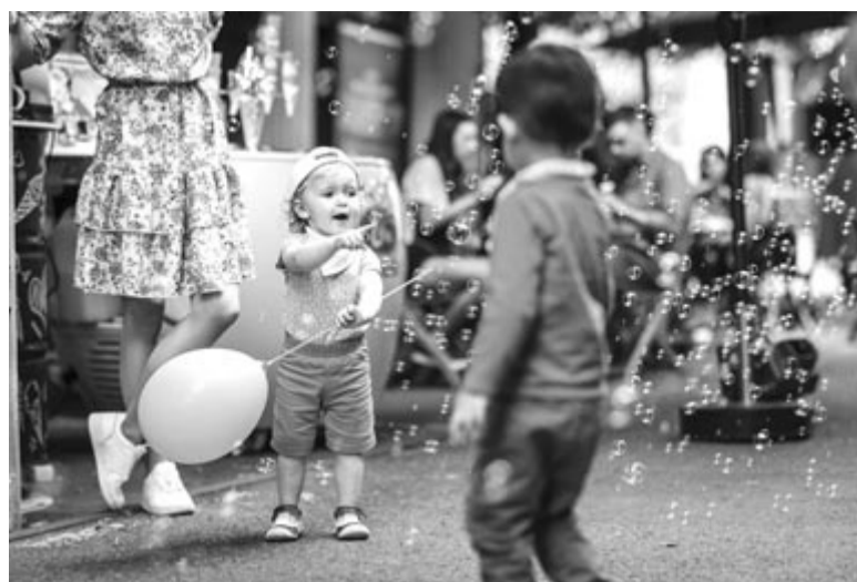
Az egészen kicsik is nagyon jól érezték magukat az eseményen