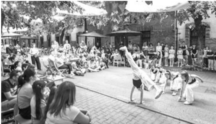
Blessed Dance Show, a Vibe The Street Edition második kiadásának megnyitóján