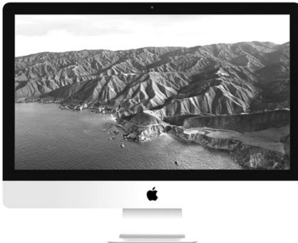
A régi 27 hüvelykes iMac