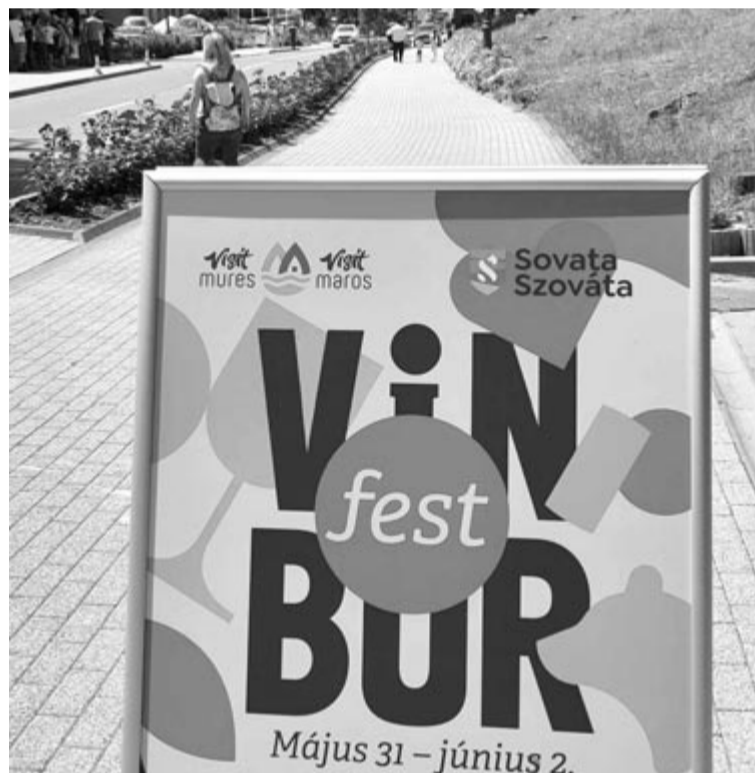
Borfeszt – új idénnyitó program

A szombat délelőtt – gyermeknap lévén – a gyerekekről szólt, pénteken és szombaton délután jó életvitelükkel példát mutató, sikeres személyeket próbáltak bemutatni. Ezzel szembeállították a káros szenvedélyeket, a drogot az élsporttal, a sikerrel, és remélik, hogy a kettő után a minőségi élet szükségességét tudják felmutatni, főleg az ifjúságnak. „Szervezhetünk nagy rendezvényeket, ha a sarokban megmérgezik a fiatalokat, vagy létesíthetünk bármilyen infrastruktúrát, ha a gyermekeink tönkremennek vagy elmennek, ha nem tudnak sikeresek lenni a szülőföldön, akkor nem valósítottunk meg semmit” – fejtegette az előjáró. Ezért is nem sörfesztivált szerveztek, és remélik, hogy ez a rendezvény sikeresebb lesz az eddigiéknél. Ha nem, akkor tovább for-