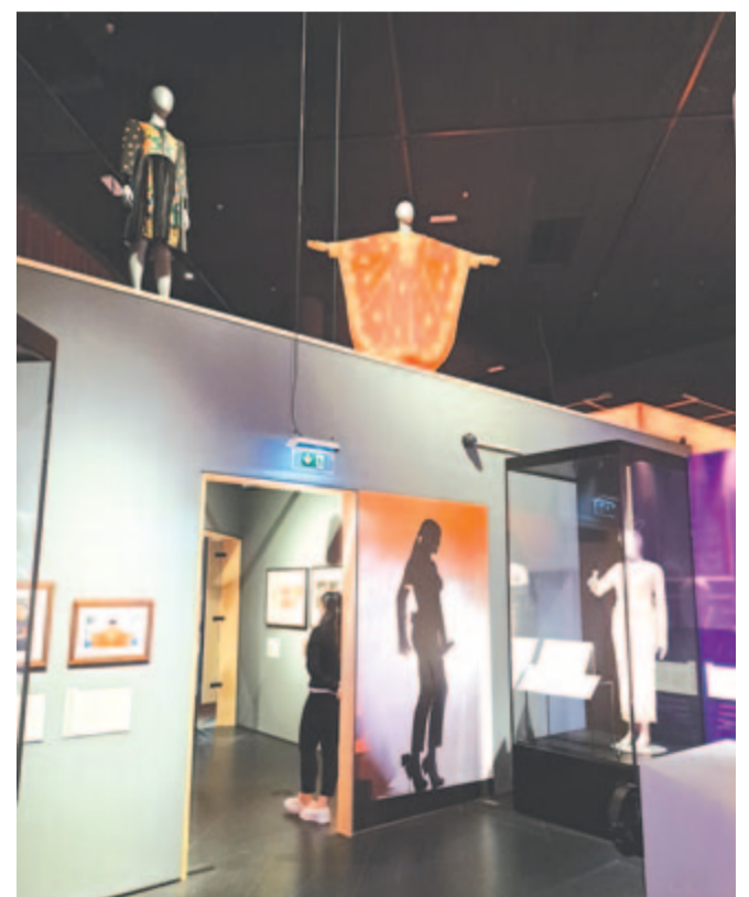
Itt a diva! Hol a diva?

zenével, slágerekkel, fény-árnyék csodákkal, a dívák és idolk körülrajongott másával, hihetetlen fellépőöltözékeivel. Amint haladunk előre és felfele a spirálszerűen berendezett kiállítás, egyre újabb korok, zenés korszakok ámítanak el a maguk sokféleképp kifuttatott történéseivel. A nézőközönség vegyes, fiatal rajongók és idős nosztalgizáló emlékei, kedvenc zenés műfajai kelnek életre. Tetszés szerint lehet hosszasan időzni vagy továbbhaladni, vissza-visszatérni valamihez, valakikhez, megbizonyosodni arról, hogy Madonna vagy Lady Gaga tényleg azt vagy amazt viselte vagy nem viselte, és így tovább. Több mint egy évszázadot ölel át a rendezvény, van benne opera, operett, folk, rock, minden, ami ebben a parttalan zenés univerzumban számít. Rengeteg nevet kellene sorolnunk, ha nem akarnánk, hogy valaki kimaradjon. Esélytelen próbálkozás lenne, de a már említettek mellett a dívák és ikonok közül néhányan mindenképp idekívánczolgatnak, már csak az érdekesség kedvéért is: Josephine Baker, Whitney Houston, Cher, Marlene Dietrich, Marilyn Monroe, Tina Turner, Maria Callas, Ingrid Bergman, Adele, Björk, Billie Eilish, Beyoncé, a magyarok közül pedig Blaha Lujza, Honthy Hanna, Marton Éva, Medveczky Ilona, Cserháti Zsuzsa, Koncz Zsuzsa, Zséda, Péterfy Bori és így tovább. Miközben a férfi sztárokat még csak meg sem említettem. Izgalmasabb valamenynyitüket a helyszínen felismerni. (N.M.K.)