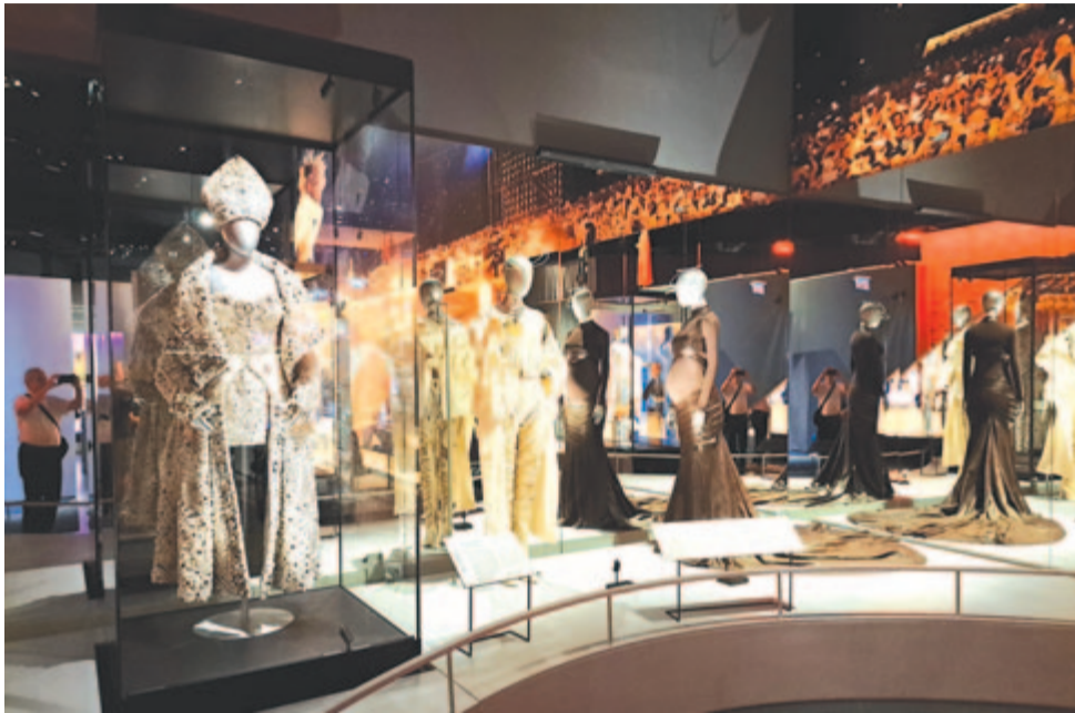
Csupa tükör, csupa fény minden szinten