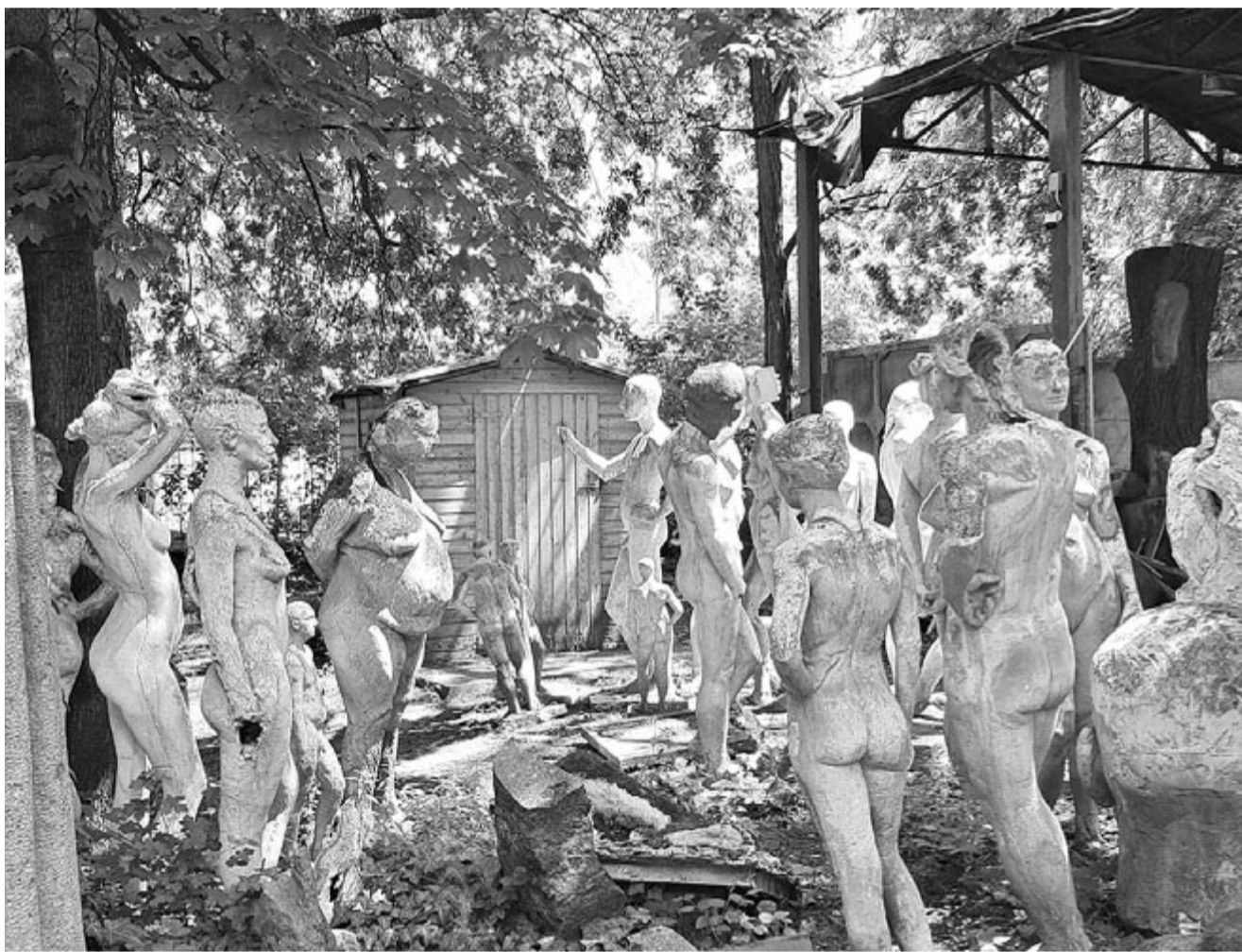
Szobrok, torzók a budapesti Epreskertben