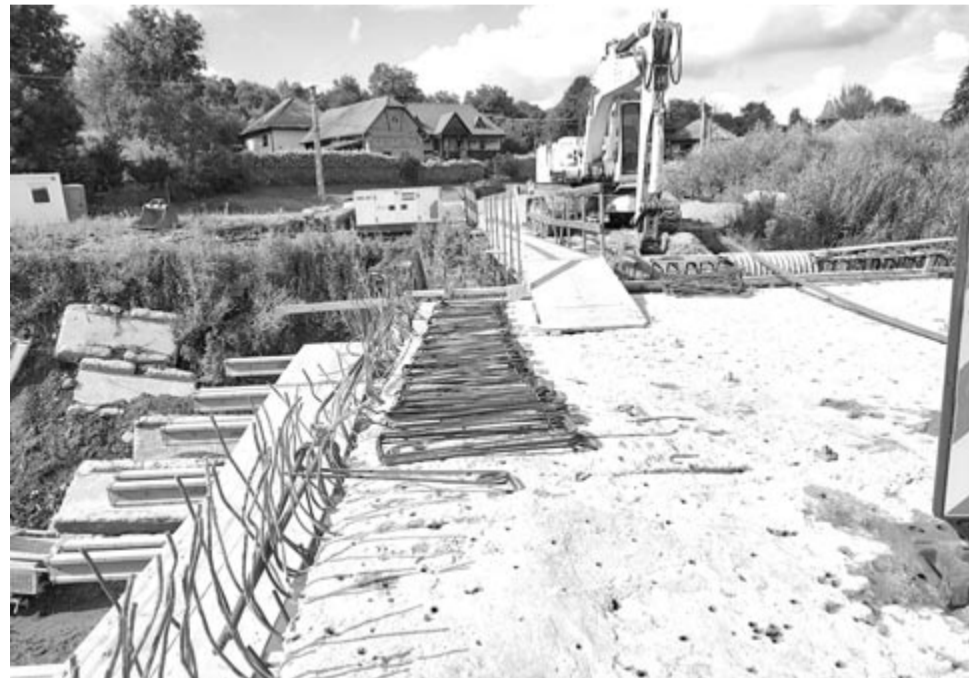
Még mindig nincs látványos haladás, a határidő augusztus 29. volna

arra számított, hogy az új műszaki tervek elkészülte után gyorsan és látványosan haladnak majd a híd megerősítésével, újrapépítésével. Ehelyett tizenhárom hónapja egy hat kilométeres kerülő úton kell naponta egyszer-kétszer vagy akár gyakrabban is végigdöcögnie mindenkinek, aki Nyárádszereda irányából Akosfalva érintésével szeretne Marosvásárhely, Kolozsvár vagy Segesvár irányába utazni, nem beszélve a Nyárádgálfalva és Backamadaras községbeliekről, akiknek ugyancsak kilométereket kell kerülniük, ha valamelyik közeli települé-