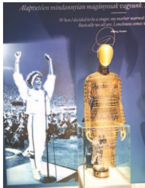
Whitney Houston fotója, fellépőruhája

a világ legnagyobb iparművészeti és design-múzeumban, a londoni Victoria and Albert Museumban került közönség elé, és budapesti megrendezése után földünk több más híres létesítményébe is eljut. Világstárok és jelen esetben magyar zenei, filmes, színházi idolk fellépőruhái, utcai és vörös szőnyeges viseletei, csilli-villi divatkreációi köré épült fel itt minden. Ahogy mondani szokás, csupa csipke, csupa báj most a Magyar Zene Háza két alsó szintje. Némi hár is van itt-ott, de azt többnyire takarni próbálják a ruhaköltemények. Bár az sem titok, hogy ebben a műfajban nem a takargatás a fő cél. Ezen a tárlaton sem. Ha módja van rá, az ilyesmit megnézi a turista, akkor is, ha e műfajnak nem feltétlen rajongója. És nem bánja meg, ezt bátran állítom. Nem a felvonultatott ruhák vagy azok hiányos volta miatt, ehhez elég a sztárvilágot