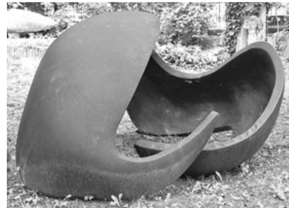
Szembesülő korok, formák... Ez is az Egreskert