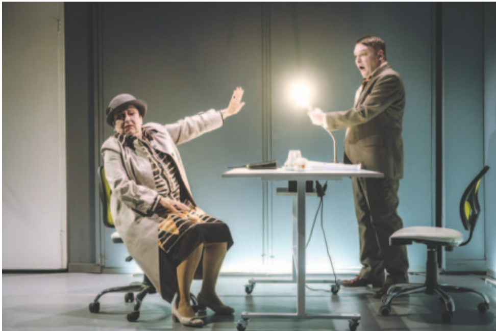
Csónak, avagy előttünk az özönvíz

Jegyek és bérletek személyesen a Marosvásárhelyi Nemzeti Színház nagytermi jegypénztárában válthatók (nyitvatartás: hétfőtől péntekig 9–19 óra között, tel. 0365-806-865), a helyszínen előadás előtt egy órával, valamint online a https://teatronational.biletmaster.ro/?lang=hun honlapon. (Knb.)