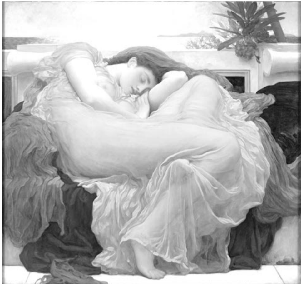
Lord Frederic Leighton: Lángoló június (1854)

1926. június 1-jén, 98 éve született Újpesten a Kosuth- és József Attila-díjas költő, író, esszéíró, irodalomkritikus, műfordító, a nemzet művésze (elhunyt 2017. november 24-én Budapesten).