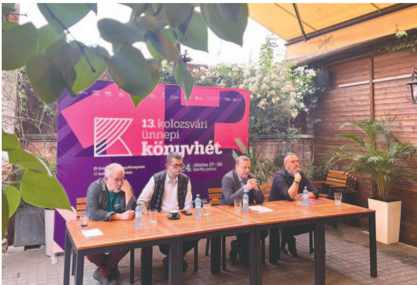
A kolozsvári ünnepi könyvhét sajtótájékoztatója

– Belenyugodnék – abban a tudatban tennem, hogy csupán vendégek vagyunk a földön.