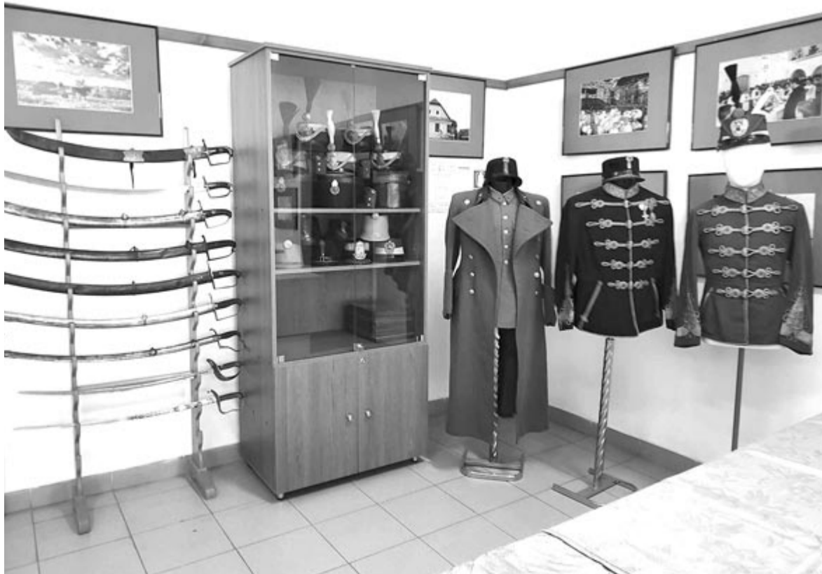
Gazdag hadászati kiállítást rendeztek a helyszínen