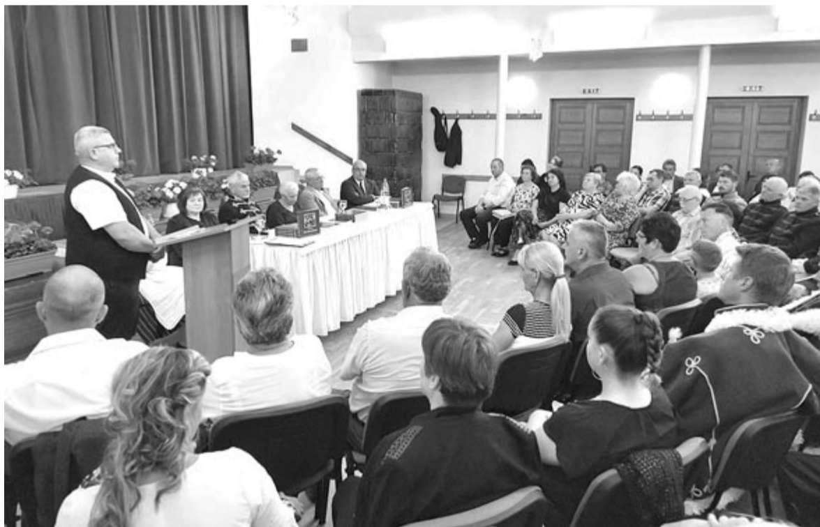
Nagy érdeklődés övezte a kibédi könyvbemutatót

A kötetben számos egyéb, a háborúhoz kapcsolódó érdekességet is találunk, mint a Czeszochowát védő kibédiek, és olyan embereket is megismerhetünk, akikkel a háborút megjáró kibédiek is találkoztak. Két helybéli katonát egyik lágerben Bárány Róbert orvos is gyógyította, aki akkor a fogolytáborokban dolgozott, miközben a világ már 1914-ben Nobel-díjjal tüntette ki, és 1916-ban megmozdult a kiszabadításáért. Szó esik Gyóni Gézaról, a „háború költőjéről” is, aki Przemyslben találkozott a hadifogoly Bárányal.