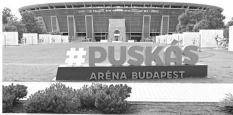
A Puskás Aréna Budapesten. Az Európai Labdarúgó-szövetség (UEFA) végrehajtó bizottságának döntése szerint itt rendezik a labdarúgó Bajnokok Ligája 2026-os döntőjét.

A női BL-finálét két év múlva Oslóban rendezik meg, a 2027-es döntőre viszont új pályázatot írnak ki.