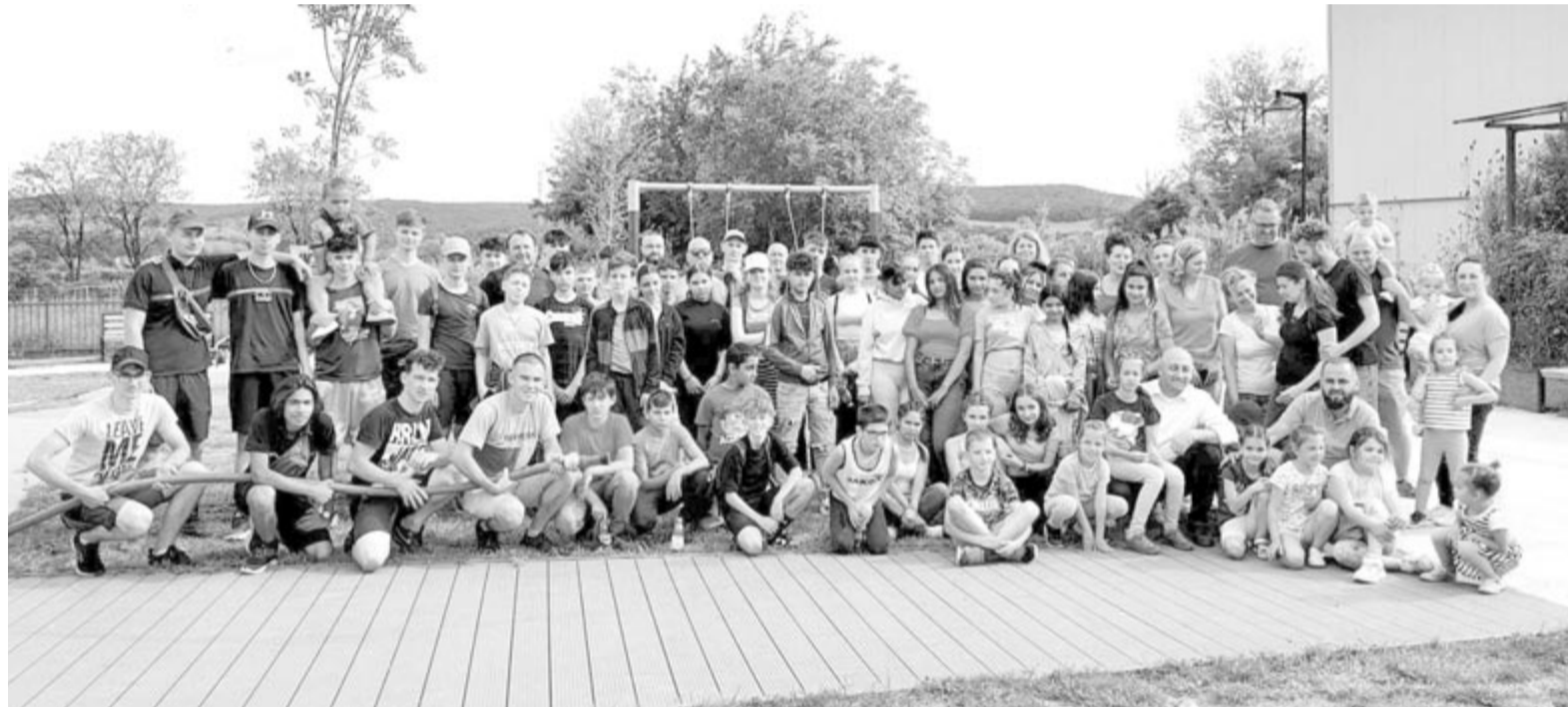
Örvendetesen nagy volt az érdeklődés az első közösségi faültetés iránt, sokan vettek részt múlt pénteken

Az alapítvány által közzétett lajstrom szerint az önkormányzat két fát, 17 vállalkozó, három intézmény, két párt és egy baráti kör egyet-egyet vásárolt, továbbá hat magánszemély, család is adományozott (egyikük három fát megvásárolt). Minden fa merevítő-állványára felszerelték egy-egy kis emléklapoktat a támogatók nevével.