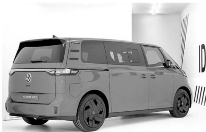
Volkswagen ID.Buzz GTX

Azzal kapcsolatban, hogy pontosan mikor is vezetnek ki a GTX jelölést, egyelőre nincsenek pontos információk, viszont nagy valószínűséggel még egy kevés ideig megmarad, már csak azért is, mert nemrég vezették be az ID.Buzz GTX-et. Ezt a modellt pedig minden bizonnyal nem fogják átnevezni, legalábbis a ráncfelvarrásig vagy generációváltásig nem. Ahogyan a német autógyártó arra is megoldást kell találni, hogy a sportos villanyautók esetében hogyan fogja jelölni, ha azok összerékhajtásúak is? Lesz-e erre egyáltalán valamilyen külön jel, például GTIX, vagy egyszerűen csak odabiggyeszti a név mellé a 4motion feliratot is? Ezekre a kérdésekre talán még a gyártó sem tudja a biztos választ, de a közeljövőben kénytelen lesz kitalálni.