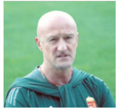
Marco Rossi, a magyar labdarúgó-válogatott szövetségi kapitánya a csapat sajtótájékoztatóján a telki edzőközpontban 2024. május 27-én. A válogatott megkezdte felkészülést a közelgő Európa-bajnokságra

Az 59 éves szakvezető azt mondta, meccsről meccsre gondolkodnak, a válogatott tagjai számára jelenleg a Svájc ellen június 15-én