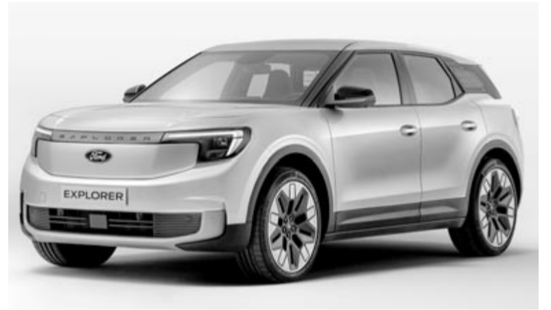
Elektromos Ford Explorer, illusztráció

Sokan várják az elektromos autókat, sokan pedig tartanak a térnyerésüktől. Viszont látni kell azt is, hogy a legtöbb gyártó, így a Ford is, ezekkel képzelet el a jövőt, még akkor is, ha ez a bizonyos jövő távolabb van Európában is, mint ahogyan azt előzetesen elképzelték.