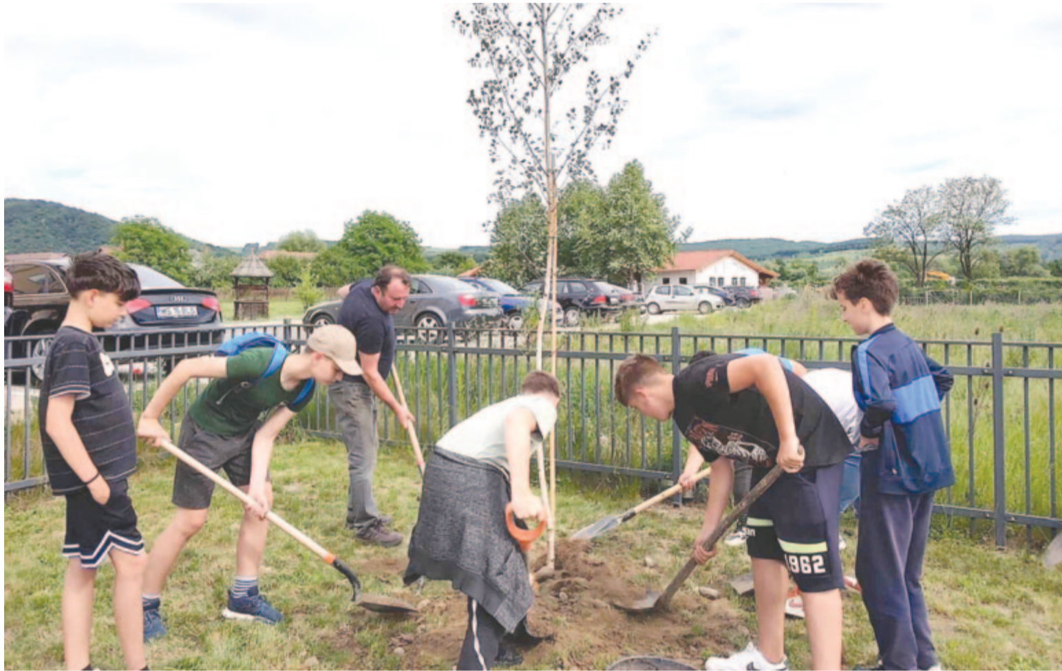
A gyerekek örömmel vettek részt a munkában