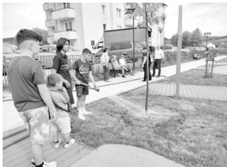
Az ifjúsági tűzoltók meglocsolták a fákat