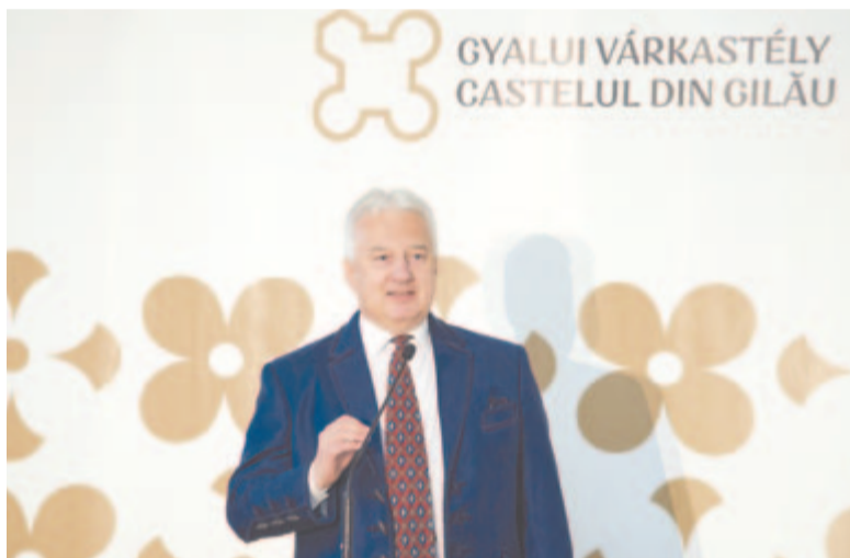
Semjén Zsolt, Magyarország miniszterelnök-helyettese

Mint ismeretes, a gyalui vár leg- régebbi része a XV. század elején épült fel a hajdani Dacia provincia legnagyobb castrumának romjai közelében. A gótikus stílusjegyeket