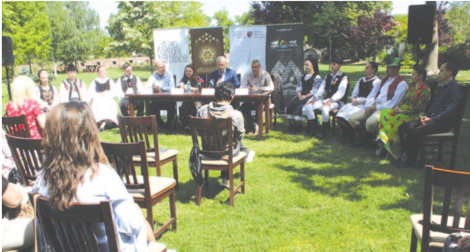
Fesztivál a kulturális sokszínűség jegyében