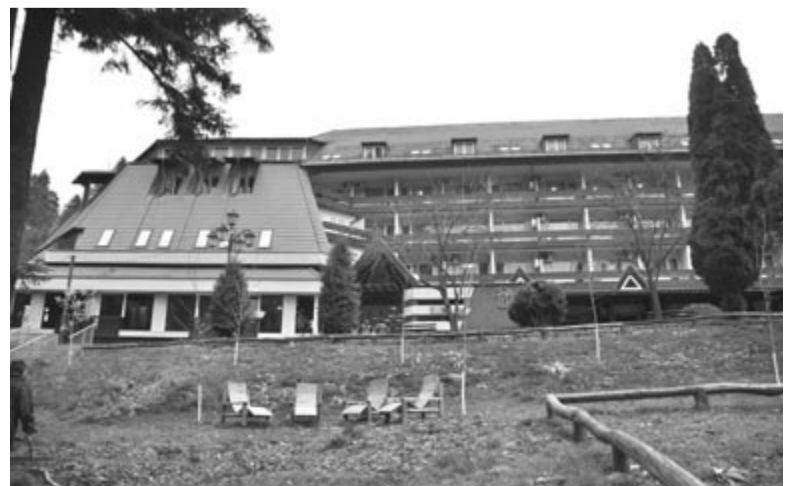
Szálloda Tusnádfürdőn – vendégekre várva