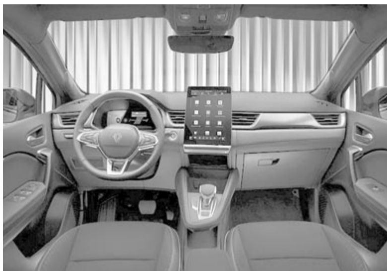
Renault Symbioz, beltér