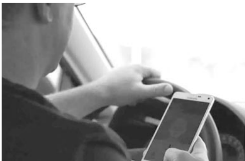
Vezetés közbeni mobiltelefon-használat