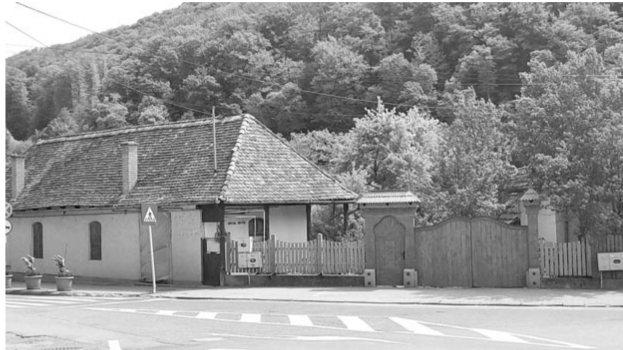
Itt rendezik be a tájházat, már az idén megnyithatják

A mostani ingatlan minden szempontból megfelel, ugyanis a városközpontban, az önkormányzat közvetlen szomszédságában van, a fürdőtelepre vezető egyik út és a városban áthaladó megyei út elágazásánál, ezért a működtetése könnyebb lesz, mint ha a város egy másik, esetleg távolabbi részén volna. A helyi tanácsban vannak olyan képviselők, akik számára fontosak a népi értékek, a hagyományok megővése, ők kezdeményezték a tájház létesítését, az önkormányzat pedig saját forrásból vásárolta meg és újította fel – mondta el a sajtónak Fülöp László Zsolt polgármester. (GRL)