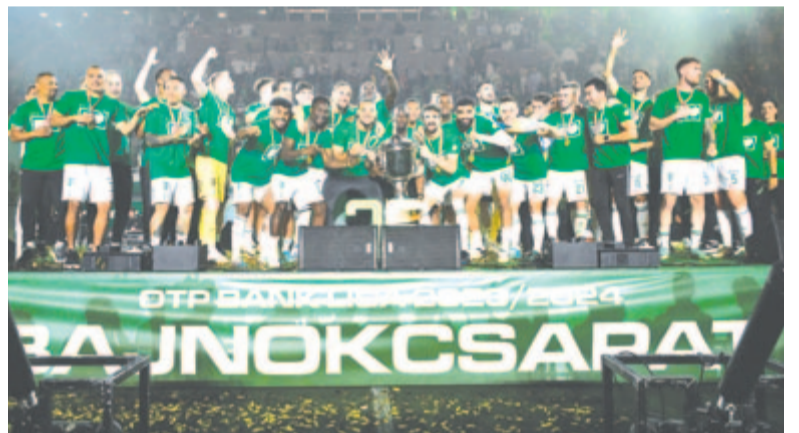
A Ferencvárosi TC játékosai a bajnoki kupával

* NB II, 33. forduló: BFC Siófok – HR-Rent Kozármisleny 0-3, Tiszakécskei LC – BVSC-Zugló 1-1, Budapest Honvéd – Gyirmót FC Győr 2-2, Szombathelyi Haladás – FC Ajka 1-3, Soroksár SC – Kolorcity Kazincbarcika SC 3-1, Budafokei MTE – Pécsi MFC 2-0, Szeged-Csanád Grosics Akadémia – Credobus Mosonmagyaróvár 3-2, Nyíregyháza Spartacus FC – Aqvital FC Csákvár 2-1, ETO FC Győr-Vasas FC 3-2. Az élcsoport: 1. Nyíregyháza Spartacus FC 76 pont, 2. ETO FC Győr 66, 3. Vasas FC 64.