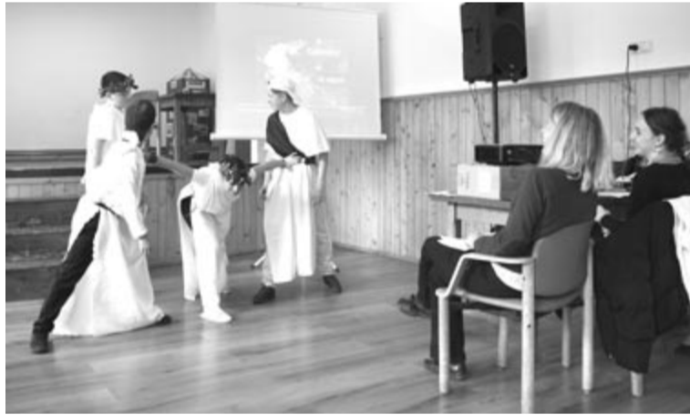
Számos ötletes, hangulatos, játékos bemutatónak örülhetett a zsűri.