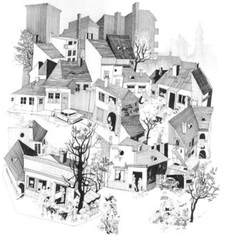
Külvárosi vasárnap... Vass Tamás grafikája, 1977