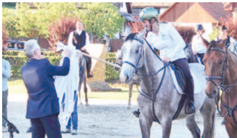
Péntek este 16 imaszalagot kötöttek fel a keresztre