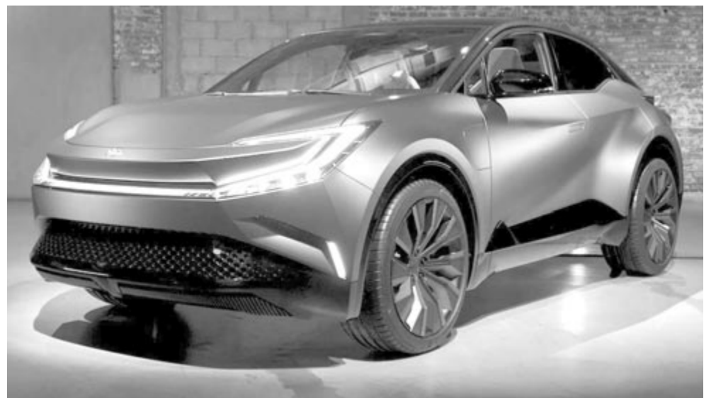
Forrás: Toyota Toyota bZ3C