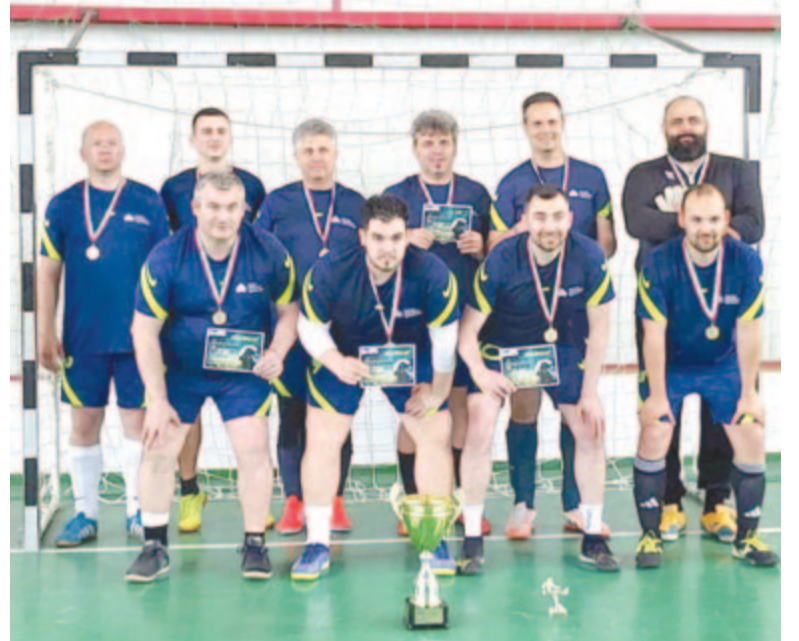
Negyedszer is magyarországi lelkészeké a kupa