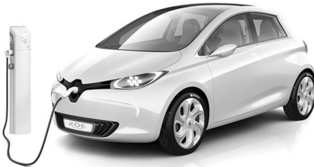
Elektromos autó, illusztráció

Ami pedig világviszonylatban az elektromos autók térnyerését illeti, a Nemzetközi Energiaügynökség szakértői úgy vélekednek, hogy a jelenleg bejelentett akkumulátorgyártó kapacitások bőven elegendőek lesznek arra, hogy kiszolgálják a 2030-ban várható keresletet. Valamint, ha a kormányok tartják a globális felmelegedés megfékezésére hozott intézkedések ütemtervét, akkor 2035-re, vagyis bő tíz év múlva, minden három eladott új autóból kettő elektromos lehet. Az arány elérésére globális léptékben van esély, Romániában, ahol az autópark átlagéletkora 18 év körül mozog, még sokat kell várni erre.