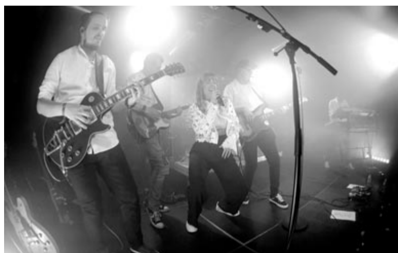
A Mel'amour zenekar koncertje

Bár csak most jött ki az első nagylemezük, a zenekar tagjai ilyen értelemben is fókuszálnak a jövőre. A Népszágnak elárulták, hogy jövőben szeretnék legalább négy-öt új dalt, de egy újabb nagylemez lehetőségét sem vetik el! Nincs megállás, látták, hogy mennyire össze-