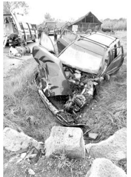
Az ehedi balesetben megsérült gépkocsivezetőt kórházba szállították, utasa viszont a helyszínen meghalt