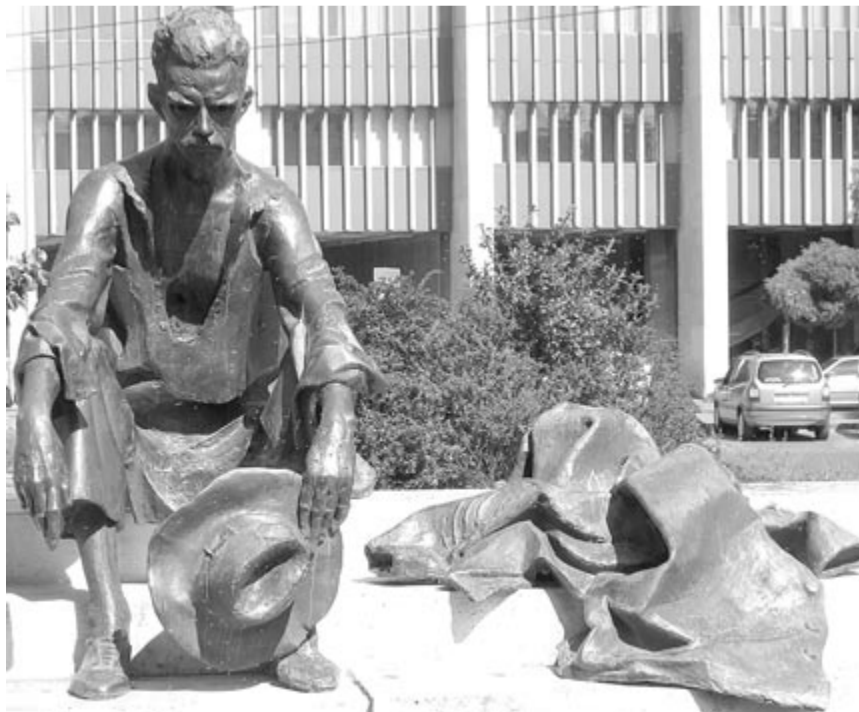
József Attila szobra Budapesten

Ehess, ihass, ölelhess, alhass! A mindenséggel mérd magad!” ( Ars poetica , 1937)