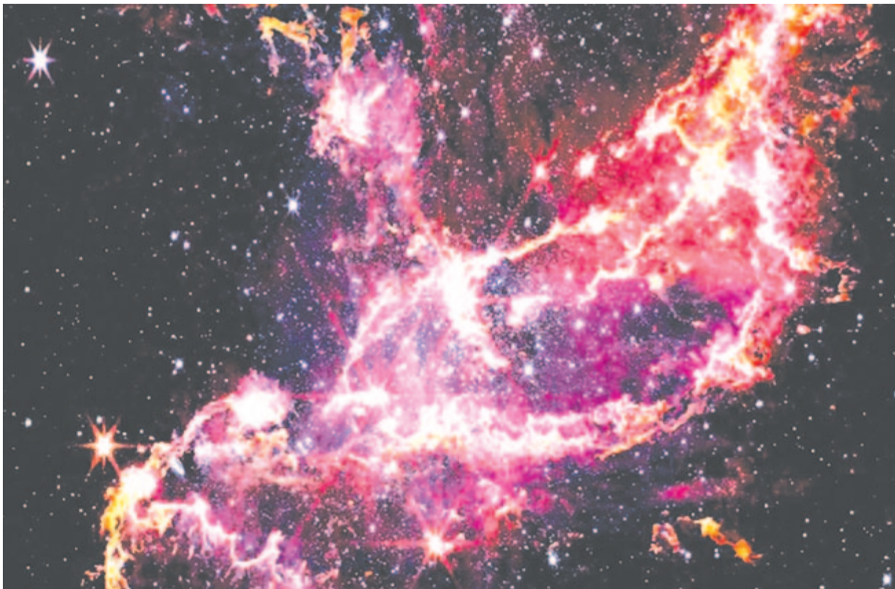
A 10 milliárd éves NGC 346 csillagköd a Kis Magellán-felhőből – a James Webb űrteleszkóp felvételén

Kelt 2024-ben, pünkösöd havának első péntekén