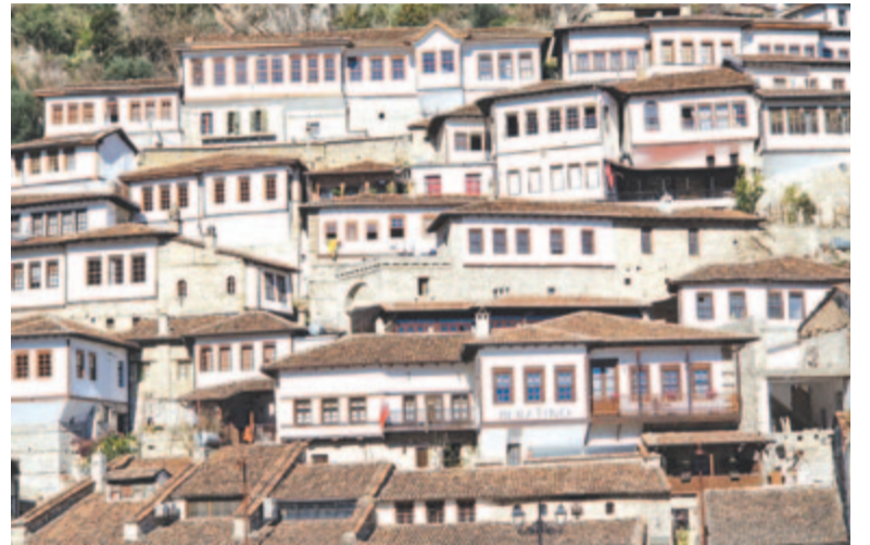
A világörökség része (Berat)

Érdekes továbbá ellátogatni Kruja történelmi városába, amely a XV. században az Oszmán Birodalom terjeszkedésével szembeni albán ellenállás történelmi helyszíne, szimbóluma. Továbbá Tiránából viszonylag hamar elérhető az autópályán Durrës tengerparti városa, ahova rendszeresen járnak au-