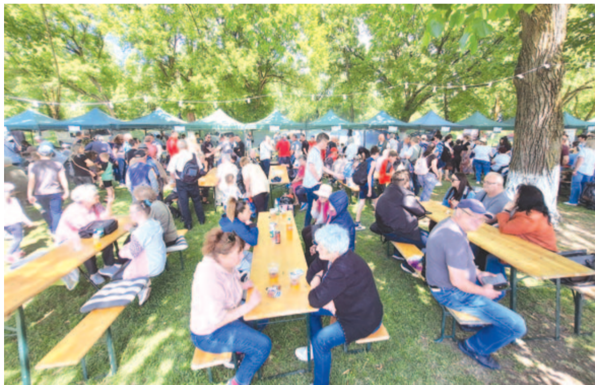
Fotók: Karácsonyi Zsigmond