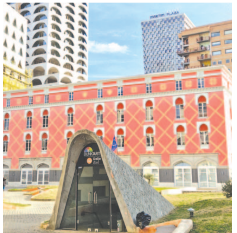
A központi bunker bejárata (Tirana)

lett, a második világháború lezárásakor az antifasiszta felszabadítási front, aztán a nemzetgyűlés székhelye, végül 1972-től akadémiai központ. Tömény történelem egyetlen épületben. De az elmúlt évszázadokban, évtizedekben jelentős metamorfózison esett át még számos épület, városnegyed. A 17. század-