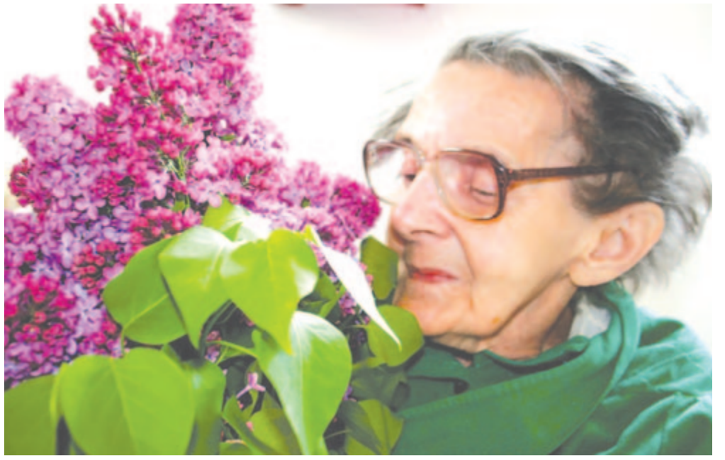
Orgonának lila bugája bűgött

Flórián napja május 4. Szent Flórián tisztelete elsősorban Ausztriában és a környező országokban virágzik a késő középkor óta. Tűz és árvíz ellen hívták segítségül. A legenda szerint már gyermekkorában megmentett egy égő házat az elhamvadástól. A tűzzel dolgozók (tűzoltók, serfőzők, faze-kasok, pékek, kéményseprők) védőszentje lett, a gyakori tüzesetek miatt a barokk kortól kezdve már minden tehetősebb polgár házában homlokzatán fülkébe állították szobrocskáját. Florianus jelképes alak, akit azért hívtak az egyház életre, hogy a május eleji pogány szokásokat általa is megkeresztelje. Neve „virágzó” jelent, s a római Flora istennőtől kapta, Flórián a húsvétot követő „virágos kedvű 40 nap” jelképe. Flórián tűzzel való kapcsolata is összefügg a ciklusváltással.