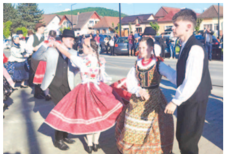
Mintegy kétszáz fiatal ropta a táncot Szereda főterén, majd a művelődési ház színpadán, egy kiscybergyógyulásáért