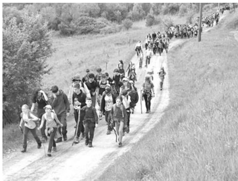
Idén nagyon sokan, mintegy négyszázan tették meg a távot a két település között

Hajdu Zoltán hozzátette: a gyalogos turizmusnak jövője van, és a