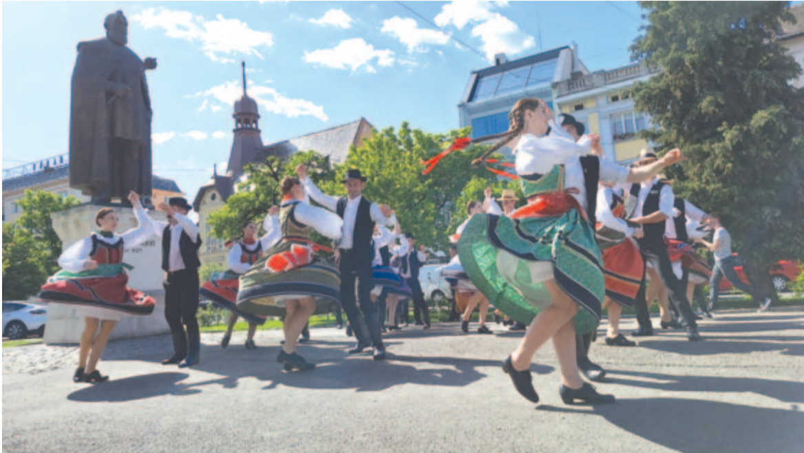
A Bethlen-szobor előtt is táncra perdültek