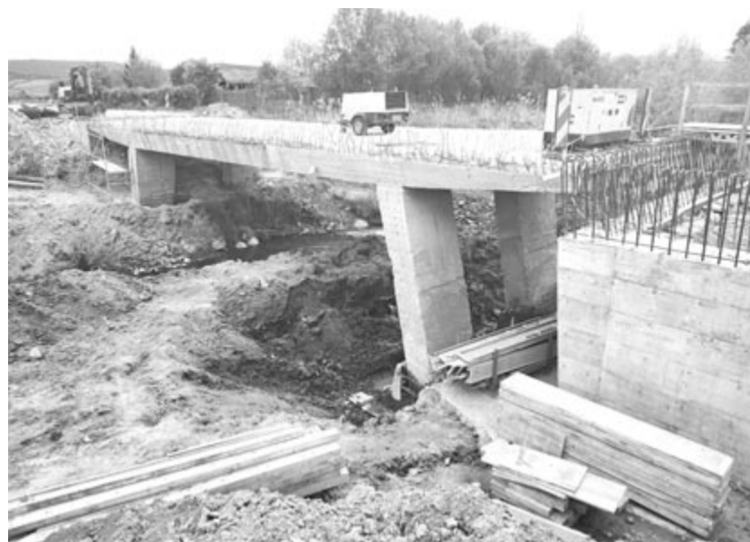
Nemcsak a hidat, hanem a mellékét és tartószerkezetét is meg kell erősíteni

Újakezdte a munkálatokat a kivitelező a nyárádszentlászlói hídnál, a Nyárádtő–Ákosfalva–Székelytompá útvonalon. A híd újajépítését tavaly május végén kezdték el, de egy hónap múlva felfüggesztették a beavatkozást, miután kiderült, hogy a híd szerkezete jóval nagyobb mértékben károsult, mint azt gondolták. Amint arról már többször beszámoltunk, az 1971-ben épült híd megbontásakor kiderült, hogy sem a betonvasazata, sem betonszerkezete nem megfelelő, ezért az eredeti műszaki megoldás szerint nem lehet felújítani. Hosszas és bürokratikus eljárást követően két új műszaki javaslatot terjesztett elő a tervező, ebből a másodikikat fogadták el, így folytatható a munkálat, amelyet a beruházó, tulajdonos Maros Megyei Tanács tájékoztatása szerint március 20-án kezdtek újra. A kivitelezőnek a meglévő vasazathoz kapcsolódva kell vasbeton erősítést végeznie a hídon. Mivel ezzel megnő a hídszerkezet súlya és terhelése is, a betongerendák és támpillérek megerősítésére is szükség lesz. A beruházás időtartama 20 hónap a helyszín kezdeti átadásától számítva, azaz idén augusztus 29-ig be kell fejezni a munkálatokat. Az új műszaki megoldás révén megnőttek az eredetileg becsült költségek is, ezt szerződéskiegészítésben is rögzítették: a beruházás friss végértéke 4.136.086,61 lej (azaz a héával együtt a 4,9 millió lejt is meghaladja).