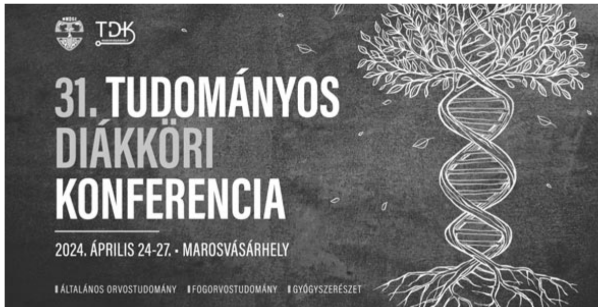
A 31. Tudományos Diákköri Konferencia plakátja