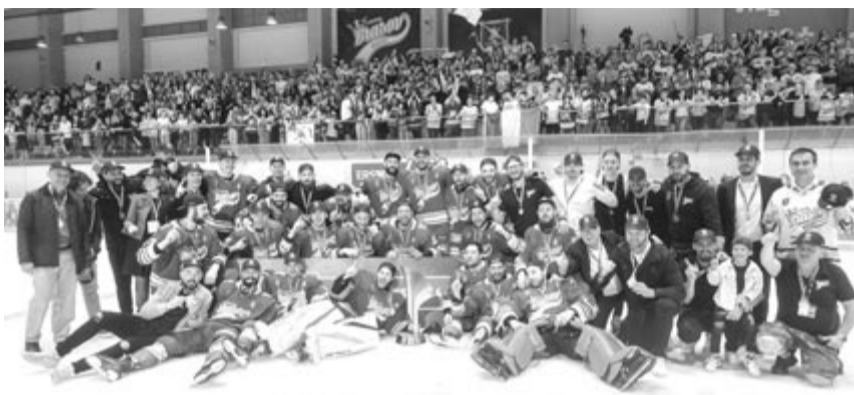
A győztes Corona Brassó csapata és stábjja a jégkorong Erste Liga döntője, a Corona Brassó – FTC Telekom negyedik mérkőzésének végén a brassói Olimpiai Jégpályán 2024. április 10-én.