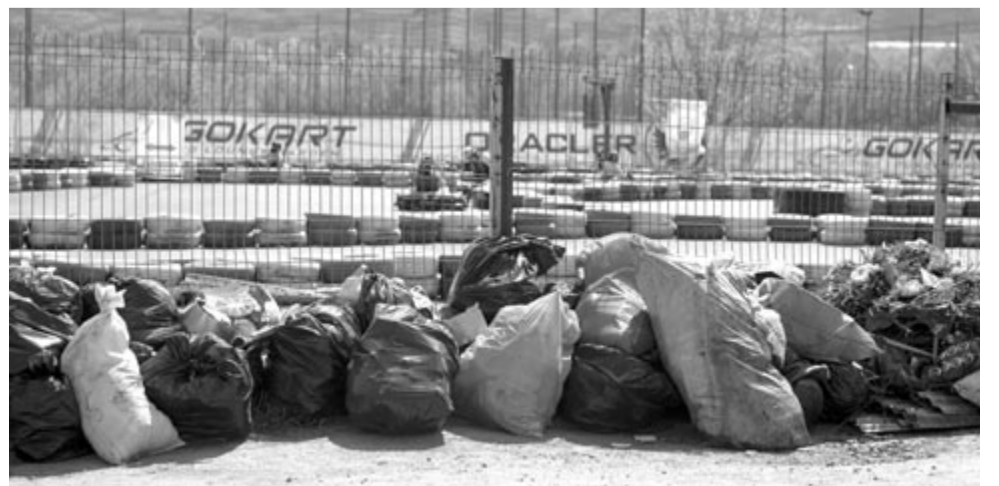
A tavaly összegyűjtött szemet egy része

Az idei, hetedik Közösen kitakarítjuk! partnerei: Ecolect Mures, Maros Megyei Barlangi és Hegyimentő Szolgálat, Marosvásárhelyi Nemzeti Színház, Maros Művészegyüttes, Maros Megyei Rohamentő Szolgálat, Bioeel, Mures Runners, Outdoor Experience, GoKart, Marosközéki Közösségi Alapítvány, DIVERS Egyesület – Női Akadémia, What's in the Box Production, JCI Marosvásárhely, Outward Bound, 3SS, Erdélyi Magyar Televízió, Népszerűség, Vibe Fesztivál, Marosvásárhelyi Művészeti Egyetem, valamint Marosvásárhely és Maros-szentgyörgy önkormányzata és Maros Megye Tanácsa.