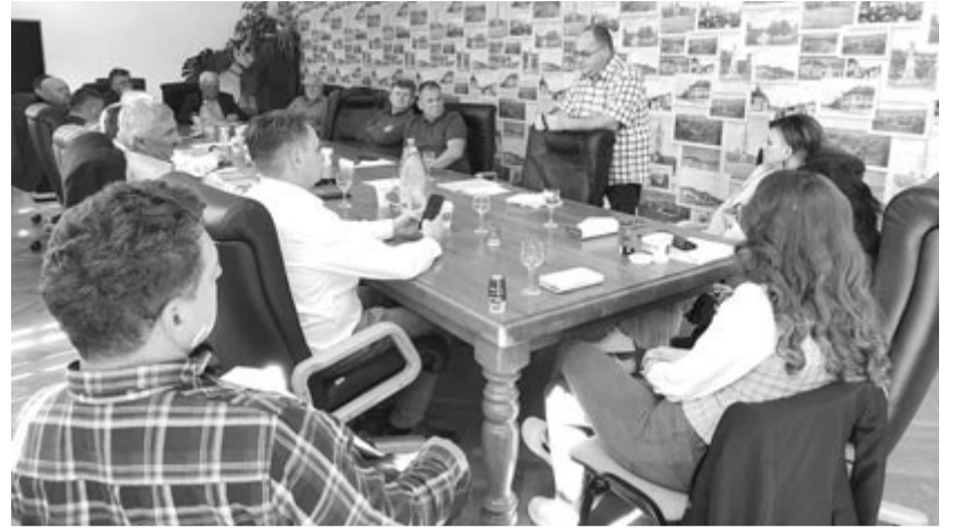
Több szalon fut a kistérségi munka, ezek folyamatáról rendszeres találkozókon tájékoztatják az egyesületi tagokat

Péter Hunor ennél kedvezőbb hírekkel tudott előállni a jelenlegi LEADER program keretében folyó, a Marosmente LEADER Egyesülettel közösen megvalósítandó turisztikai együttműködéses projekt kapcsán: már történtek közbeszerzések, és hamarosan műhelymunkákra kerül sor, amelyek a vidék előljárói arról értekeznek, hogy a kulturális és épített örökséget miként lehet hasznosítani a térség turisztikai fejlesztései érdekében. Ugyanennek a projektnek a keretében nemsokára egy 80 négyzetméteres mozgatható színpad vásárlására is sor kerül, amely a kulturális örökség népszerűsítésében lesz a két térség számára – hangzott el az egyesületi közgyűlésen. Mivel a projekt utófinanszírozású, a beruházást önrészből kell megvalósítani, amihez