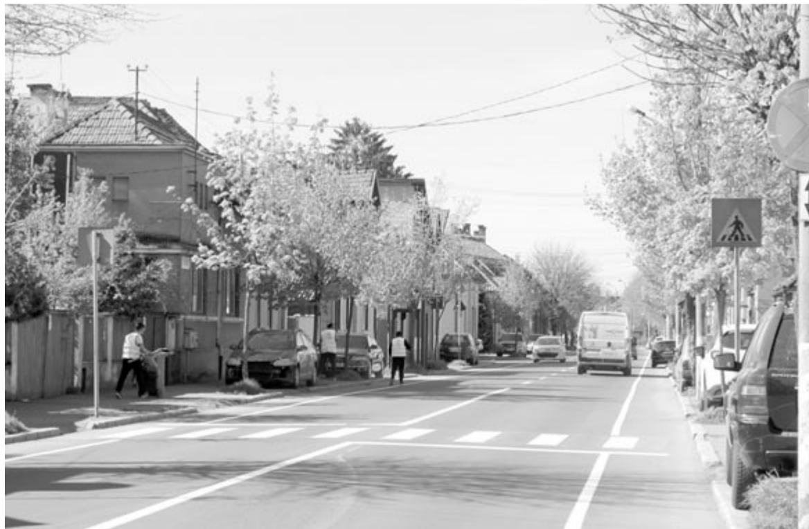
Ismét kétirányú a forgalom a Szabadság utcában

Májustól a George Enescu utcát is lezárják (ahol szintén sétálóutca lesz), ugyanis a szomszédban elkezdődik a mélygarázs építése, mivel Marosvásárhelyen a parkolóhelyek száma nagyon kevés. A főtéri övezetben jelenleg 360 parkolóhely van, az épülő mélygarázs pedig 270 parkolási lehetőséget biztosít majd a sofőrök számára. A kis utcákban lévő parkolóhelyeket sorra számolják majd fel, ezáltal bővülni fognak a járdák, és biciklitak is lesznek.