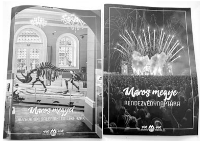
A két kiadvány

A Visit Maros Egyesület minden lehetőséget megragad, hogy népszerűsítse a megye turizmusát. Ennek érdekében a közösségi médiában is jelen van, hirdeti a látványosságokat és az eseményeket, illetve a budapesti repülőjáratot is össze akarja társítani egy háromnapos ki-