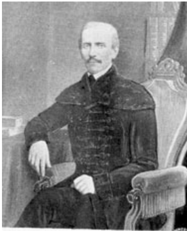
Gróf Kemény József

Aki próbálkozott már rejtvények készítésével, jól tudja, minő találgatás kell egy igazán szellemes, még a legjobbakat is elgondolkodtató rejtvény megalkotásához. A magyar történelem és irodalom egyik zseniális elméje, gróf Kemény József a legnagyobb tudósoknak adta fel a leckét elmés húzásaival.