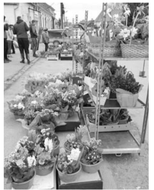
Pompás színeket kínáltak a székelybéli virágok

tetet hozott magával: A méhészet művészete csupa művelődéstörténeti olvasmány, a méhészet összefoglalója a magyar és egyetemes kultúrával és történelmmel. Az ugyancsak magyarországi méhész és szakíró Ádám testvér Méhészet a buckfasti apátságban című munkáját hozta el magyar nyelven a Nyáradmentére. Az érdekes információkhoz jutó mintegy félszáz érdeklődőt (és az előadókat is) a nyárádszeredai Ifjú Bekecs néptáncgyűjtés színes fellépése is megörvendeztette. A rendezvény az Erdélyi Magyar Méhészegyesület és az SZGE szervezte.