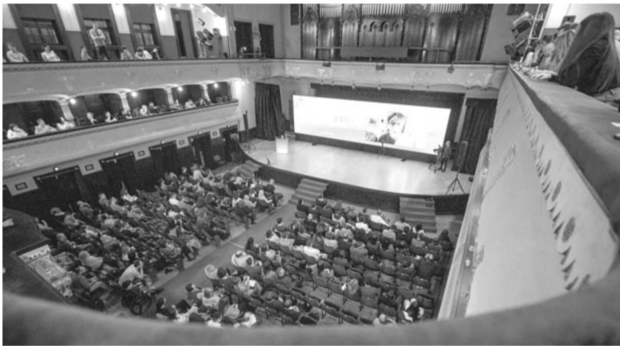
Megtelt a Kultúrpalota a Limitless második kiadásán is

Az informatikusoknak – és nemcsak nekik – szóló konferencia ötlete két évvel ezelőtt született meg, a szervezők mertek nagyot álmodni, és a támogatóiknak köszönhetően valóra váltották az álmukat. Ha minden jól alakul, a jövőben is lesz folytatása mind a Limitlessnek, mind pedig a hackathonnak, hiszen sokkal jobb együtt dolgozni és tenni a közösségért, mintsem panaszkodni azért, hogy mi nincs meg.