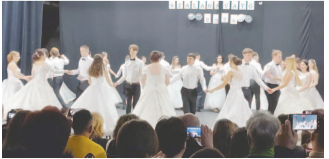
A végzősök tánca az egyik legszebb momentuma az ünnepségnek