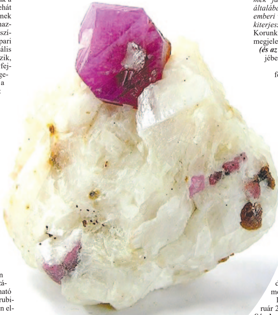
Korund – a 2024. év ásványa

Kelt 2014. február 23-án, 581 évvel Mátyas király születése után