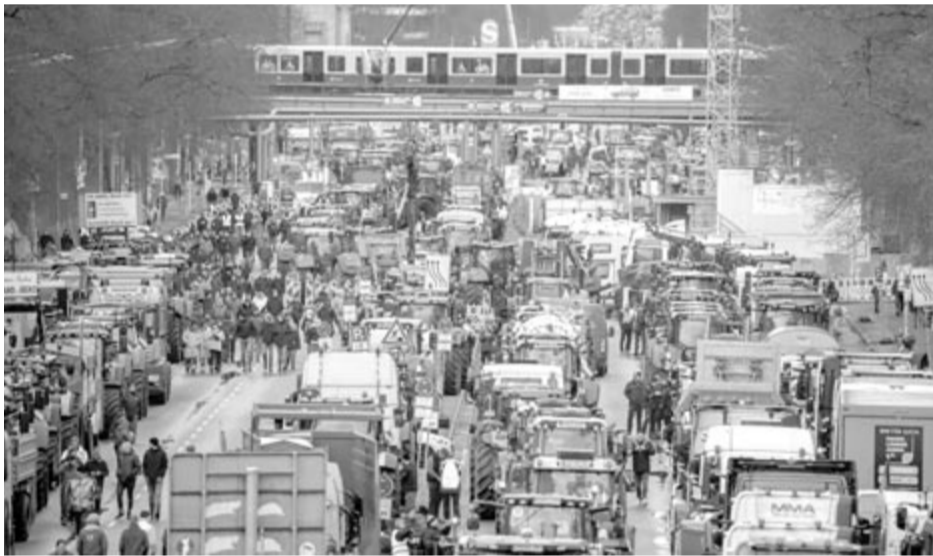
Francia gazdák tüntetése

A miniszterelnök azt ígéri, hogy különleges státuszt biz-